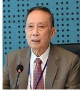
นายพลอดประสพ สุรัสวดี ประธานคณะกรรมการ