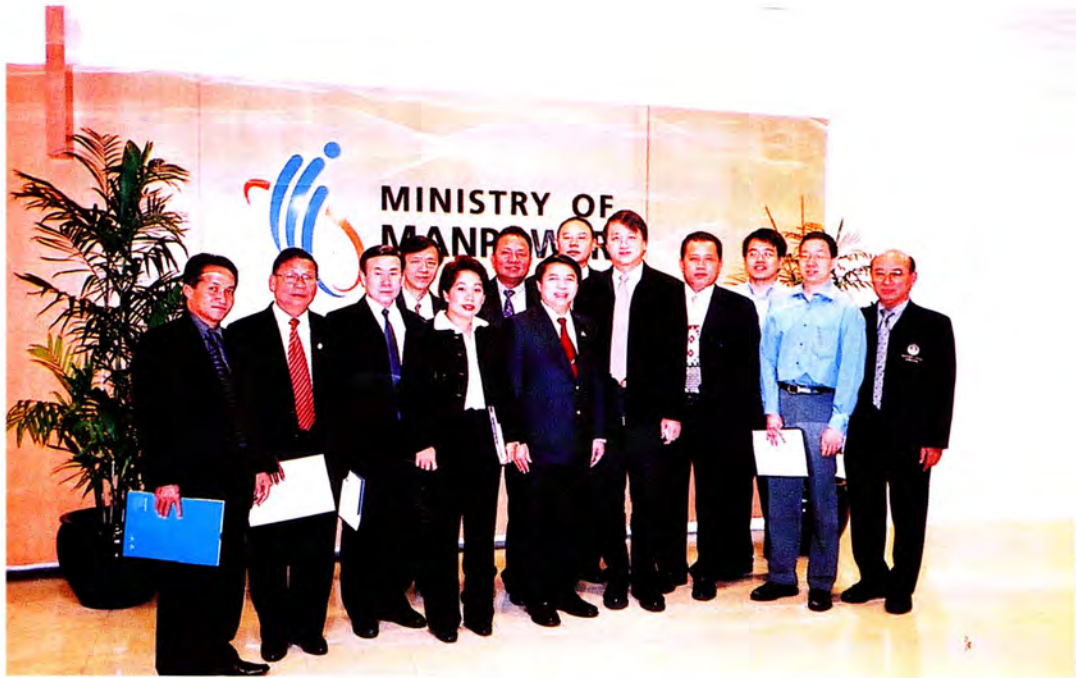
คณะกรรมการเข้าพบเจ้าหน้าที่ระดับสูง ของกรมสวัสดิการและคุ้มครองแรงงาน สาธารณรัฐสิงคโปร์