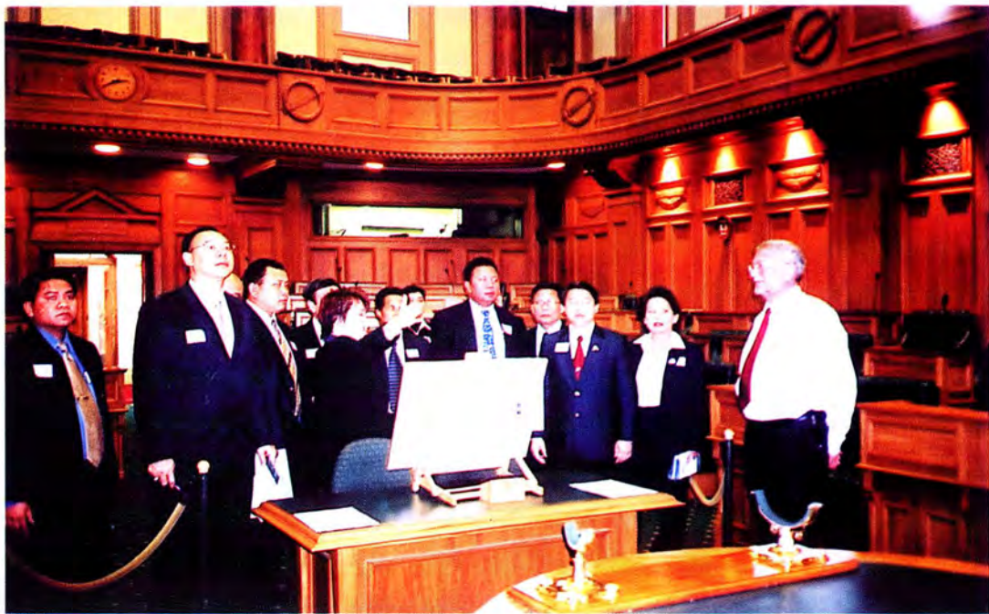
คณะกรรมการเข้าเยี่ยมชมห้องประชุมรัฐสภา ของประเทศนิวซีแลนด์