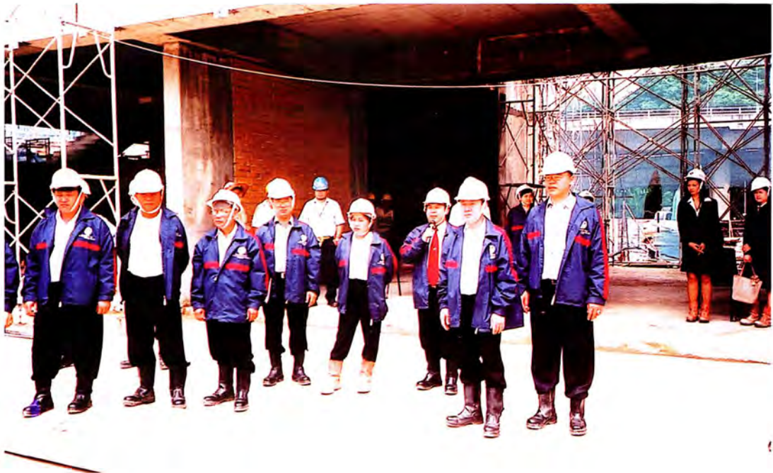
คณะกรรมการเยี่ยมชมคนไทย ที่ทำงานอยู่ที่บริษัท ซิมิซี คอร์ปอเรชั่น