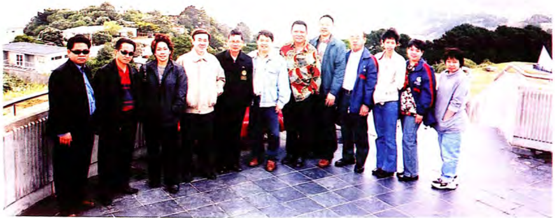
คณะกรรมการเยี่ยมชมเมืองเวลดิงตัน ชมอาคารเก่าแกในยุควิกตอเรีย ที่ยังหลงเหลือให้เห็นอยู่ในปัจจุบัน