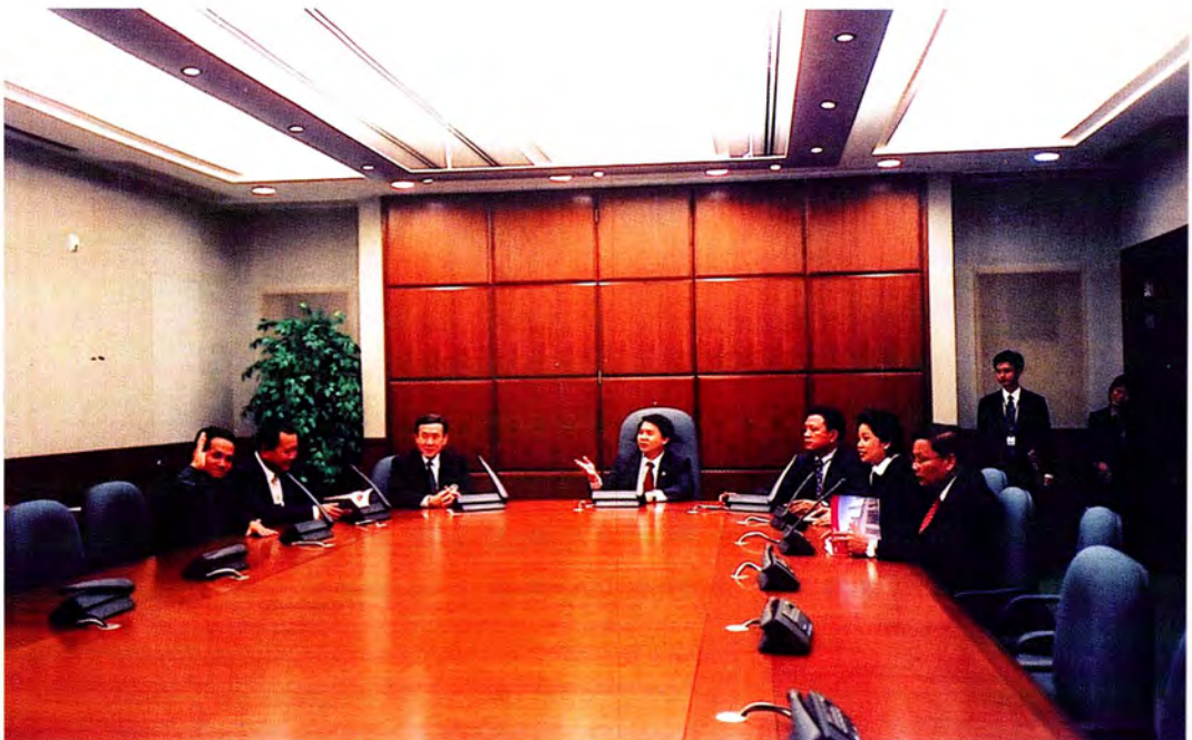
คณะกรรมการเข้าเยี่ยมชมห้องประชุมคณะกรรมการ ของสาธารณรัฐสิงคโปร์