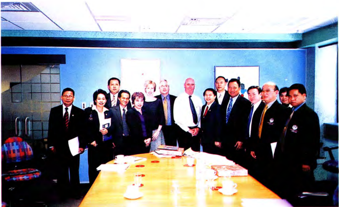
คณะกรรมการเข้าพบคณะผู้บริหารกระทรวงแรงงานนิวซีแลนด์ ณ DEPARTMENT OF LABOUR UNYSIS HOUSE