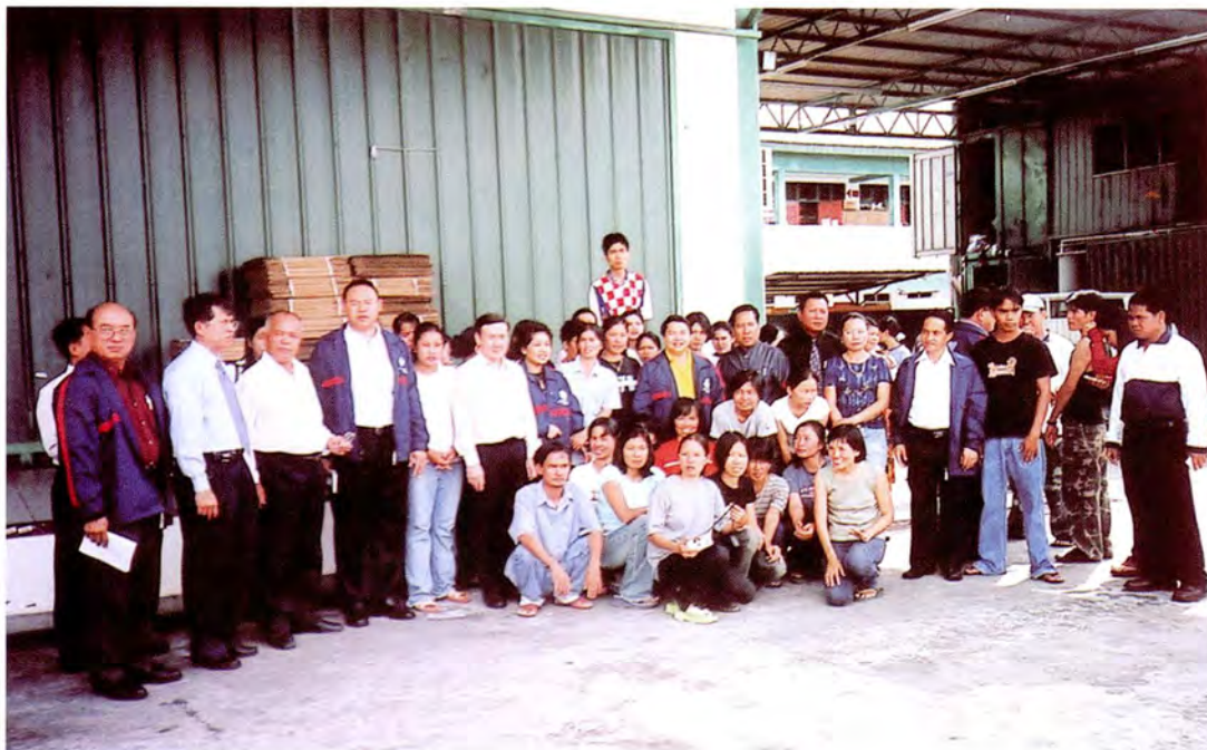
คณะกรรมการเยี่ยมและรับเรื่องร้องทุกข์ของแรงงานไทย ที่ทำงานอยู่ที่บริษัท PERKASA TRADING MANUFACTURING ประเทศเนการาบรูไนดารุสซาลาม