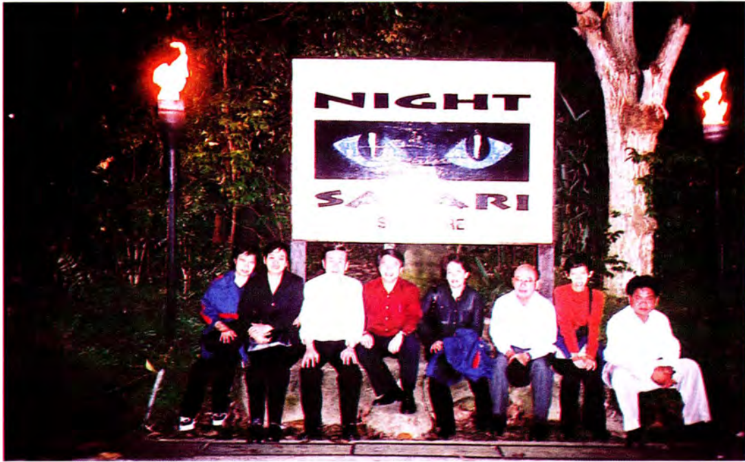
คณะกรรมการเยี่ยมชม NIGHT SAFARI ของสวนสัตว์แห่งแรกและแห่งเดียวในโลกของสาธารณรัฐสิงคโปร์