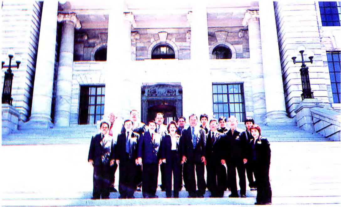
คณะกรรมการถ่ายภาพที่ระลึกหน้ารัฐสภา ประเทศนิวซีแลนด์