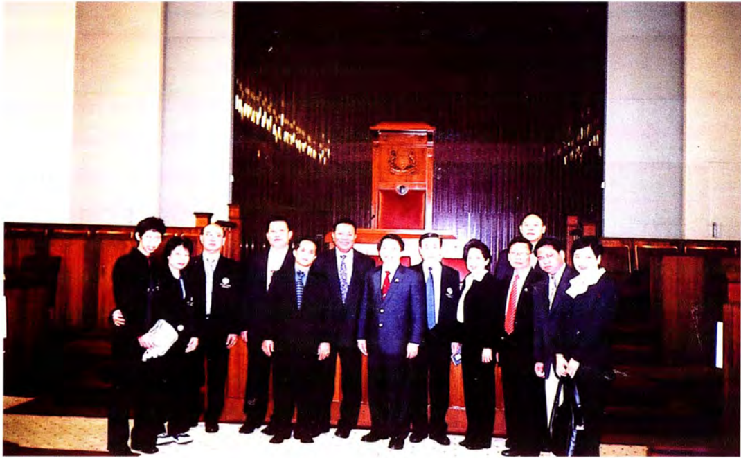
คณะกรรมการเข้าเยี่ยมชมรัฐสภา ของสาธารณรัฐสิงคโปร์