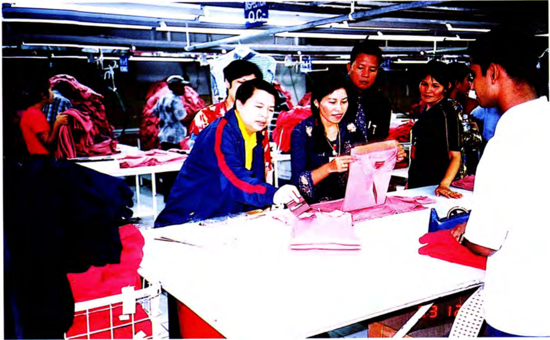
คณะกรรมการไปเยี่ยมคนงานไทยที่ทำงาน ที่โรงงานตัดเย็บเสื้อผ้าสำเร็จรูป JATI FREEDOM TEXTILE SDN.BHD. ประเทศเนการาบรูไนดารุสซาลาม