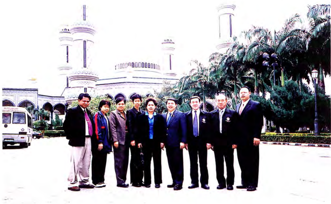
คณะกรรมการเยี่ยมชมมัสยิดโอมาร์ท์ อาลี ไช ฟูดดิน ที่ตั้งงามที่สุดในเอเชียตะวันออกเฉียง ณ เนการาบรูไนดารุสซาลาม