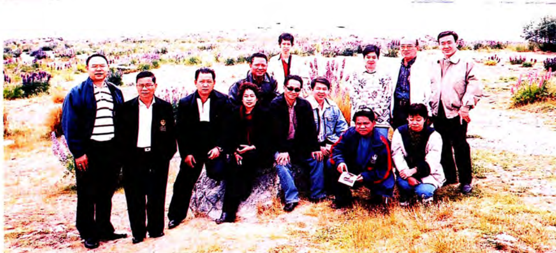
คณะกรรมการเยี่ยมชมทะเลสาบเทคาโป บนที่ราบแคนเทอร์เบอรี