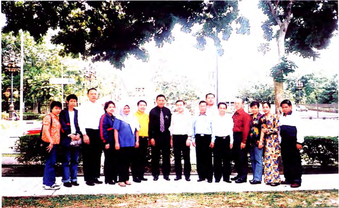
คณะกรรมการถ่ายภาพที่ระลึกหน้าพระราชวังอิสตานา เนการาบรูไนดารุสซาลาม