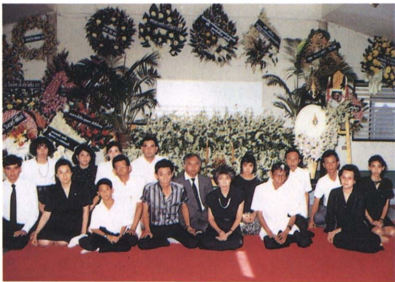
ลูกและหลาน