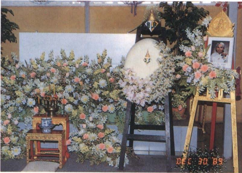
หลังจากสวดพระอภิธรรม 7 วัน ย้ายศพจากศาลาขาลาดำรง ไปยังศาลาจิตสนธิ (สमानมิตร)