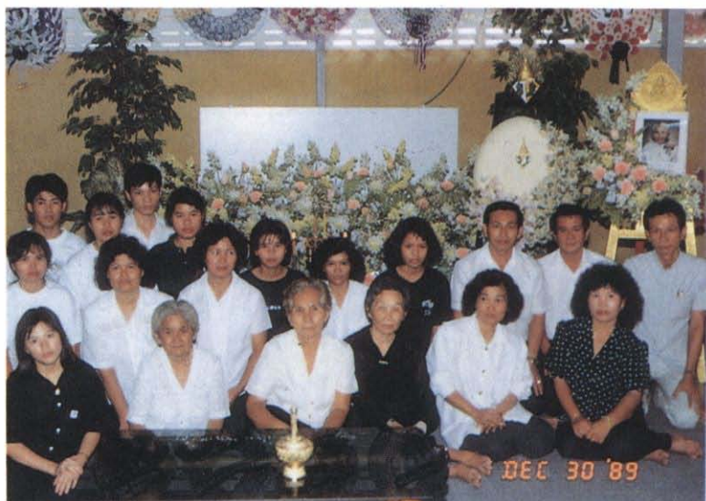
พนักงานทิพย์นิยม