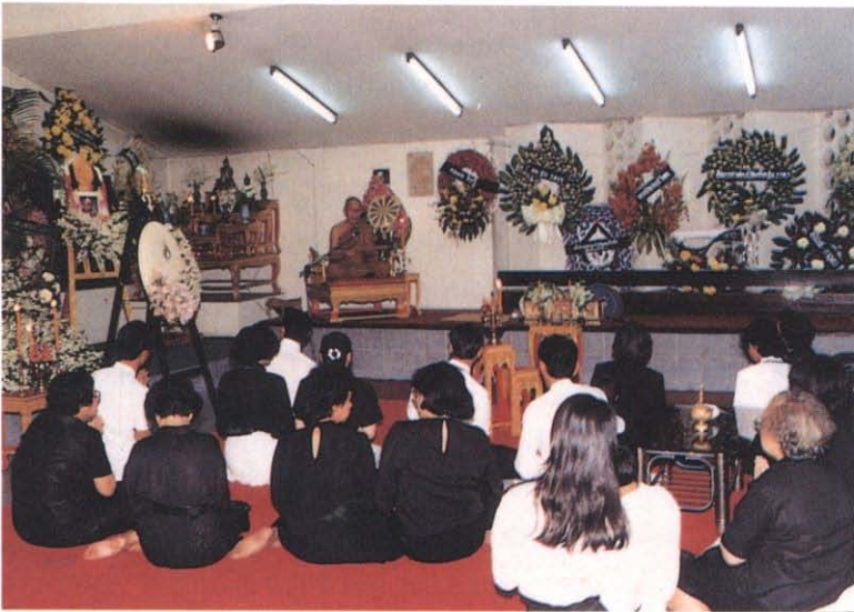
พระธรรมปาโมกข์ เจ้าอาวาสวัดธาตุทอง แสดงพระธรรมเทศนา