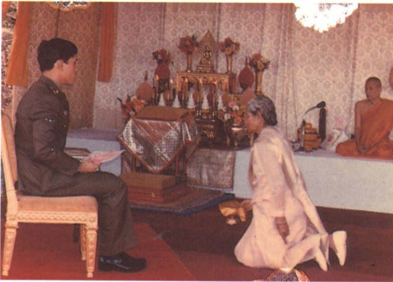
พิธีวางศิลาฤกษ์มณฑปครอบรอยพระพุทธรบาท วัดวชิราลงกรณวราราม อำเภอปากช่อง จังหวัดนครราชสีมา