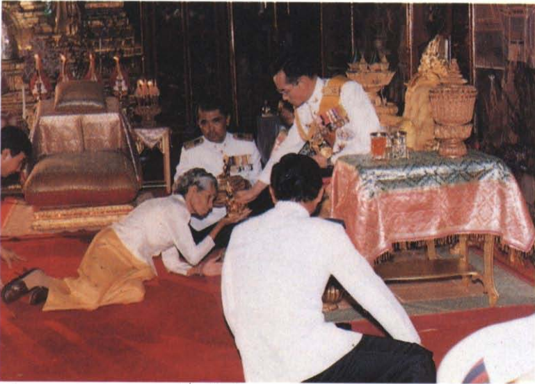
รับพระราชทานพระพุทธรูปที่ระลึก ในงานพระราชทานผ้าพระกฐิน ณ วัดราชประดิษฐาน์