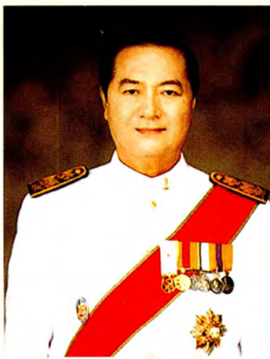
นายสนธิ วรปัญญา ประธานวุฒิสภา