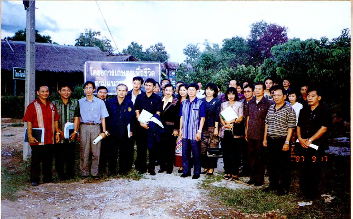
การศึกษาดูงานด้านการป้องกันและแก้ไขปัญหาเสพติด รวมทั้งมาตรการในการป้องกันและแก้ไขปัญหาการค้าหญิงและเด็ก ณ จังหวัดเชียงราย ระหว่างวันที่ ๒๕ - ๒๖ ตุลาคม ๒๕๔๓