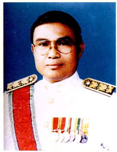
ศาสตราจารย์ ดร.บุญทัน ดอกไธสง รองประธานวุฒิสภา คนที่สอง