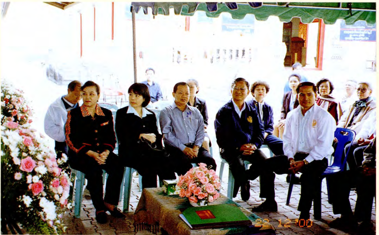
การศึกษาดูงานด้านการพัฒนาคุณภาพชีวิตและการจัดระบบสวัสดิการแก่ผู้สูงอายุ ณ จังหวัดน่าน ระหว่างวันที่ ๒๒ - ๒๓ ธันวาคม ๒๕๔๓