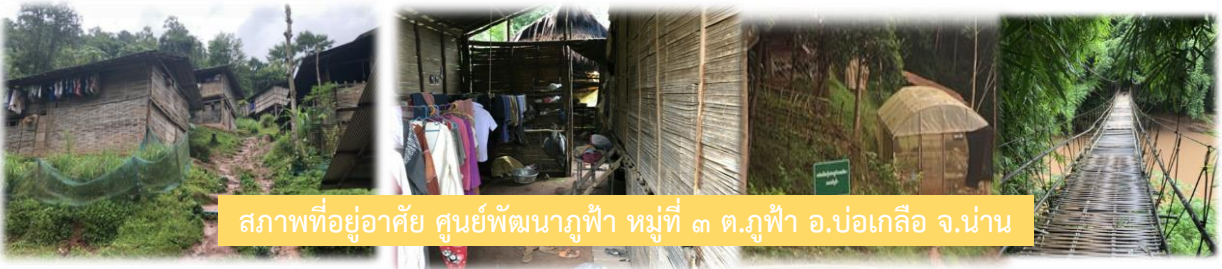
สภาพที่อยู่อาศัย ศูนย์พัฒนาภูฟ้า หมู่ที่ ๓ ต.ภูฟ้า อ.บ่อเกลือ จ.น่าน