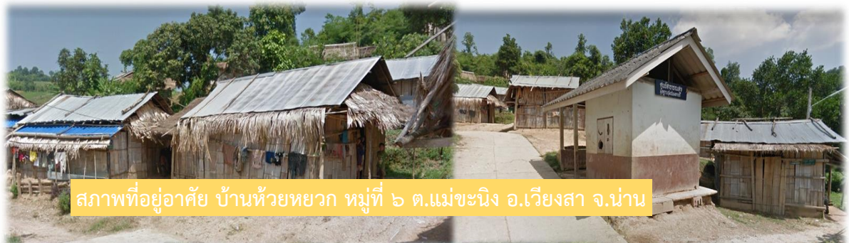
สภาพที่อยู่อาศัย บ้านห้วยหยวก หมู่ที่ ๖ ต.แม่ชะนิง อ.เวียงสา จ.น่าน