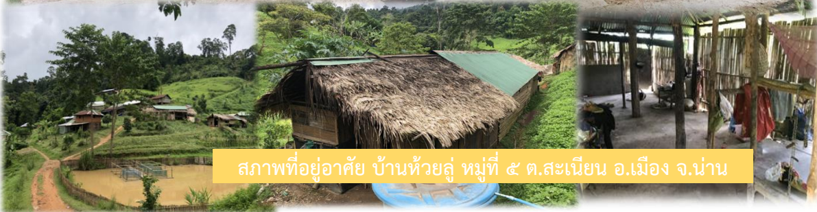
สภาพที่อยู่อาศัย บ้านห้วยลู่ หมู่ที่ ๕ ต.สะเนียน อ.เมือง จ.น่าน