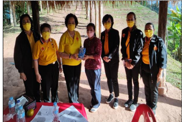
คณะกรรมการแลกเปลี่ยนความคิดเห็นกับผู้แทนหน่วยงานในพื้นที่