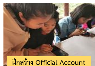
ฝึกสร้าง Official Account