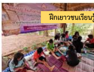
ฝึกเยาวชนเรียนรู้การผลิต

และในวันที่ ๑๗ กันยายน ๒๕๖๕ มหาวิทยาลัยเทคโนโลยีพระจอมเกล้าธนบุรี ได้เชิญทางกลุ่มร่วมออกบูธจำหน่ายสินค้า ที่จังหวัดนครศรีธรรมราช อีกด้วย