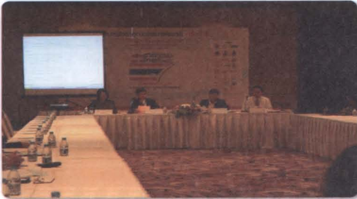
เครือข่ายข้าราชการและการเมือง