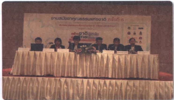
เครือข่ายศาสนา