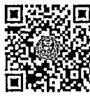
กระทู้ถามสด ด้วยวาจา