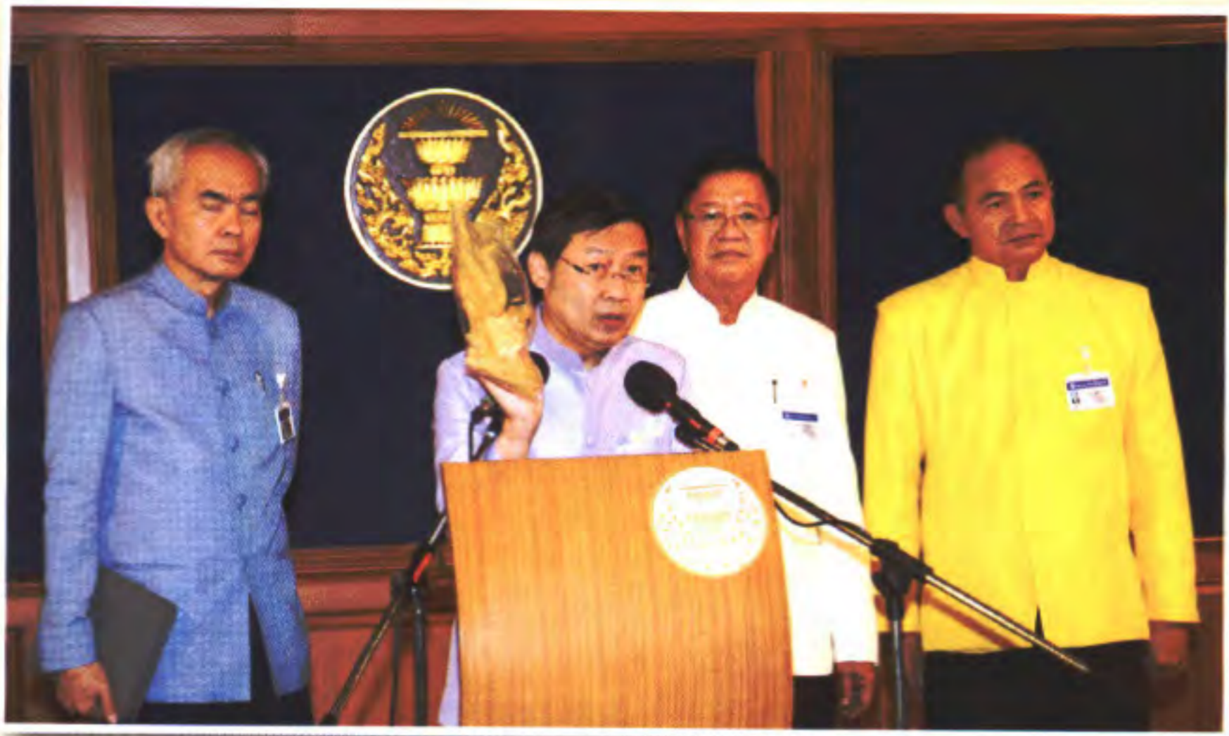
๑๕ ตุลาคม ๒๕๕๘ ณ อาคารรัฐสภา ๑ กรุงเทพฯ 15 October 2015, at the Parliament Building 1, Bangkok