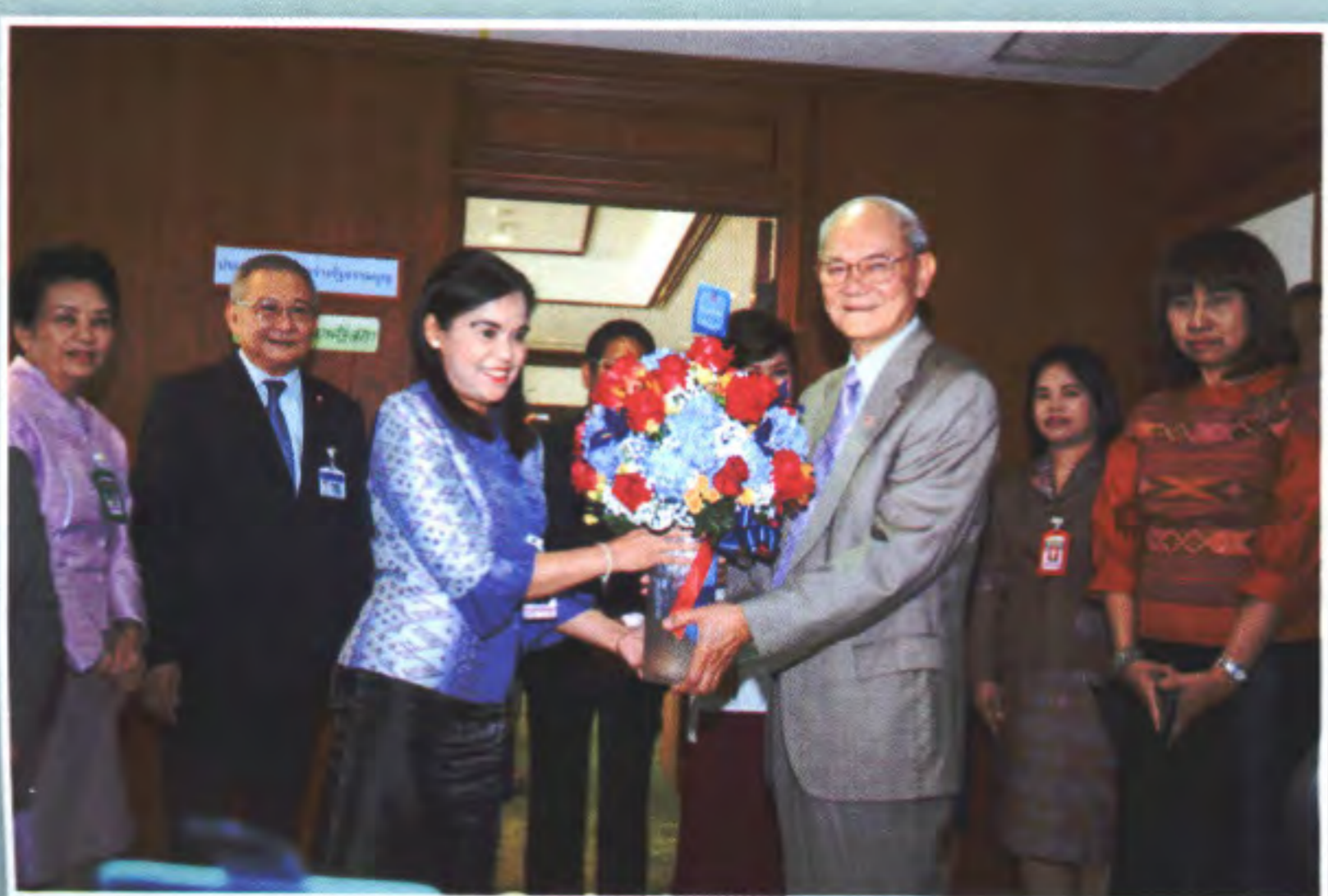
๖ ตุลาคม ๒๕๕๘ ณ อาคารรัฐสภา ๓ กรุงเทพฯ