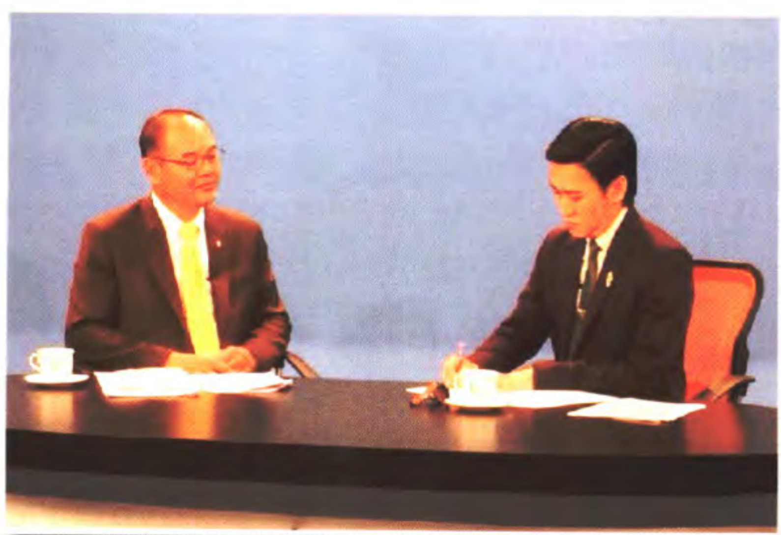
๒๑ ตุลาคม ๒๕๕๘ 21 October 2015