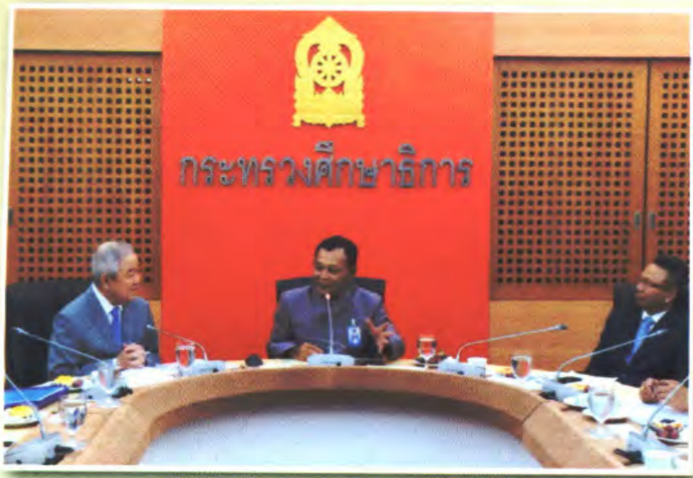
๒๐ ตุลาคม ๒๕๕๘ ณ อาคารราชวัลลภ กระทรวงศึกษาธิการ กรุงเทพฯ 20 October 2015, at Ratchawanlop Building, Ministry of Education, Bangkok