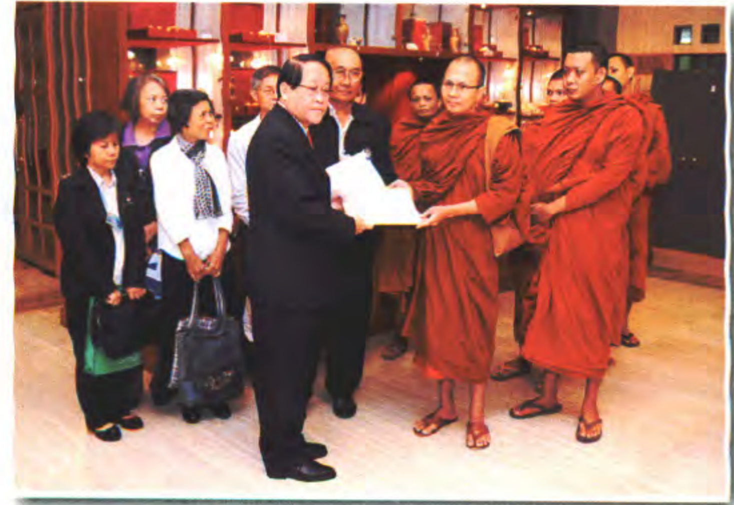
๒๐-๒๕ ตุลาคม ๒๕๕๘ ณ จังหวัดเชียงราย และแคว้นสิบสองปันนา สาธารณรัฐประชาชนจีน 20-25 October 2015, at Chiang Rai Province, and Xishuangbanna region, Republic of China