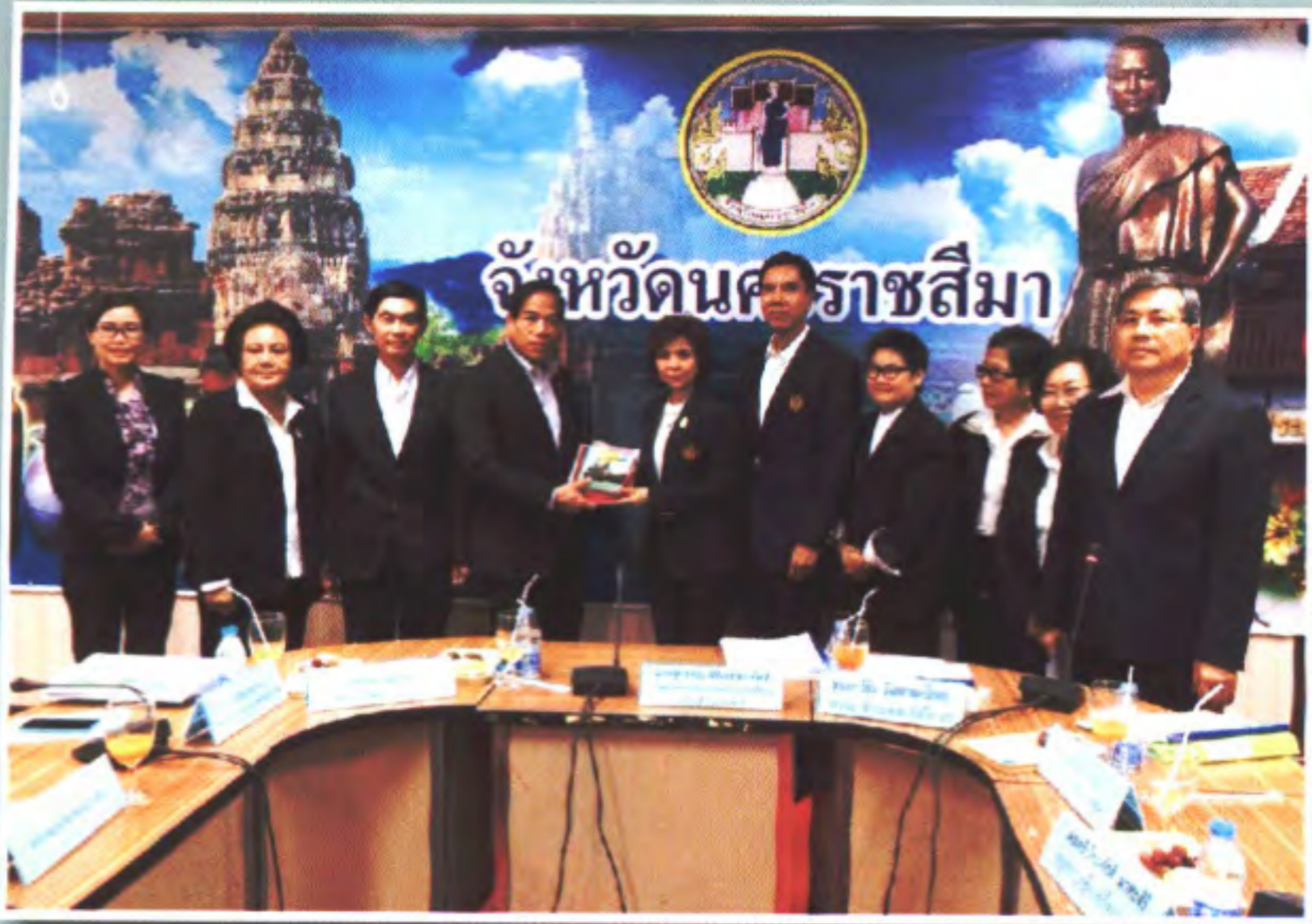
๒๗-๒๘ ตุลาคม ๒๕๕๘ ณ จังหวัดบุรีรัมย์และจังหวัดนครราชสีมา