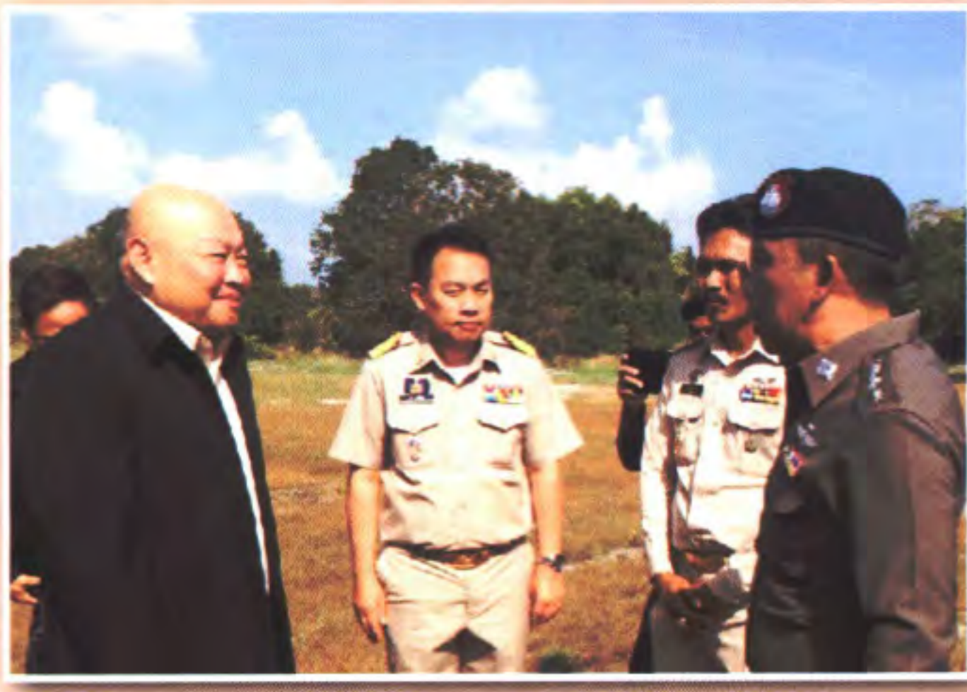
๑๒-๑๓ ตุลาคม ๒๕๕๘ ณ จังหวัดสงขลาและจังหวัดปัตตานี 12-13 October 2015, at Songkhla Province and Pattani Province