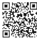
บันทึกการประชุมสภา สำนักrayงาน การประชุมและตัวเลข