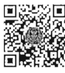
กระทู้ถามสด ด้วยวาจา