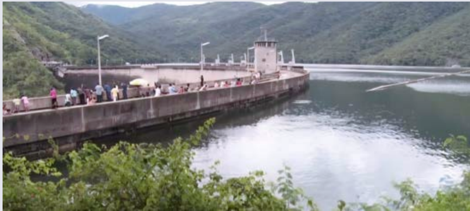
เขื่อนภูมิพล