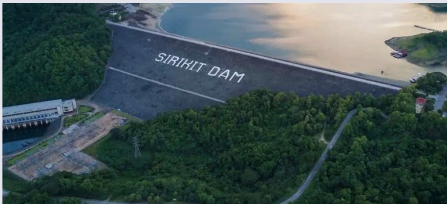
เขื่อนสิริกิติ์

ในการระบายน้ำเกิดขึ้นเป็นระยะ ๆ โดยเฉพาะปัญหาการเกิดน้ำท่วมบริเวณพื้นที่ท้ายเขื่อน เนื่องจากฝนตกหนัก รวมถึงสถานะน้ำทะเลหนุน ทำให้การระบายน้ำเป็นไปได้อย่างไม่เต็มศักยภาพ ส่งผลให้ ๒๑ จาก ๓๓ เขื่อน เกิดสถานการณ์น้ำล้นเขื่อน (ปริมาณน้ำเกินระดับกักเก็บปกติ) และถึงแม้เขื่อนภูมิพลและเขื่อนสิริกิติ์จะไม่เกิดสถานการณ์น้ำล้นเขื่อน แต่ก็จำเป็นต้องเร่งระบายน้ำผ่านทางน้ำล้น (spillway) ซึ่งเป็นเหตุการณ์ที่เกิดขึ้นไม่บ่อยนักสำหรับ ๒ เขื่อนนี้ ทั้งนี้ แม้เขื่อนต่าง ๆ จะประสบปัญหาในการระบายน้ำ แต่ด้วยปริมาณน้ำที่มากเกินไป ศักยภาพของเขื่อน จึงจำเป็นต้องมีการระบายออกอย่างต่อเนื่อง โดยมีการปรับเพิ่มและลดการระบายเกิดขึ้นเป็นระยะ ๆ ตามความเหมาะสมของสถานการณ์