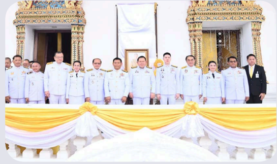
๒๕๖๘ รวมเป็นเงินทั้งสิ้น ๕๕๕,๙๕๓ บาท โดยยังไม่หักค่าใช้จ่าย ●