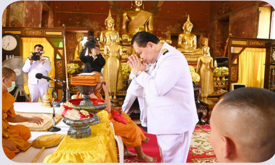
ให้แก่โรงเรียนวัดพระยาทำ สำหรับในปีนี้ได้มีผู้มีจิตกุศลร่วมถวายจตุปัจจัยและทำบุญกฐินพระราชทาน พุทธศักราช