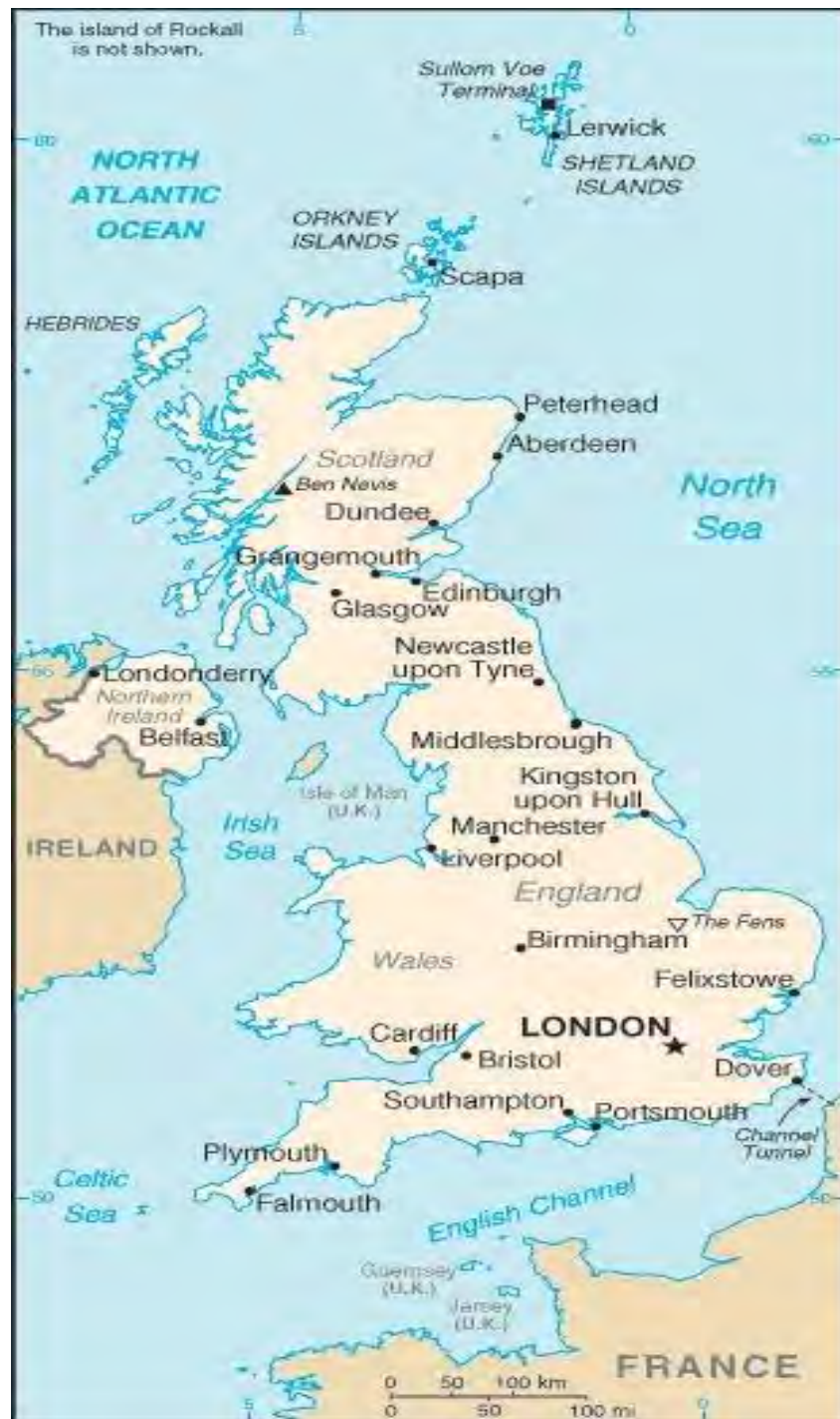
ภาพที่ 1 แผนที่ของสหราชอาณาจักรบริเตนใหญ่และไอร์แลนด์เหนือ