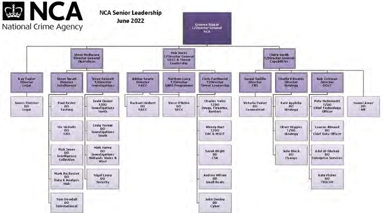
ภาพที่ 5 โครงสร้างของสำนักงานอาชญากรรมแห่งชาติ (National Crime Agency)