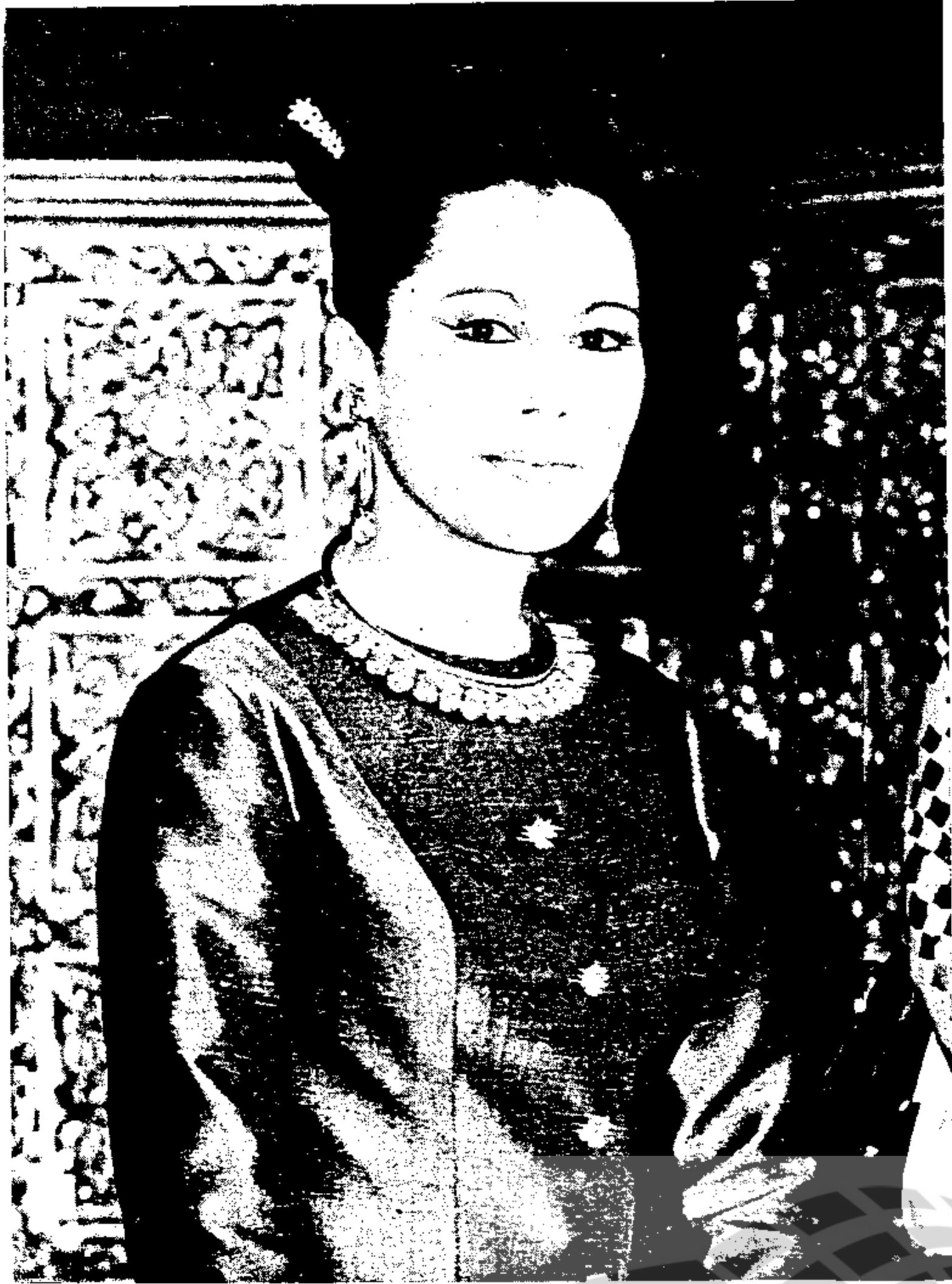
ที่หมายุกา โทตู่ มหาราชินี

ด้วยเกล้าด้วยกระหม่อม ขอเดชะ ข้าพระพุทธเจ้า “คณะหนังสือรัฐสภาสาร”