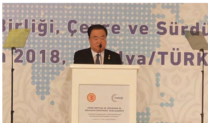
นาย มูน ฮี ซัง (H.E. Mr. Moon Hee Sung) ประธานรัฐสภาแห่งสาธารณรัฐเกาหลี ขณะกล่าวสุนทรพจน์ในพิธีเปิดการประชุม

ที่เป็นศูนย์กลางแห่งหนึ่งของโลกด้านการเมือง เศรษฐกิจ และวัฒนธรรม นอกจากนี้ ยังเน้นย้ำถึงความสำคัญของการร่วมมือระหว่างรัฐสภาต่าง ๆ ในการประชุมประธานรัฐสภาของประเทศในภูมิภาคยูเรเชีย เนื่องจากการประชุมในครั้งนี้ นับเป็นเหตุการณ์ที่สำคัญของผู้ในระดับสูงด้านนิติบัญญัติในการแสวงหาวิธีการแก้ไขปัญหาาร่วมกันและรับมือต่อความท้าทายของโลก ได้แก่ มลภาวะทางสิ่งแวดล้อม สงคราม ความยากจน โรคภัยไข้เจ็บ การก่อการร้าย ภัยธรรมชาติ การคุ้มครองทางการค้า ความมั่นคงด้านอาหาร และอื่น ๆ ซึ่งต้องอาศัยการจัดการผ่านการประสานงานที่ติระหว่างผู้เข้าร่วมการประชุมในเวทีการประชุมระหว่างประเทศ พร้อมกันนี้ ประธานรัฐสภาแห่งสาธารณรัฐตุรกีได้เน้นย้ำถึงความพยายามในการต่อสู้กับการก่อการร้ายที่คุกคามชีวิตความเป็นอยู่และความมั่นคงของพลเมืองจำนวนมาก ต้องอาศัยความสามัคคีระหว่างรัฐสภาในการหาหนทางเพื่อขจัดปัญหาที่เกิดจากความพยายามในการก่อการร้ายด้วยอาวุธสงครามและให้การช่วยเหลือด้านการขนส่งต่าง ๆ โดยได้เรียกร้องให้รัฐสภาสันับสนุนความร่วมมือเพื่อแก้ไขปัญหาความขัดแย้งต่าง ๆ ของภูมิภาค