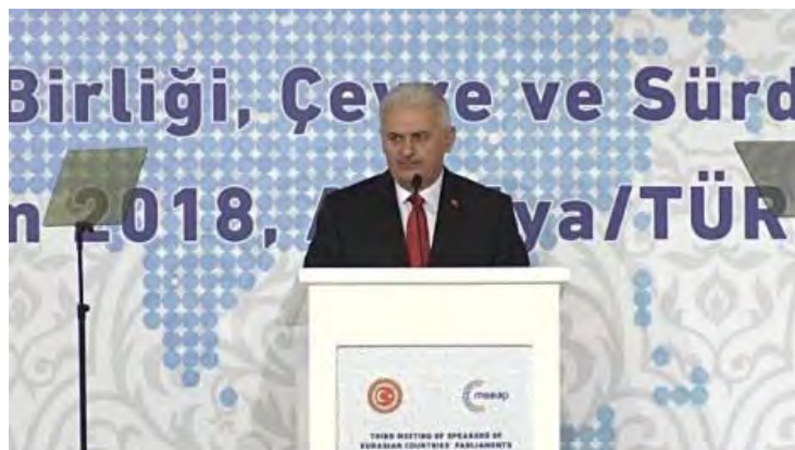
นายบิณาลี ยิลดริม (H.E. Mr. Binali Yildirim) ประธานรัฐสภาแห่งสาธารณรัฐตุรกี ขณะกล่าวสุนทรพจน์ในพิธีเปิดการประชุม

โดยมีนักท่องเที่ยวเดินทางมาเยือนเป็นจำนวนมาก และได้กล่าวขอบคุณประธานรัฐสภาแห่งสหพันธรัฐรัสเซีย และประธานรัฐสภาแห่งสาธารณรัฐเกาหลีที่ได้ริเริ่มการประชุมประธานรัฐสภาของประเทศในภูมิภาคยูเรเชียเมื่อ ๒ ปีที่ผ่านมา ณ กรุงมอสโก สหพันธรัฐรัสเซีย และกรุงโซล สาธารณรัฐเกาหลี ตามลำดับ แม้ว่าทั้งสองประเทศ และสาธารณรัฐตุรกีจะอยู่ห่างไกลกัน แต่ยังมีความร่วมมือและความสัมพันธ์อันดีระหว่างกันอยู่เสมอ ทั้งนี้ ภูมิภาคยูเรเชียนับว่ามีพื้นที่ทางภูมิศาสตร์ขนาดใหญ่จากมหาสมุทรแอตแลนติกถึงมหาสมุทรแปซิฟิก และเป็นภูมิภาค