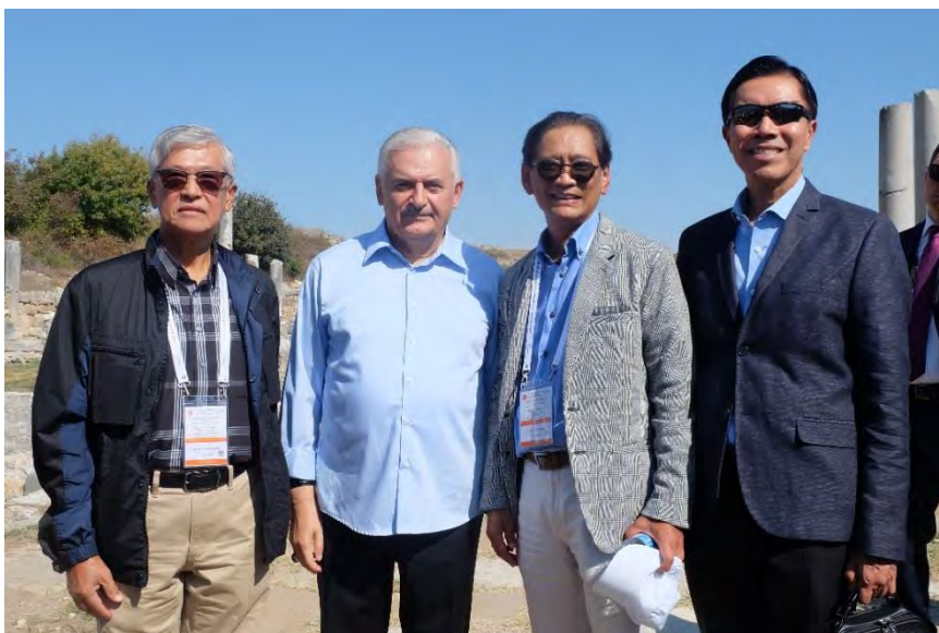
คณะผู้แทนสถานิติบัญญัติแห่งชาติ ถ่ายภาพร่วมกับนายบีนาลี ยิลดริม ประธานรัฐสภาแห่งสาธารณรัฐตุรกี ขณะเยี่ยมชมเมืองโบราณ Perge

ในช่วงเช้าของวันที่ ๑๐ ตุลาคม ๒๕๖๑ คณะผู้แทนสถานิติบัญญัติแห่งชาติ ได้เข้าร่วมตามกำหนดการด้านวัฒนธรรมที่ทางรัฐสภาประเทศเจ้าภาพจัดขึ้น โดยมีนายบีนาลี ยิลดริม (H.E. Mr. Binali Yildirim) ประธานรัฐสภาแห่งสาธารณรัฐตุรกี นำคณะผู้แทนที่เข้าร่วมการประชุมไปเยี่ยมชมสถานที่สำคัญทางประวัติศาสตร์จำนวน ๒ แห่ง คือ เมืองโบราณ Perge (Perge Antique city) และพิพิธภัณฑิ์โบราณคดีแห่งเมืองอันทาลีเย (Antalya Archeology Museum) ภายหลังจากเยี่ยมชมสถานที่ดังกล่าวแล้ว คณะผู้แทนสถานิติบัญญัติแห่งชาติ ได้ร่วมล่องเรือขนาดใหญ่เพื่อชมทัศนียภาพของเมืองอันทาลีเย และเข้าร่วมงานเลี้ยงรับรองอาหารกลางวัน ณ ร้านอาหาร เซเว่น เมฮเมต (7 Mehmet Restaurant) โดยมีนายบีนาลี ยิลดริม (H.E. Mr. Binali Yildirim) ประธานรัฐสภาแห่งสาธารณรัฐตุรกี เป็นเจ้าภาพ เพื่อเป็นเกียรติแก่คณะผู้แทนทุกประเทศที่เข้าร่วมการประชุม