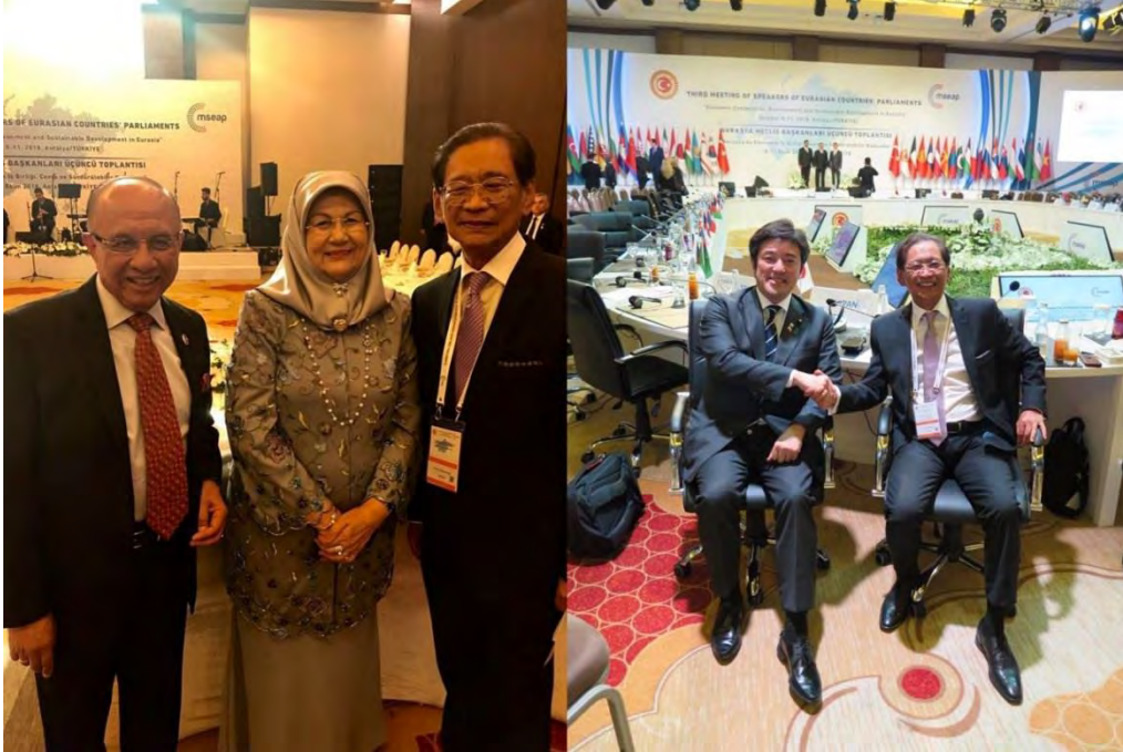
หัวหน้าคณะผู้แทนสภานิติบัญญัติแห่งชาติถ่ายภาพร่วมกับหัวหน้าคณะผู้แทนรัฐสภาบรูไนดารุสซาลาม (ซ้าย) และหัวหน้าคณะผู้แทนรัฐสภาญี่ปุ่น (ขวา) ภายหลังจากหารืออย่างไม่เป็นทางการระหว่างการประชุม