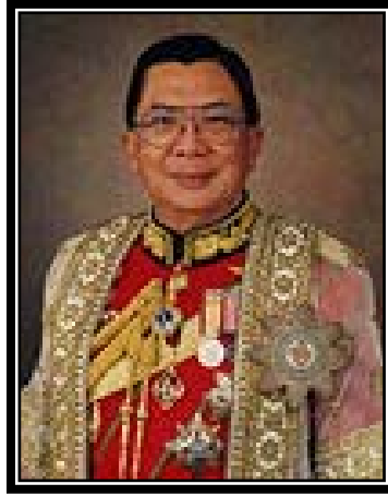
พลเอก ชวลิต ยงใจยุทธ นายกรัฐมนตรี