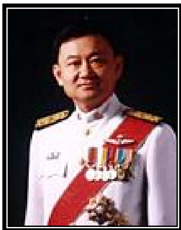
พันตำรวจโท ทักษิณ ชินวัตร นายกรัฐมนตรี