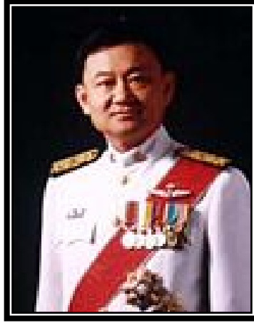
พันตำรวจโท ทักษิณ ชินวัตร นายกรัฐมนตรี