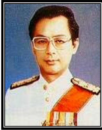
นายชวน หลีกภัย นายกรัฐมนตรี