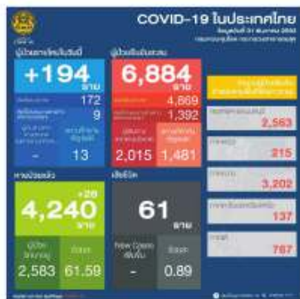
ที่มา: ศูนย์บริหารสถานการณ์แพร่ระบาดของโรคติดเชื้อไวรัสโคโรนา 2019 กระทรวงมหาดไทย (ศบค.มท.) COVID-19 ในประเทศไทย

ทั้งนี้ ณ วันที่ 31 ธันวาคม 2563 ประเทศไทยมีผู้ป่วยสะสมจำนวน 6,884 ราย ผู้ป่วยรักษาหายจำนวน 4,240 ราย และมีผู้เสียชีวิตจำนวน 61 ราย 5 โดยเป็นการติดเชื้อในกลุ่มแรงงานต่างด้าวจากการคัดกรองเชิงรุกจำนวน 1,392 ราย 6 ตามแผนภาพดังนี้