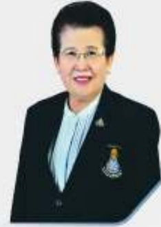
นางประกายรัตน์ ต้นธีรวงศ์ กรรมการสิทธิมนุษยชนแห่งชาติ ทำหน้าที่แทนประธานกรรมการสิทธิมนุษยชนแห่งชาติ เมื่อวันที่ 15 กันยายน 2563