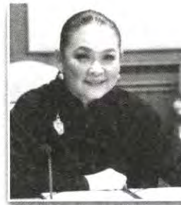
ผู้อำนวยการสถานีวิทยุกระจายเสียง และวิทยุโทรทัศน์รัฐสภา สำนักงานเลขาธิการสภาผู้แทนราษฎร กรรมการ