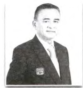
กรรมการผู้อำนวยการสถานีวิทยุ โทรทัศน์กองทัพบก หรือผู้แทน กรรมการ