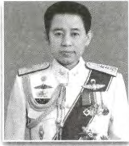
อธิบดีกรมประชาสัมพันธ์ หรือผู้แทน กรรมการ