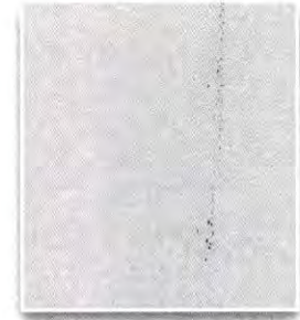
ผู้อำนวยการสำนักงานเลขาธิการวุฒิสภา กรรมการและเลขานุการ