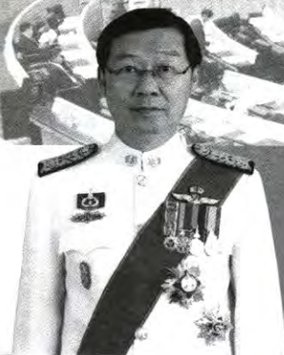
นายสุรชัย เลี้ยงบุญเลิศชัย รองประธานสภานิติบัญญัติแห่งชาติ คนที่หนึ่ง