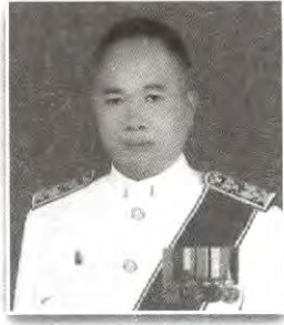
เลขาธิการวุฒิสภา กรรมการ