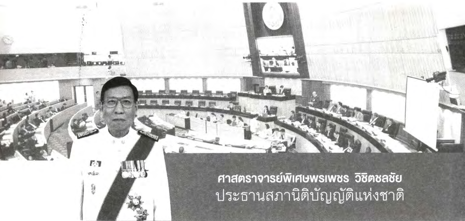
ศาสตราจารย์พิเศษพรเพชร วิชิตชลชัย ประธานสภานิติบัญญัติแห่งชาติ