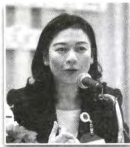
ผู้อำนวยการสำนักประชาสัมพันธ์ สำนักงานเลขาธิการสภาผู้แทนราษฎร กรรมการ