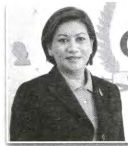
ผู้อำนวยการสถานีโทรทัศน์ ที เอ็น เอ็น ๒ บริษัท ทูริวิชั่นส์ เคเบิล จำกัด (มหาชน) หรือผู้แทน กรรมการ