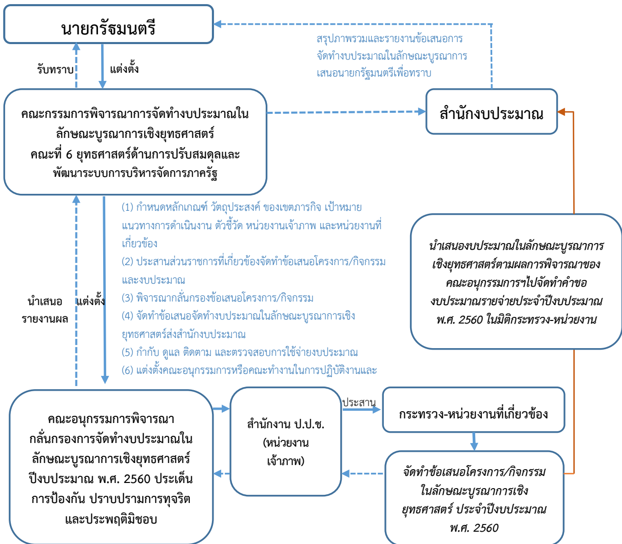
ภาพ 4 การจัดทำคำของบประมาณในลักษณะบูรณาการเชิงยุทธศาสตร์ ประจำปีงบประมาณ พ.ศ. 2560 ประเด็นการป้องกัน ปราบปรามการทุจริตและประพฤติมิชอบ

โดยสรุปขั้นตอนการจัดทำคำของบประมาณในลักษณะบูรณาการเชิงยุทธศาสตร์ ประจำปีงบประมาณ พ.ศ. 2560 ประเด็นการป้องกัน ปราบปรามการทุจริตและประพฤติมิชอบ แสดงดังภาพ 4