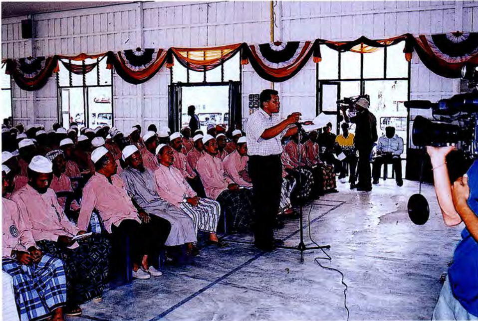
คณะกรรมการรับฟังความคิดเห็นจากผู้นำศาสนาและประชาชน อ.ระแงะ จ.นราธิวาส