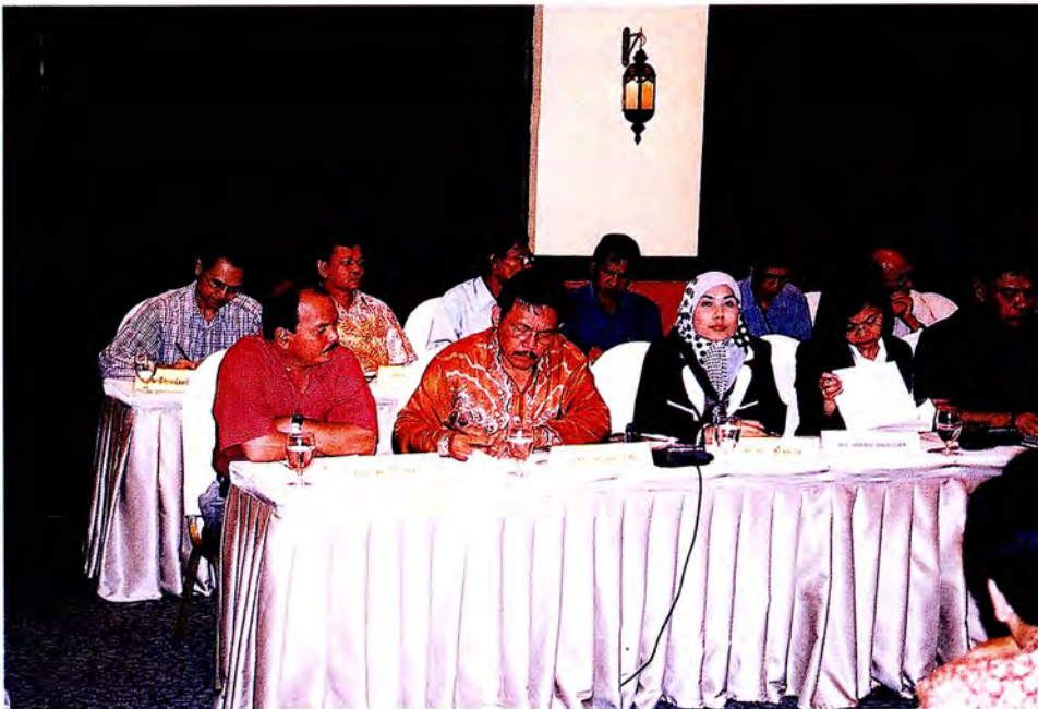
คณะกรรมการการพบหอการค้าจังหวัดปัตตานีและนักวิชาการ มหาวิทยาลัยสงขลานครินทร์ ณ โรงแรม ซี เอส ปัตตานี