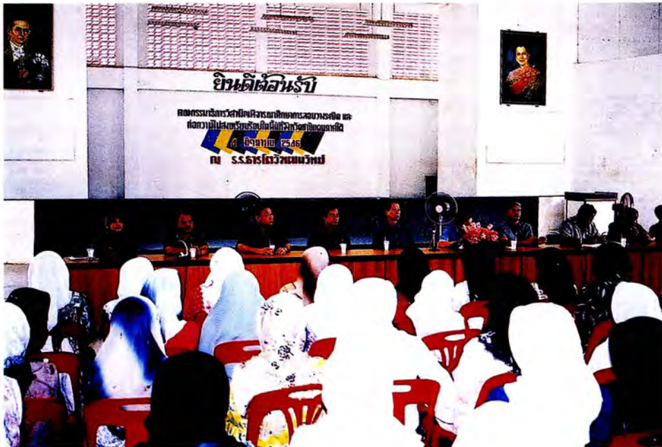
คณะกรรมการรับฟังข้อคิดเห็นและแนวทางแก้ไขปัญหา จังหวัดชายแดนภาคใต้ ณ โรงเรียน ธารโตวัฒนวิทย์ อ.ธารโต จ.ยะลา