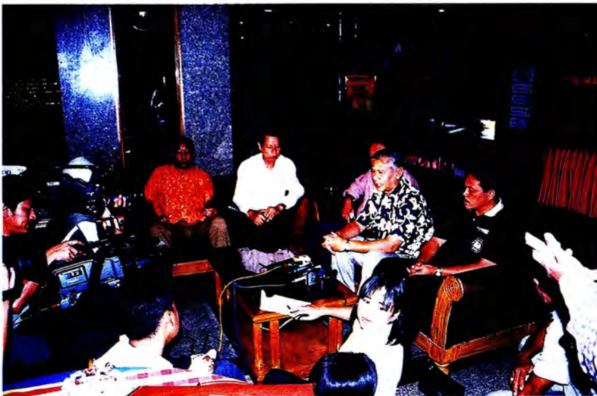
คณะกรรมการแสดงผลการศึกษาของคณะกรรมการใน ๓ จังหวัดชายแดนภาคใต้ ณ โรงแรมเมอร์ลิน อ.เบตง จ.ยะลา