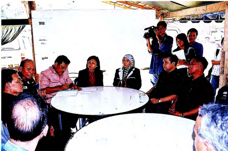
คณะกรรมการการรับฟังความคิดเห็นจากค่าย ตชด. ที่ อ.ระแงะ จ.นราธิวาส