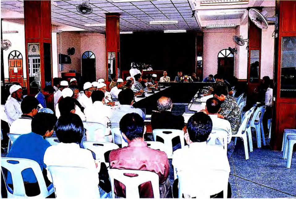
คณะกรรมการการพบคณะกรรมการอิสลามปัตตานี ณ สำนักงานคณะกรรมการอิสลาม ประจำจังหวัดปัตตานี