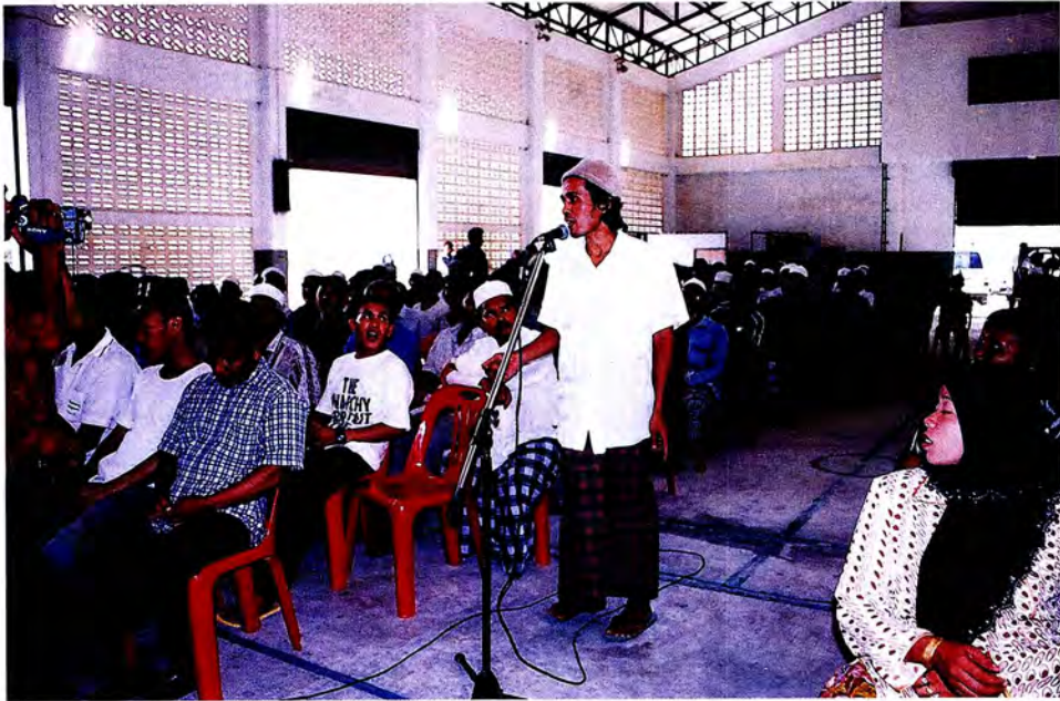
คณะกรรมการรับฟังความคิดเห็นจากประชาชน อ.ธารโต จ.ยะลา