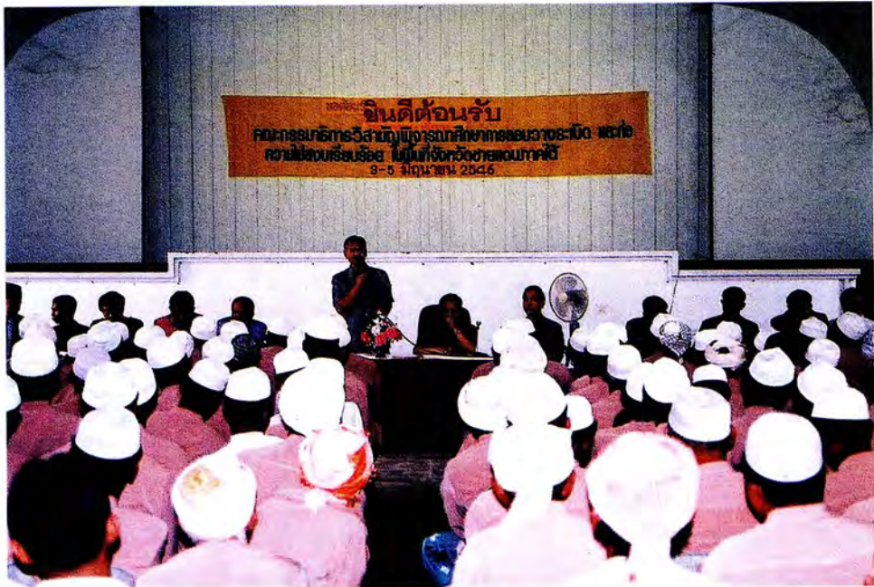
คณะกรรมการการพบผู้นำศาสนา อ.ระแงะ จ.นราธิวาส