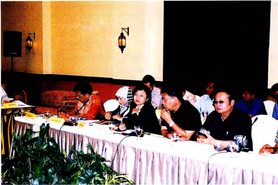
คณะกรรมการพบหารือการค้าจังหวัดปัตตานี ณ โรงแรม ซี เอส ปัตตานี