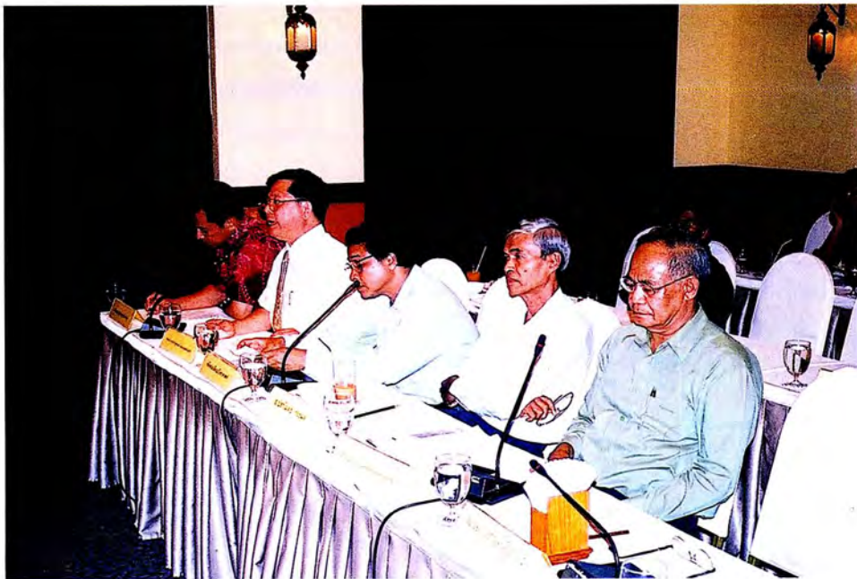
หน่วยงานราชการเข้าร่วมประชุมกับคณะกรรมการ ณ โรงแรม ซี เอส ปัตตานี