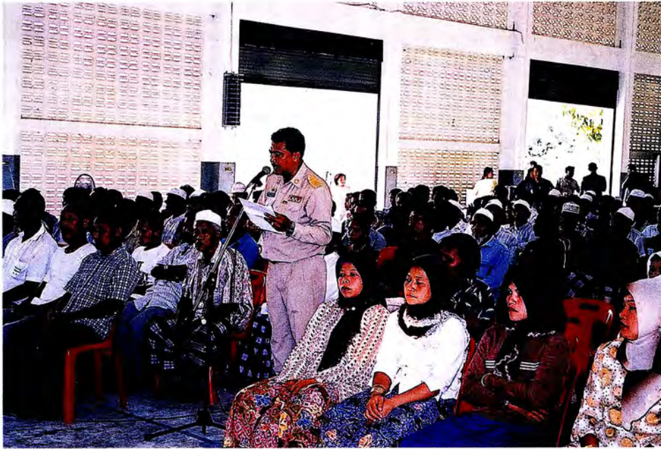
นายอำเภอธารโต จ.ยะลา รายงานสถานการณ์เกี่ยวกับกรณีโจรก่อการร้าย ปล้นอาวุธปืนหน่วยทักษิณพัฒนา ต.บ้านแห่อ อ.ธารโต จ.ยะลา