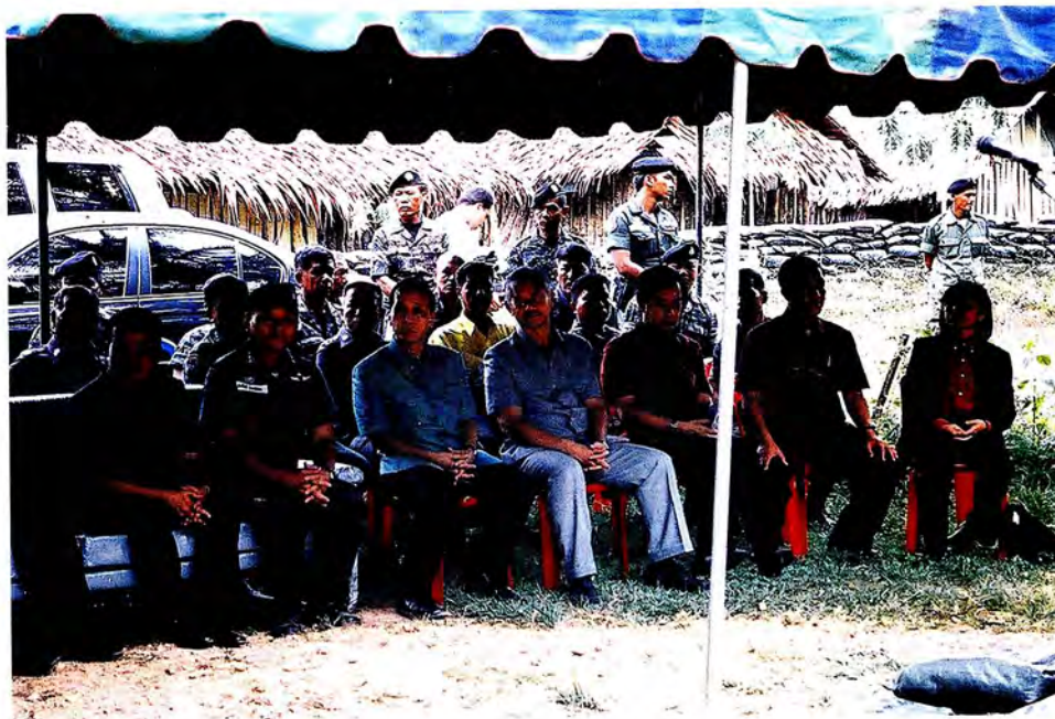
คณะกรรมการรับฟังความคิดเห็นจากกองร้อย ตชด. ที่ อ.ระแงะ จ.นราธิวาส