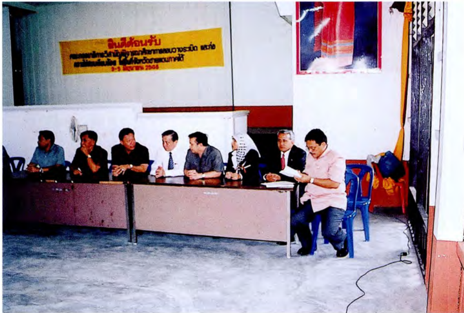
คณะกรรมการการพบผู้นำศาสนาและนักวิชาการ อ.ระแงะ จ.นราธิวาส