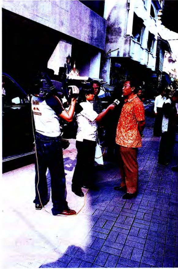
คณะกรรมการแสดงผลการศึกษาของคณะกรรมการใน ๓ จังหวัดชายแดนภาคใต้ ณ โรงแรมเมอร์ลิน อ.เบตง จ.ยะลา