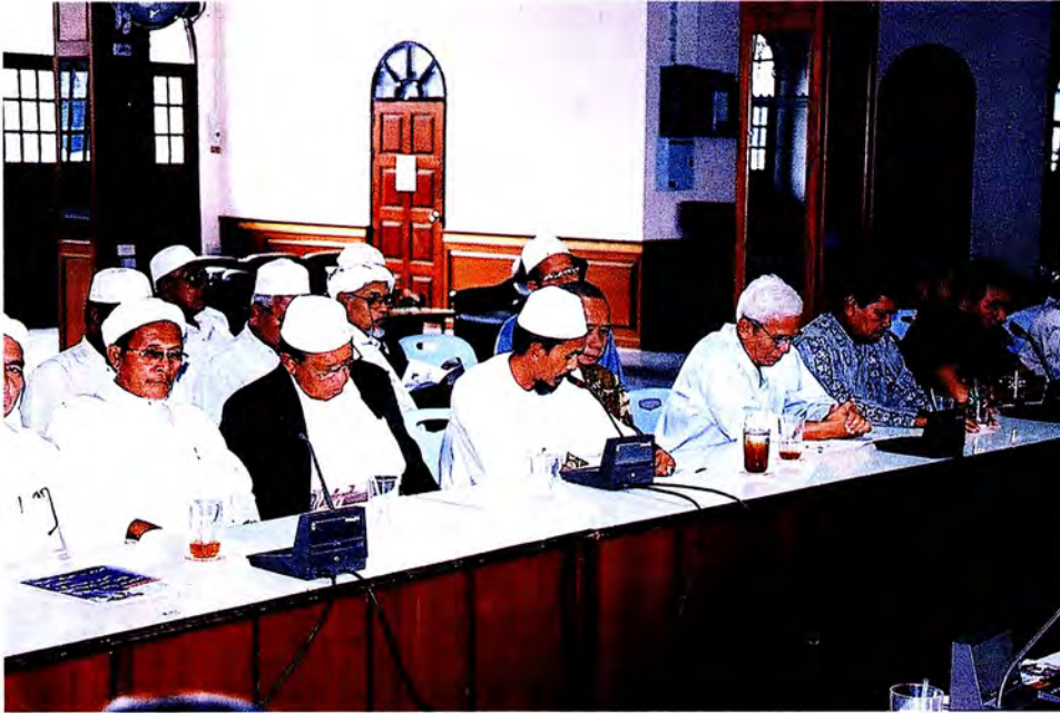
คณะกรรมการการพบผู้นำศาสนา กรรมการอิสลามประจำจังหวัด ๓ จังหวัดชายแดนภาคใต้ ณ สำนักงานคณะกรรมการอิสลามจังหวัดปัตตานี