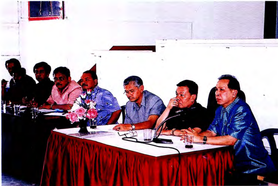
คณะกรรมการรับฟังความคิดเห็นประชุมรวมคณะผู้นำศาสนา ผู้นำท้องถิ่น ณ หอประชุม อ.ระแงะ จ.นราธิวาส