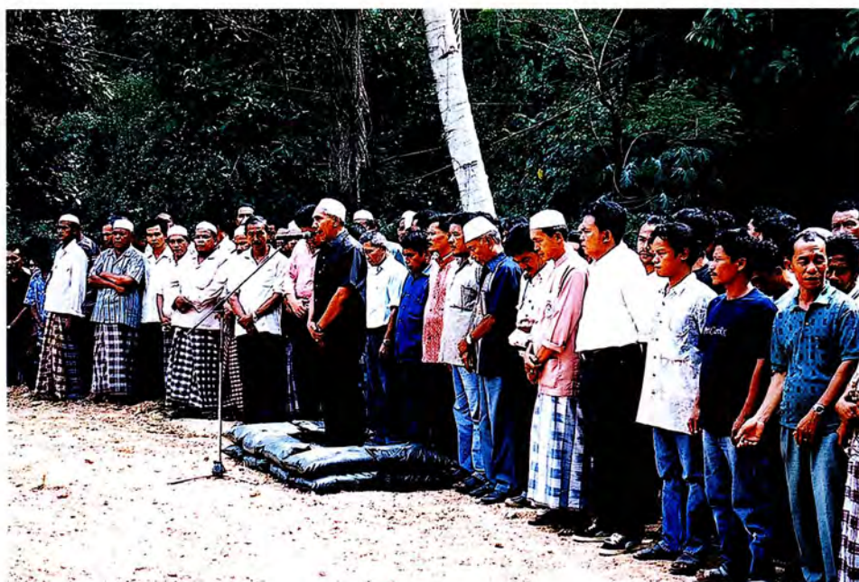
คณะกรรมการร่วมงานพิธีขอมหาของผู้นำศาสนา ผู้นำท้องถิ่น อำเภอระแงะ กรณีตำรวจชายแดนถูกรุมทำร้ายถึงแก่ชีวิตที่ อ.ระแงะ จ.นราธิวาส