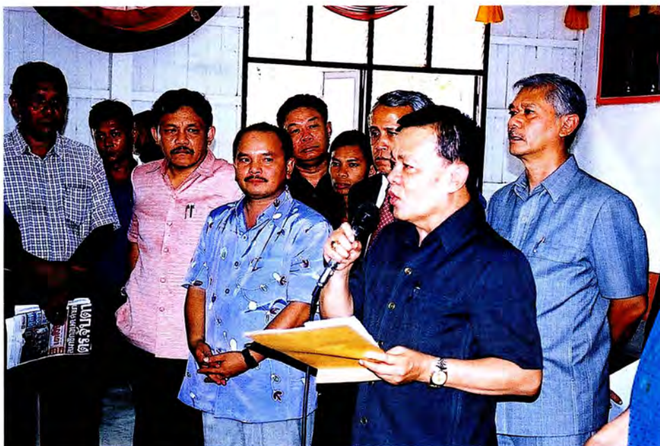
คณะกรรมการการพบประชาชนและผู้นำทางศาสนาที่ อ.ระแงะ จ.นราธิวาส