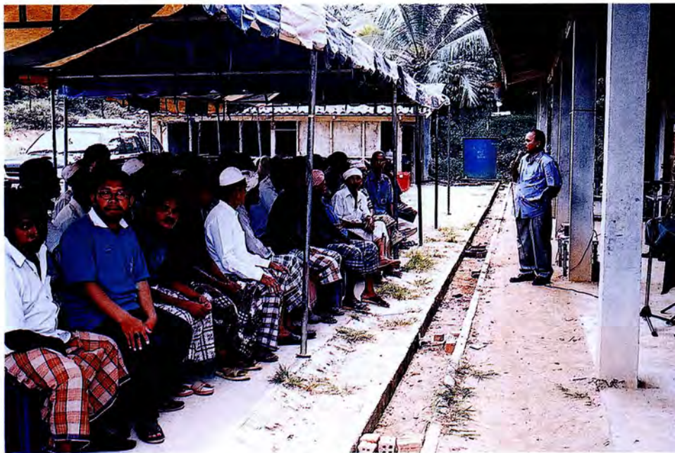
คณะกรรมการรับฟังเรื่องร้องเรียนขอความเป็นธรรม ในกรณีถูกกล่าวหาปล้นปืน ที่หน่วยทักษิณพัฒนาที่ ๑๒ อ. สู้ติริน จ.นราธิวาส เรื่องร้องเรียนขอความเป็นธรรม