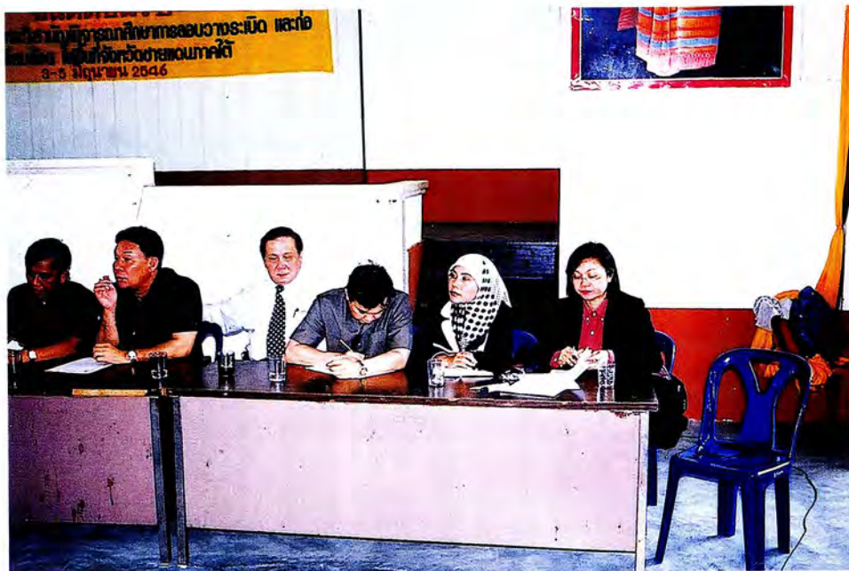
คณะกรรมการพบผู้นำศาสนา อ.ระแงะ จ.นราธิวาส