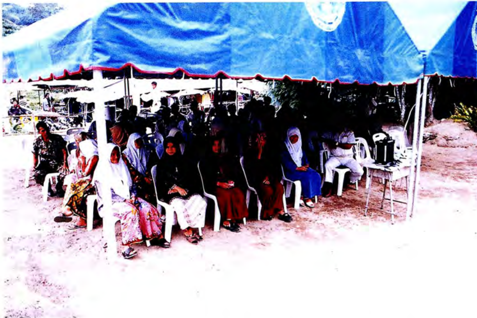
คณะกรรมการรับฟังความคิดเห็นจากประชาชน อ.ระแงะ จ.นราธิวาส