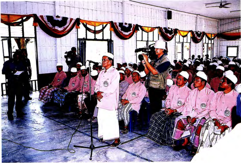
คณะกรรมการการพบผู้นำศาสนา อ.ระแงะ จ.นราธิวาส