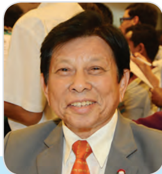
๑๔๖. นายสนธิ อักษรแก้ว สมาชิกสภานิติบัญญัติแห่งชาติ