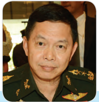
๑๖๔. พลโท สุชาติ ทองบัว สมาชิกสภานิติบัญญัติแห่งชาติ