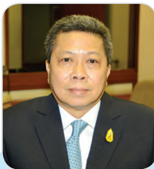
๒๓. พลเอก จีระเดช โหมกชะสมิต สมาชิกสภานิติบัญญัติแห่งชาติ