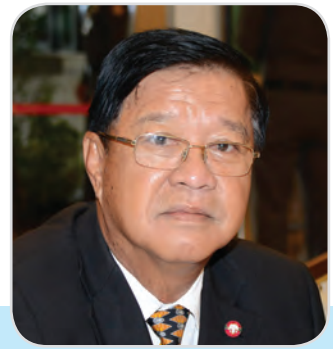
๑๔๐. พลเรือเอก ศิษุวัชร วงษ์สุวรรณ สมาชิกสภานิติบัญญัติแห่งชาติ