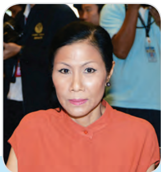
๕. นางกอบกาญจน์ สุริยस्थ्य วัฒนวรารงกูร สมาชิกสภานิติบัญญัติแห่งชาติ