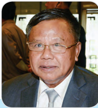
๑๔๓. พลเอก สกล ชื่นตระกูล สมาชิกสภานิติบัญญัติแห่งชาติ