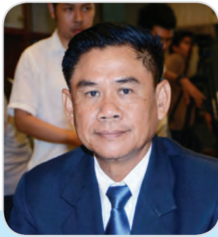
๓๓. พลตรี ชัยยุทธ พร้อมสุข สมาชิกสภานิติบัญญัติแห่งชาติ