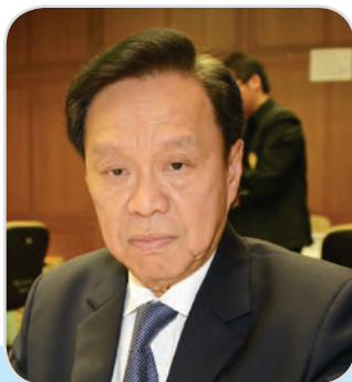
๘๖. พลตำรวจเอก พัชรวาท วงษ์สุวรรณ สมาชิกสภานิติบัญญัติแห่งชาติ