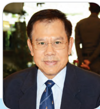
๓๙. พลเรือเอก ชูมนุม อัจวงษ์ สมาชิกสภานิติบัญญัติแห่งชาติ