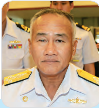
๑๕. พลเรือเอก ไกรสร จันทร์สุวานิชย์ สมาชิกสภานิติบัญญัติแห่งชาติ