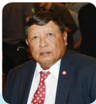
๓๘. พลอากาศเอก ชาลี จันทร์เรือง สมาชิกสภานิติบัญญัติแห่งชาติ