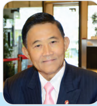
๔๓. พลอากาศเอก ณรงค์ศักดิ์ สังขพงศ์ สมาชิกสภานิติบัญญัติแห่งชาติ