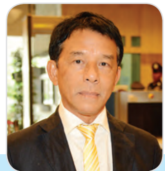
๕๖. พลเรือโท ธารธร ขจิตสุวรรณ สมาชิกสภานิติบัญญัติแห่งชาติ