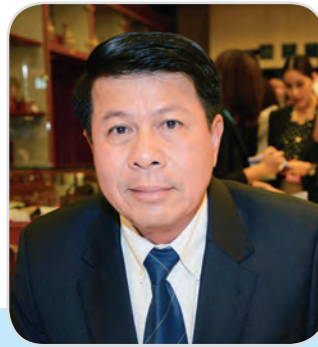
๓๕. พลโท ชาญชัย ภูทอง สมาชิกสภานิติบัญญัติแห่งชาติ