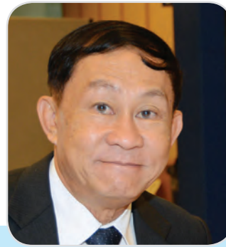
๑๙๑. พลอากาศเอก อานนท์ จารยะพันธุ์ สมาชิกสภาผู้แทนราษฎร