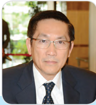
๓๐. พลเอก ชยุตี สุวรรณมาศ สมาชิกสภานิติบัญญัติแห่งชาติ