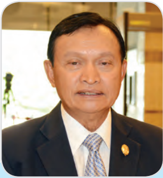
๙๓. พลเอก พิรุณ แผ้วพลสง สมาชิกสภาผู้แทนราษฎร