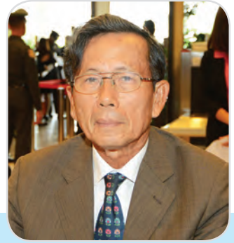
๗๖. พลเอก บุญสร้าง เนียมประดิษฐ์ สมาชิกสภานิติบัญญัติแห่งชาติ