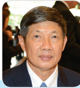
๑๒๗. พลเอก วิลาศ อรุณศรี สมาชิกสภานิติบัญญัติแห่งชาติ