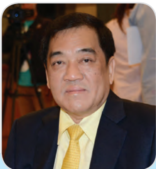
๘๕. นายพจน์ อร่ามวัฒนานนท์ สมาชิกสภานิติบัญญัติแห่งชาติ