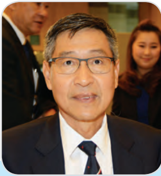
๔๕. พลอากาศเอก ตรีทศ สนแจ้ง สมาชิกสภานิติบัญญัติแห่งชาติ