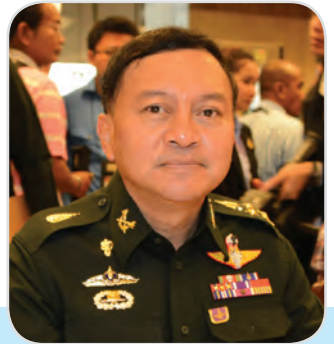
๖๘. พลเอก นิพัทธ์ ทองเล็ก สมาชิกสภานิติบัญญัติแห่งชาติ