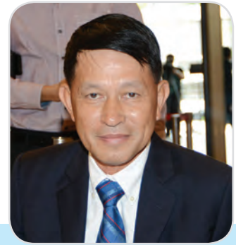
๔๘. พลอากาศโท ทวาร มณีพุกษ์ สมาชิกสภานิติบัญญัติแห่งชาติ