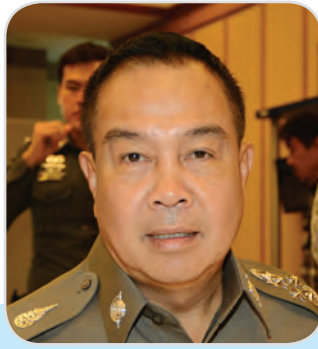
๑๕๔. พลตำรวจเอก สมยศ พุ่มพันธุ์ม่วง สมาชิกสภานิติบัญญัติแห่งชาติ