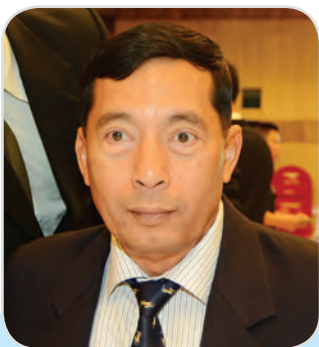
๑๘๑. พลอากาศเอก อดิศักดิ์ กลั่นเสนาะ สมาชิกสภานิติบัญญัติแห่งชาติ