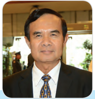
๖๔. พลเรือเอก นพดล โชคระดา สมาชิกสภานิติบัญญัติแห่งชาติ