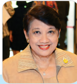
๕๑. คุณหญิงทรงสุดา ยอดมณี สมาชิกสภานิติบัญญัติแห่งชาติ