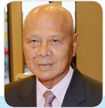
๑๙๖. พลเอก อู๊ด เบื้องบน สมาชิกสภาผู้แทนราษฎร