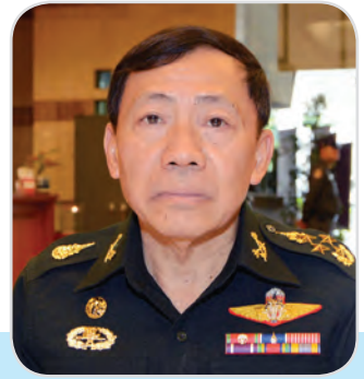
๑๗๒. พลเอก สุรวัช บุตรวงษ์ สมาชิกสภานิติบัญญัติแห่งชาติ