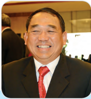
๒๙. พลอากาศเอก ชนัท รัตนอุบล สมาชิกสภานิติบัญญัติแห่งชาติ