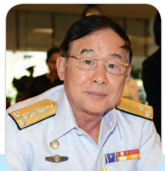
๔๐. พลเรือโท ชูมพล วงศ์เวคิน สมาชิกสภานิติบัญญัติแห่งชาติ