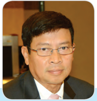
๑๕๖. พลเอก สมหมาย เกาฏีระ สมาชิกสภานิติบัญญัติแห่งชาติ