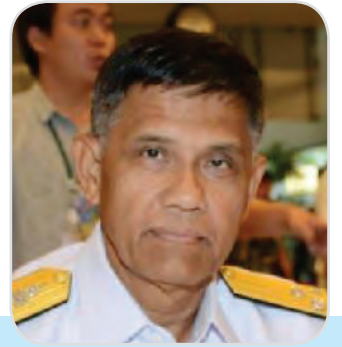
๑๒๘. พลเรือโท วีระพันธ์ สุขก้อน สมาชิกสภานิติบัญญัติแห่งชาติ