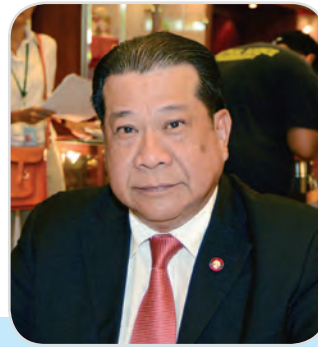
๔๗. พลเอก ไตรรัตน์ รังคะรัตน์ สมาชิกสภานิติบัญญัติแห่งชาติ