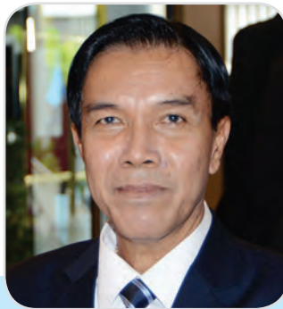
๑๓๐. พลโท วีรณ ฉันทศาสตร์โกศล สมาชิกสภานิติบัญญัติแห่งชาติ