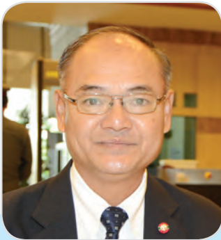
๑๖๑. พลเอก สิงห์ศึก สิงห์ไพร สมาชิกสภานิติบัญญัติแห่งชาติ