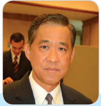
๑๑๖. พลเอก วรพงษ์ สง่าเนตร สมาชิกสภานิติบัญญัติแห่งชาติ