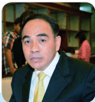
๖. พลโท กัมปนาท รุดดิษฐ์ สมาชิกสภานิติบัญญัติแห่งชาติ