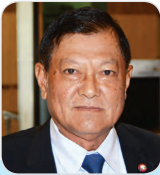
๑๘๙. พลอากาศเอก อาคม กาญจนหิรัญ สมาชิกสภาผู้แทนราษฎร