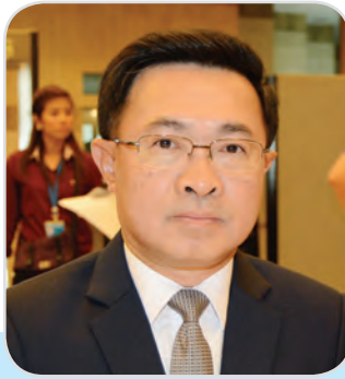
๑๗๑. พลเอก สุรพงษ์ สุวรรณอัตถ์ สมาชิกสภานิติบัญญัติแห่งชาติ