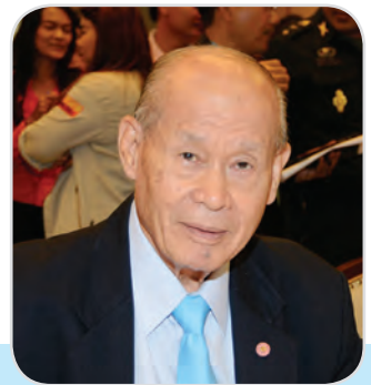
๒๐. พลตรี จาริก อารีราชการณย์ สมาชิกสภานิติบัญญัติแห่งชาติ