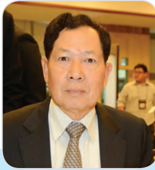
๗๕. พลอากาศเอก บุญฤทธิ์ เกิดสุข สมาชิกสภานิติบัญญัติแห่งชาติ