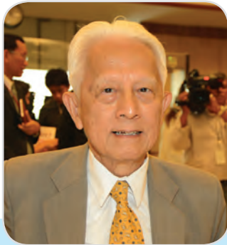
๖๕. นายบรรณิทธิ เศรษฐบุษบุตร สมาชิกสภานิติบัญญัติแห่งชาติ