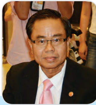
๔๖. นายตวง อันทะไชย สมาชิกสภานิติบัญญัติแห่งชาติ