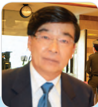
๑๘๒. พลโท อุดยเดช อินทะพงษ์ สมาชิกสภานิติบัญญัติแห่งชาติ