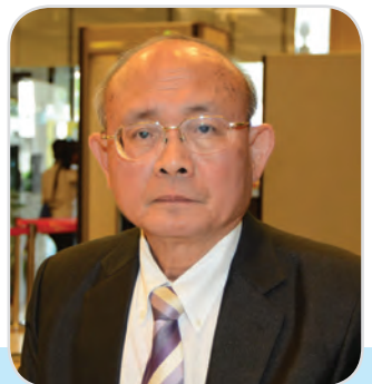
๗๒. นายนิเวศน์ นันทจิต สมาชิกสภานิติบัญญัติแห่งชาติ