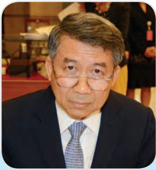
๙๗. พลอากาศเอก เพิ่มเกียรติ ลวณะมาลย์ สมาชิกสภาผู้แทนราษฎร