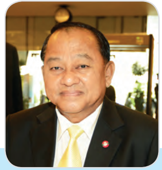
๑๒. พลเอก กิตติพงษ์ เกษโกวิท สมาชิกสภานิติบัญญัติแห่งชาติ