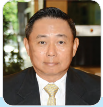
๑๑๒. พลเรือเอก ยุทธนา พิภพลงาม สมาชิกสภานิติบัญญัติแห่งชาติ