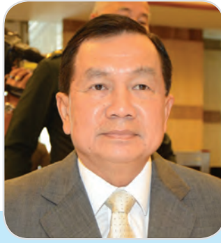
๑๒๒. พลเอก วิชัญ เทพหัสดิน ณ อยุธยา สมาชิกสภานิติบัญญัติแห่งชาติ