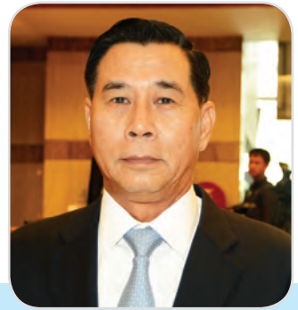
๑๖. พลเอก คณิต สาทัทักษ์ สมาชิกสภานิติบัญญัติแห่งชาติ