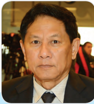
๑๗๙. พลเอก อภินิษฐ์ หมั่นสวัสดิ์ สมาชิกสภานิติบัญญัติแห่งชาติ