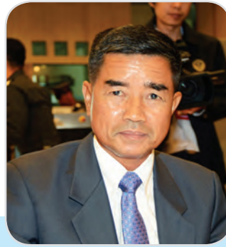
๒๗. พลโท เฉลิมชัย สิทธิสาท สมาชิกสภานิติบัญญัติแห่งชาติ