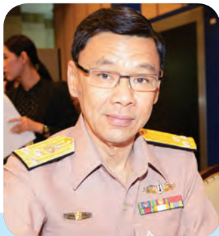
๒. พลเรือโท กฤษฎา เจริญพานิช สมาชิกสภานิติบัญญัติแห่งชาติ