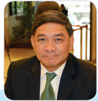
๕๒. พลเอก ทวีป เนตรนิยม สมาชิกสภานิติบัญญัติแห่งชาติ