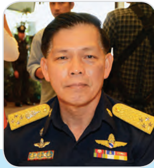
๕๐. พลอากาศเอก ทรงธรรม โชคคณาพิทักษ์ สมาชิกสภานิติบัญญัติแห่งชาติ