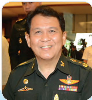
๗๐. พลโท นิวัตติ ศรีเพ็ญ สมาชิกสภานิติบัญญัติแห่งชาติ