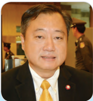
๑๔๙. นายสมชาย แสวงการ สมาชิกสภานิติบัญญัติแห่งชาติ