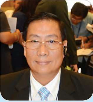
๑๐๙. พลเอก มารุต ปิ์ชโตะสิงห์ สมาชิกสภานิติบัญญัติแห่งชาติ