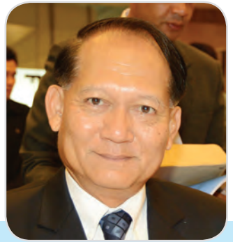
๑๖๐. พลอากาศเอก สฤษดิ์พงษ์ โกมุทานนท์ สมาชิกสภานิติบัญญัติแห่งชาติ