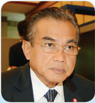
๑๗๓. พลเรือเอก สุรศักดิ์ หุ่นเรียงรมย์ สมาชิกสภานิติบัญญัติแห่งชาติ