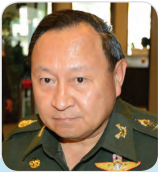
๑๔๑. พลโท ศุภกร สงวนชาติศรไกร สมาชิกสภานิติบัญญัติแห่งชาติ