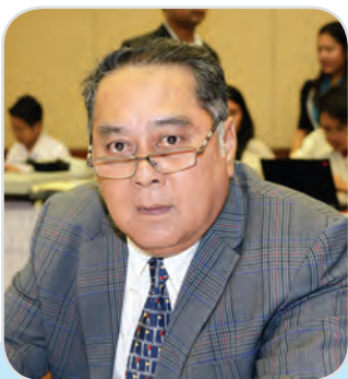
๒๑. พลเอก จีรพงศ์ วรณรัตน์ สมาชิกสภานิติบัญญัติแห่งชาติ