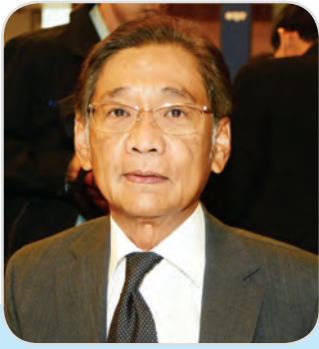
๙. นายกิตติ วะสีนนท์ สมาชิกสภานิติบัญญัติแห่งชาติ