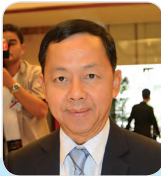
๑๑๘. พลตำรวจเอก วัชรพล ประสารราชกิจ สมาชิกสภานิติบัญญัติแห่งชาติ