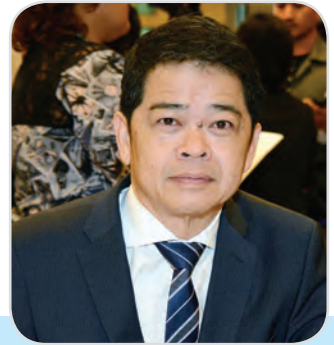
๘๐. นายประเสริฐ บุญสัมพันธ์ สมาชิกสภานิติบัญญัติแห่งชาติ