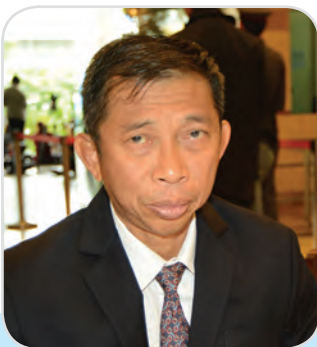
๕๓. พลเรือเอก ทวีวุฒิ พงศ์พิพัฒน์ สมาชิกสภานิติบัญญัติแห่งชาติ