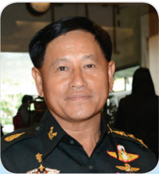
๑๑๗. พลโท วลิต โรจนักดิ์ สมาชิกสภานิติบัญญัติแห่งชาติ