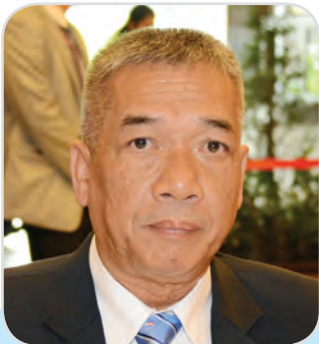
๑๔๕. พลเรือโท สนธยา น้อยฉายา สมาชิกสภานิติบัญญัติแห่งชาติ