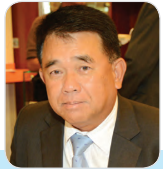
๑๘๐. พลเอก งามอาจ พงษ์ศักดิ์ สมาชิกสภานิติบัญญัติแห่งชาติ