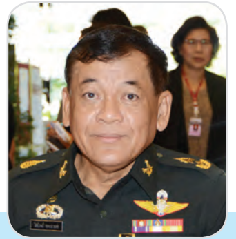
๑๐๐. พลตรี ไพโรจน์ ทองมาเอง สมาชิกสภาผู้แทนราษฎร