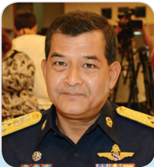
๑๖๕. พลอากาศเอก สุทธิพันธ์ กฤษณคุปต์ สมาชิกสภานิติบัญญัติแห่งชาติ