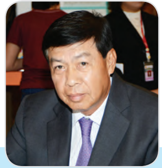
๒๘. พลอากาศเอก ชนะ อยู่สถาพร สมาชิกสภานิติบัญญัติแห่งชาติ