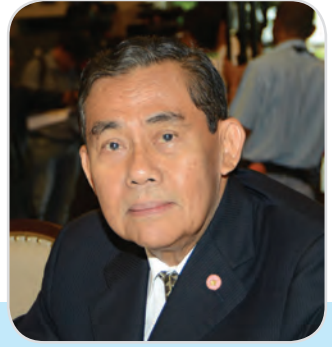
๑๐๘. นายมนุชญ์ วัฒนโกเมร สมาชิกสภานิติบัญญัติแห่งชาติ