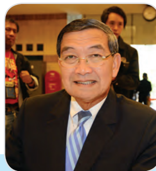
๕๕. พลอากาศเอก ธงชัย แฉล้มเขตร สมาชิกสภานิติบัญญัติแห่งชาติ