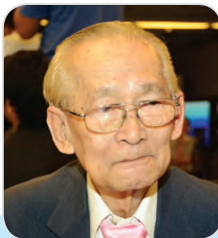
๑๕๑. นายสมพร เทพสิทธา สมาชิกสภานิติบัญญัติแห่งชาติ