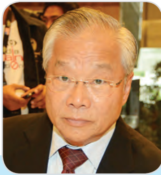
๑๗๘. พลเอก โสภณ ศิลพิพัฒน์ สมาชิกสภานิติบัญญัติแห่งชาติ