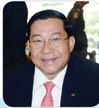
๓๑. พลตำรวจเอก ชัชวาล สุขสมจิตร สมาชิกสภานิติบัญญัติแห่งชาติ