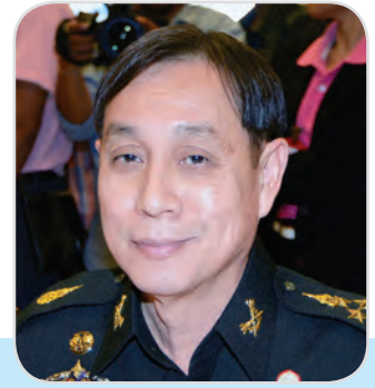
๑๘๘. พลเอก อักขรา เกิดผล สมาชิกสภาผู้แทนราษฎร