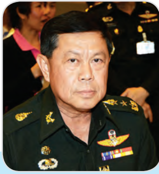
๑๐. พลโท กิตติ อินทสร สมาชิกสภานิติบัญญัติแห่งชาติ