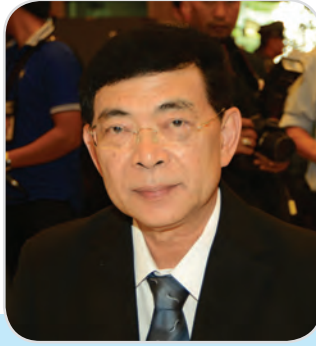
๑๑๑. นายยุทธนา ทัพเจริญ สมาชิกสภานิติบัญญัติแห่งชาติ