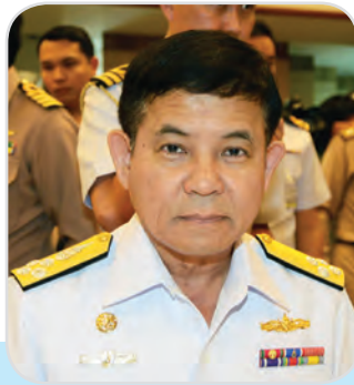
๓๔. พลเรือเอก ชัยวัฒน์ เอี่ยมสมุทร สมาชิกสภานิติบัญญัติแห่งชาติ