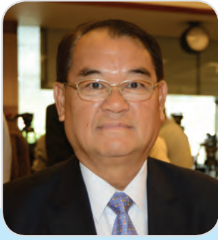
๑๒๑. พลเรือเอก วัลลภ เกิดผล สมาชิกสภานิติบัญญัติแห่งชาติ