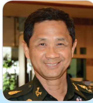
๑๒๓. พลเอก วิชิต ศรีประเสริฐ สมาชิกสภานิติบัญญัติแห่งชาติ