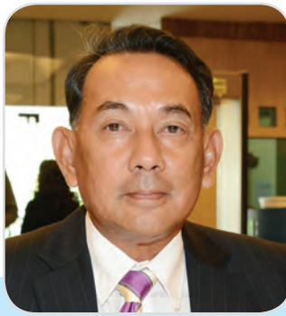
๑๓๙. พลอากาศเอก ทวีเกียรติ์ ขยเมฆ สมาชิกสภานิติบัญญัติแห่งชาติ