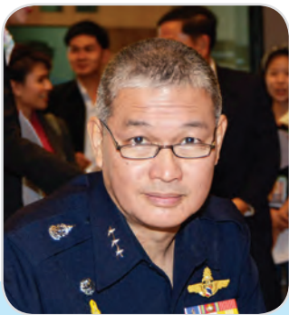
๑๗. พลอากาศโท จอม รุ่งสว่าง สมาชิกสภานิติบัญญัติแห่งชาติ