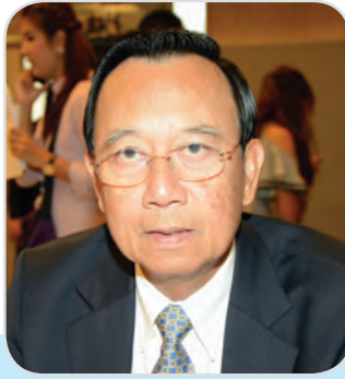
๑๑๕. พลเอก เลิศฤทธิ์ เวชสวรรค์ สมาชิกสภานิติบัญญัติแห่งชาติ