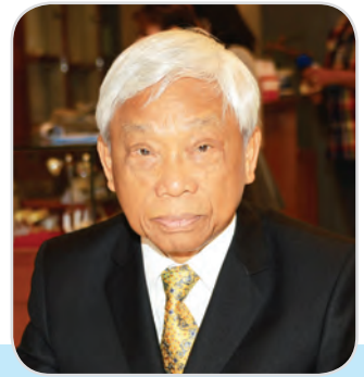
๓๒. นายชัชวาล อภิบาลศรี สมาชิกสภานิติบัญญัติแห่งชาติ