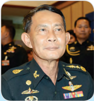
๘๑. พลโท ปรีชา จันทร์โอชา สมาชิกสภานิติบัญญัติแห่งชาติ