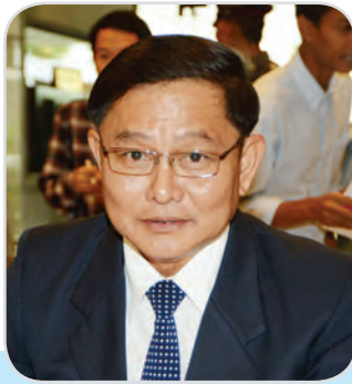
๑๔. พลตรี กุ้เกียรติ ศรีนาคา สมาชิกสภานิติบัญญัติแห่งชาติ