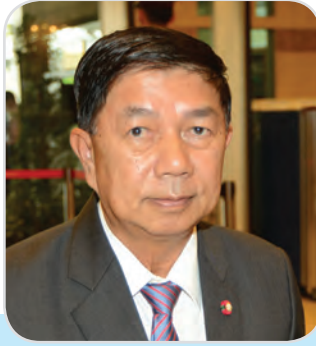
๑๑๐. พลเอก ยอดยุทธ บุญญาธิการ สมาชิกสภานิติบัญญัติแห่งชาติ