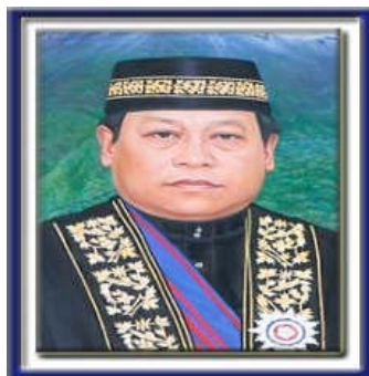
ประธานสภาผู้แทนราษฎรแห่งสหพันธรัฐมาเลเซีย

ประธานสภาผู้แทนราษฎรแห่งสหพันธรัฐมาเลเซียชุดที่ ๑๒ คนปัจจุบัน คือ ตานซรีดาตูก เซรี ปังลิมา ปันดิการ์ อามิน ฮัจญี มุลีอะห์ (YB Tan Sri Datuk Seri Panglima Pandikar Amin Haji Mulia) ดำรงตำแหน่งตั้งแต่ ๒๘ เมษายน พ.ศ. ๒๕๕๑ – ปัจจุบัน