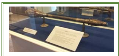
คทา พิธีการ ของ วุฒิสภา