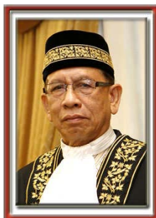
ประธานวุฒิสภาคนปัจจุบัน

บุคคลใดที่ต้องการเข้ารับตำแหน่งประธานวุฒิสภาต้องไม่เป็นสมาชิกของสภานิติบัญญัติแห่งรัฐใด ๆ