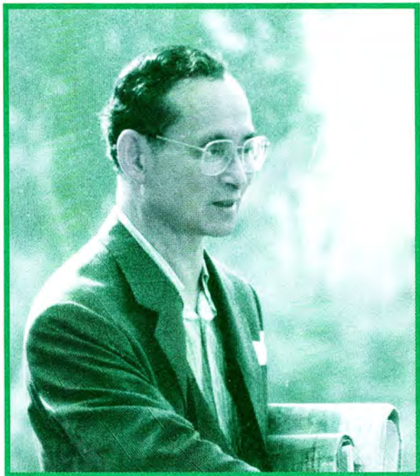
กฤษฎีใหม่