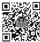
กระทู้ถามสด ด้วยวาจา