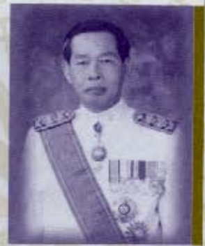
โดย จ่านงค์ ทองประเสริฐ ราชบัณฑิต