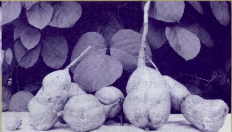
กวางเครือขาว

ชาวไร่ หน้าแดง ผีพรุนแปดปลั่ง และฉิม นั้น เป็นที่ปรารถนาของทั้งหญิงสาวและคยากล่าวหลายคน จะเห็นได้จากผลิตภัณฑ์และโฆษณาที่บรรยายสรรพคุณ ในลักษณะดังกล่าวผ่านสื่อต่างๆ ออกมาเป็นจำนวนมาก และแน่นอนว่ามีเม็ดเงินที่เกี่ยวข้องจำนวนมาก