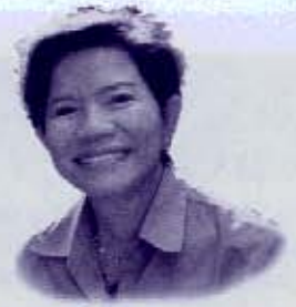
โดย ประทีป อึ้งทรงธรรม ฮาตะ สมาชิกวุฒิสภากรุงเทพมหานคร