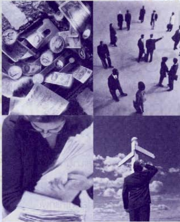
การรับประกันภัยชีวิตแบบคุ้มครองและชดใช้ (protection and indemnity risks) พวงนุกรม

ไม่ได้ให้คำอธิบายไว้ดังนี้ “กรมธรรม์ประกันชีวิตแบบคุ้มครองและชดใช้” พวงนุกรมได้ให้คำอธิบายไว้ว่า “ภัยเกี่ยวกับความคุ้มครองและชดใช้” และให้คำอธิบายไว้ดังนี้ “เนื่องจากมีภัยบางอย่างไม่สามารถทำประกันภัยในตลาดประกันภัยทางทะเลได้ เจ้าของเรือจึงร่วมกันจัดตั้งชมรมขึ้น เรียกว่า ชมรมทีแอนด์ไอ เพื่อให้ความคุ้มครองแก่พวกตน ภัยเกี่ยวกับความคุ้มครองได้แก่ ค่าใช้จ่ายจากการถูกกัก ความรับผิดชอบต่อลูกเรือ และความเสียหายจากการที่เรือชนกันหรือกระแทก ความรับผิดชอบต่อเรือลำอื่นในกรณีที่ชนกันหรือจากการชน เป็นต้น ส่วนภัยเกี่ยวกับการชดใช้เงิน รวมถึงความรับผิดของเจ้าของเรือจากความสูญเสียหรือเสียหายของสินค้า ค่าปรับจากการเข้าเมืองโดยพลั้งเผลอหรือจากความผิดเกี่ยวกับภาษีศุลกากร เป็นต้น”