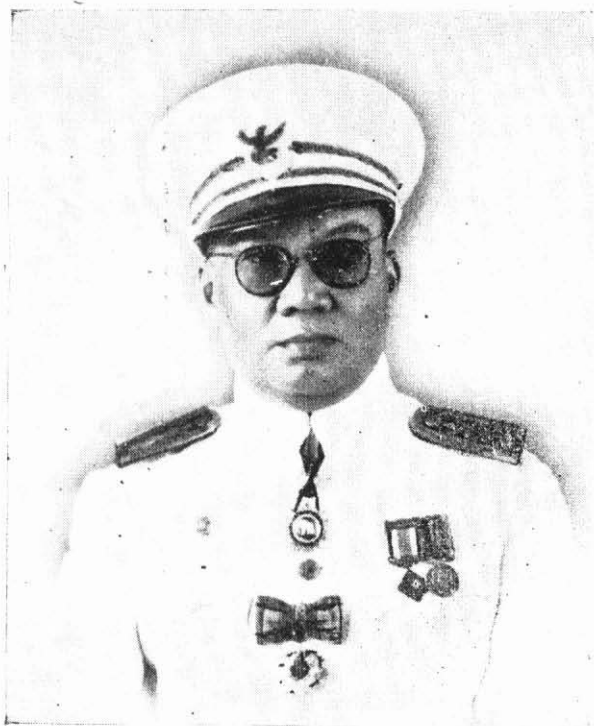
ชาติะ ๒๓ พฤศจิกายน ๒๔๔๓ มตะ ๑๑ พฤศจิกายน ๒๕๐๑