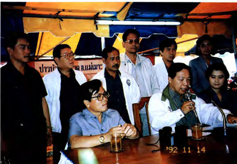
วันที่ ๑๕ - ๑๖ พฤศจิกายน ๒๕๓๕ คณะกรรมการสิ่งแวดล้อมเดินทาง ไปศึกษาปัญหาโรงไฟฟ้าแม่เมาะ จังหวัดลำปาง ปล่อยคว้นพิษที่เป็น อันตรายต่อสุขภาพประชาชน