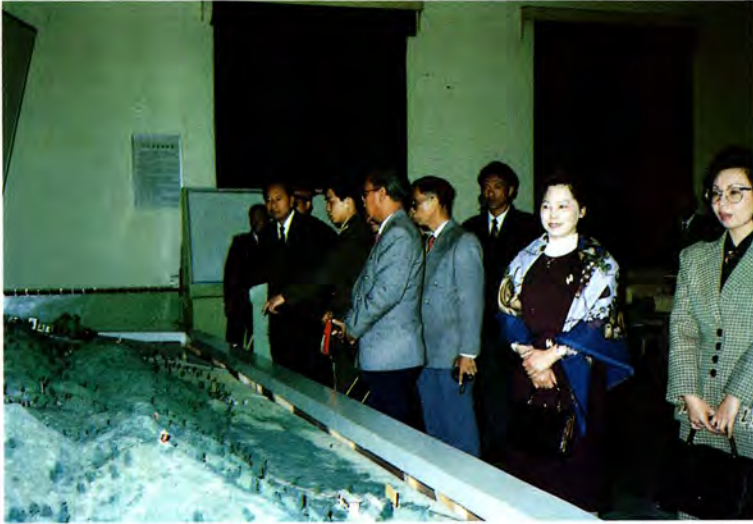
วันที่ ๘-๒๐ เมษายน ๒๕๓๖ คณะกรรมการการทหารเดินทางไป ศึกษาดูงาน ณ สาธารณรัฐประชาธิปไตยประชาชนจีน (ในภาพไปดูงานที่โรงเรียนนายร้อยกู่ย๋- หลิน อยู่ในเขตปกครองกว่างซี)