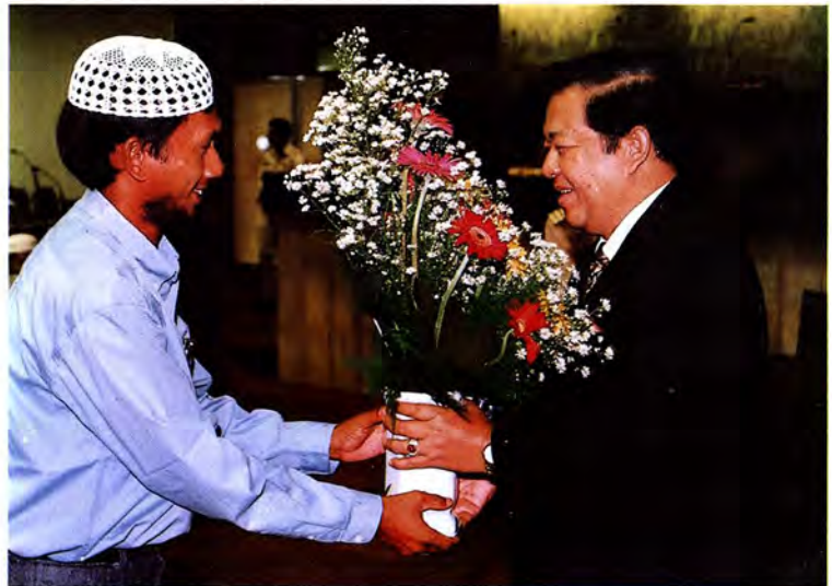
วันที่ ๒๔ เมษายน ๒๕๓๖ นายวันมูหะมัดนอร์ มะทา รองประธานสภา ผู้แทนราษฎร คนที่ ๑ ให้การรับรองคณะ ผู้แทนผู้นำศาสนาอิสลาม ในโอกาสเข้าเยี่ยม คารวะ ณ ห้องประชุมรัฐสภา