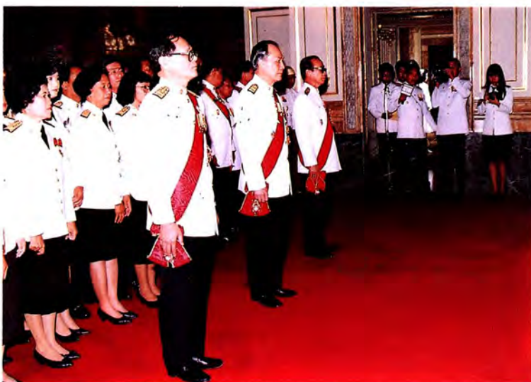
วันที่ ๒๑ กันยายน ๒๕๖๕ พระบาทสมเด็จพระเจ้าอยู่หัว ทรงทำรัฐพิธีเปิด ประชุมสมัยประชุมสามัญประจำปีครั้งแรก ณ พระที่นั่งอนันตสมาคม