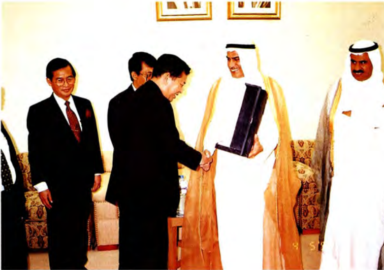
นายวันมูหะมัดนอร์ มะทา รองประธานสภาผู้แทนราษฎร คนที่ ๑ เข้าเยี่ยมคารวะ ABDELLAZIZ AL SAADOUN ประธานรัฐสภาคูเวต