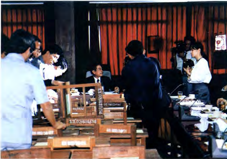
วันที่ ๒๔ ธันวาคม ๒๕๓๕ คณะกรรมการการศึกษาไปตรวจสอบ เรื่องการทุจริตในการจัดซื้อวัสดุครุภัณฑ์ ของคณะกรรมการการประถมศึกษา- แห่งชาติที่กระทรวงศึกษาธิการ

๒๓. รายงานของคณะกรรมการพิจารณา เปิดเผยแพร่รายงานการประชุมลับ และตรวจรายงาน การประชุมพิจารณาตรวจรายงานการประชุมไปแล้ว ๒๒ ครั้ง