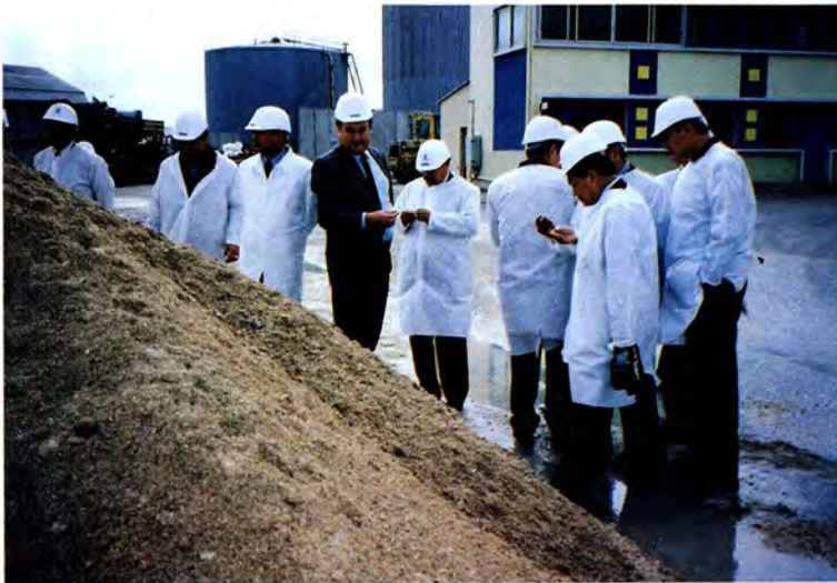
วันที่ ๒๔ เมษายน ๒๕๓๖ คณะกรรมการการเกษตรและสหกรณ์ ศึกษาดูงานโรงงานปุ๋ย TIMAC ที่เมืองแฌ็งมาโด ประเทศฝรั่งเศส