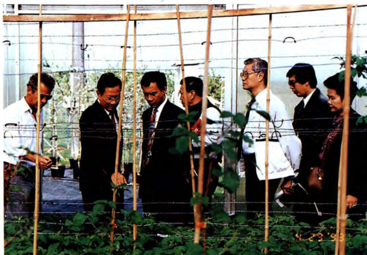
วันที่ ๒๙ เมษายน ๒๕๓๖ คณะกรรมการการเกษตรและสหกรณ์ ดูงานการพัฒนาพันธุ์พืชที่สถาบันวิจัย พืชผักผลไม้ที่เมือง กูนิเกิล ประเทศ สวิต- เซอร์แลนด์