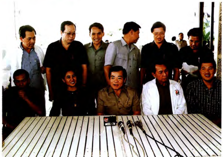
วันที่ ๓๑ มกราคม ๒๕๓๖ คณะอนุกรรมการวิสามัญพิจารณาร่างพระราชบัญญัติงบประมาณรายจ่ายประจำปีงบประมาณ พ.ศ. ๒๕๓๖ ไปศึกษาสภาพข้อเท็จจริงการก่อสร้างทางชนบทที่จังหวัดนนทบุรี