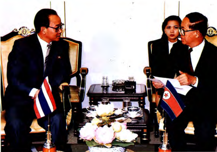
นายลี โต ซอป เอกอัครราชทูต สาธารณรัฐประชาธิปไตยประชาชนเกาหลี เข้าเยี่ยมคารวะนายมารุต มุนนาค ประ- ธานสภาผู้แทนราษฎรและประธานรัฐสภา