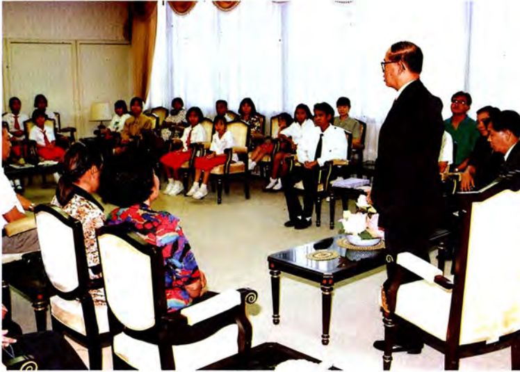
วันที่ ๑๖ เมษายน ๒๕๓๖ นายมาจูด บุนนาค ประธานรัฐสภาให้การ รับรองคณะครูและนักเรียนจากโรงเรียนสตรี ศรีน่าน ณ ห้องรับรองหมายเลข ๑ สำนักงาน เลขาธิการสภาผู้แทนราษฎร