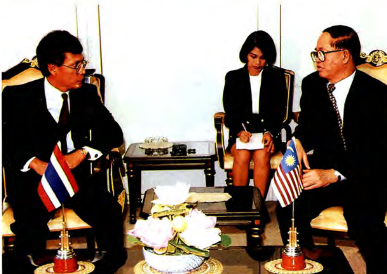
ดาโต๊ะ ไชนัล อะบิติน บิน ฮาลิซัด เอกอัครราชทูตมาเลเซียประจำประเทศไทย เข้าเยี่ยมคารวะนายมารุต มุนนาค ประ- ธานสภาผู้แทนราษฎรและประธานรัฐสภา