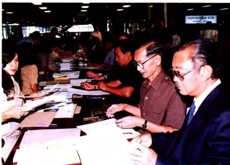
สมาชิกสภาผู้แทนราษฎรที่ได้รับการเลือกตั้ง เมื่อวันที่ ๑๓ กันยายน ๒๕๖๕ มาแสดงตน ณ สำนักงานเลขาธิการสภาผู้แทนราษฎร