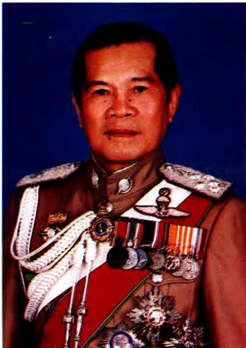
พลตำรวจเอก ประมาณ อธิเรกสาร ผู้นำฝ่ายค้านในสภาผู้แทนราษฎร