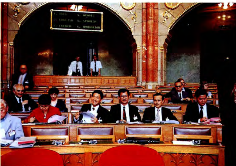
นายชุมพล ศิลปอาชา สมาชิกสภาผู้แทนราษฎร เป็นหัวหน้าคณะผู้แทน ฯ เข้าร่วมการประชุมถกแถลงของสหภาพรัฐสภาเรื่อง - รัฐสภา-ผู้พิทักษ์สิทธิมนุษยชน - ณ กรุงบูดาเปสต์ สาธารณรัฐฮังการี