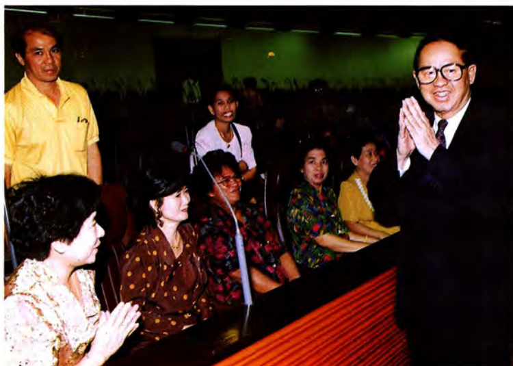
วันที่ ๓ กุมภาพันธ์ ๒๕๓๖ เวลา ๑๐.๐๐ น. นายมารุต บุญนาค ประธานรัฐสภา ได้ให้การต้อนรับคณะตัวแทนจากทุกสาขาอาชีพจากจังหวัดพังงา จำนวน ๒๕๐ คน ณ ห้องประชุมรัฐสภา