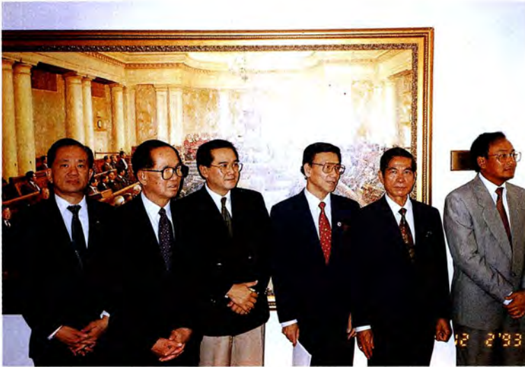
นาย Abdullah Tarmugi รองประธานรัฐสภาสิงคโปร์นำคณะผู้แทนรัฐสภาไทยเยี่ยมชมรัฐสภาสิงคโปร์