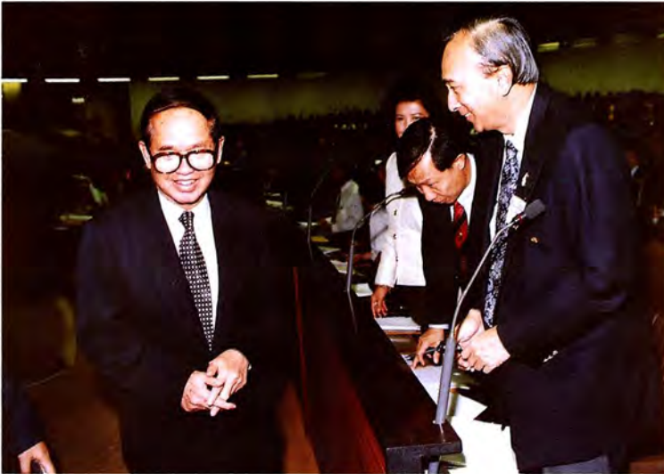
วันที่ ๒๑ มกราคม ๒๕๓๖ เวลา ๘.๓๐ น. นายมารุต บุญนาค ประธานรัฐสภา เป็นประธานในพิธีเปิดการสัมมนาเรื่อง - ทิศทางการบริหารกระบวนการยุติธรรม - ณ ห้องประชุมรัฐสภา