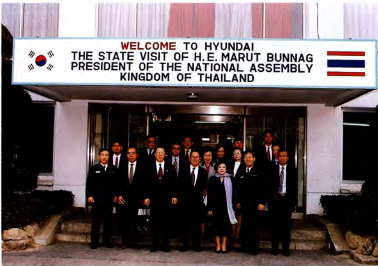
นายมารุต นูนาค ประธานสภาผู้แทนราษฎรและประธานรัฐสภา พร้อมด้วยคณะฯ เยี่ยมชมโรงงานประกอบรถยนต์ ฮุนไดที่เมืองอูลซัน ระหว่างการเยือนสาธารณรัฐเกาหลี