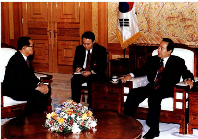
นายมารุต นูนาค ประธานสภาผู้แทนราษฎรและประธานรัฐสภา เข้าเยี่ยมคารวะนาย Kim Young-sam ประธานาธิบดีสาธารณรัฐเกาหลี