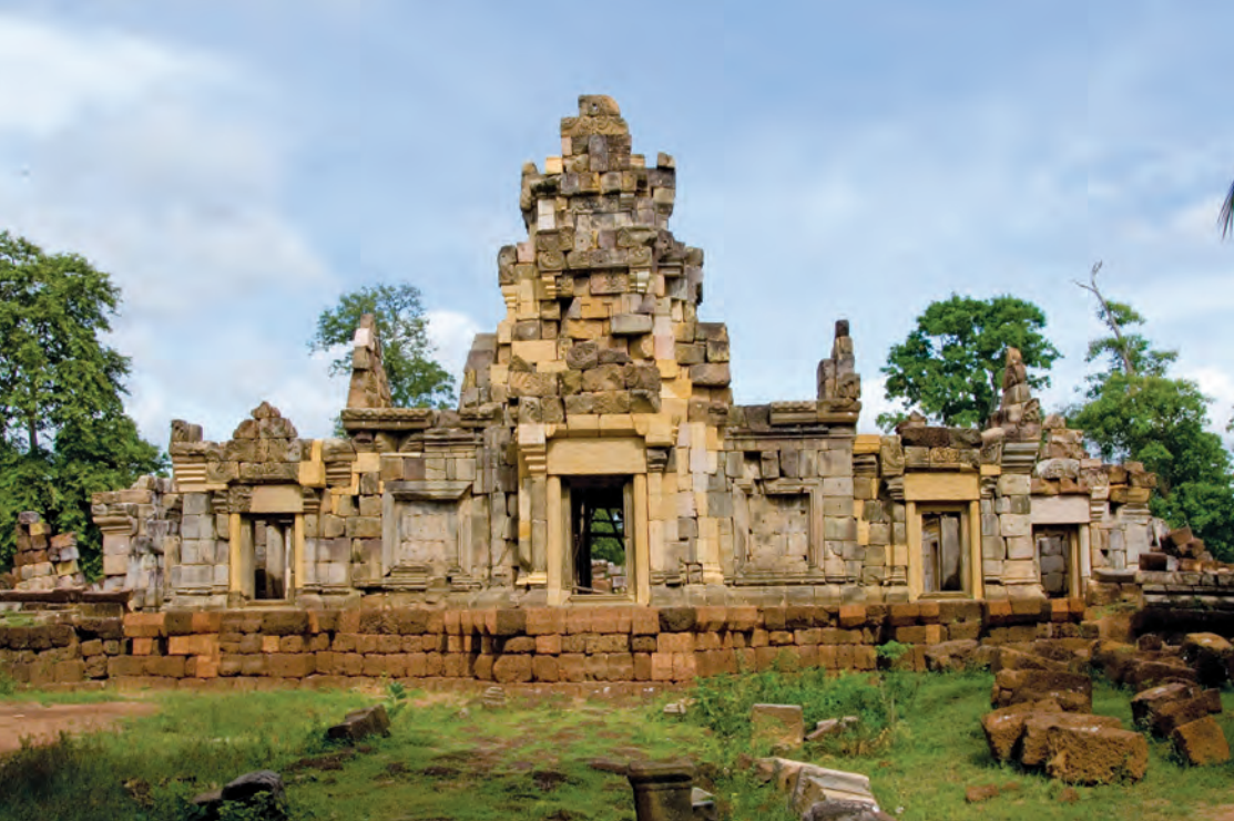
ปราสาทสติก๊กอกกรม

สระแก้ว สันนิษฐานว่าสร้างขึ้นในพุทธศตวรรษที่ ๑๔ เพื่อใช้ประดิษฐานรูปเคารพและใช้ประกอบพิธีกรรมตามคติความเชื่อถือในลัทธิศาสนาฮินดู โบราณสถานประกอบด้วยองค์ปราสาท ๓ หลัง หันหน้าไปทางทิศตะวันออก มีคูน้ำล้อมรอบ ๔ ด้าน มีกำแพงแก้ว ๒ ชั้น ชั้นนอกทำด้วยศิลาแลง ชั้นในทำด้วยหินทราย ตัวปราสาทก่อสร้างด้วยหินทรายมีโคปุระหรือซุ้มประตูเหลืออยู่เพียงด้านทิศตะวันออกและทิศตะวันตกเท่านั้น ภายในระเบียงคดมีบรรณาลัยก่อด้วยหินทราย ๒ หลัง อยู่หน้าปราสาทหลังกลาง ซึ่งเป็นปราสาทประธาน ปราสาทด้านซ้ายมือ และปราสาทองค์ประธานอยู่ในสภาพปรักหักพัง ตามจารึกกล่าวว่าประดิษฐานศิวลึงค์ ด้านนอกปราสาททางทิศตะวันออกมีสระน้ำขนาดใหญ่รูปสี่เหลี่ยม มีถนนปูด้วยหินจากตัวปราสาทไปจนถึงสระน้ำตลอดแนว ได้มีการค้นพบศิลาจารึก ๒ หลัก จารึกด้วย