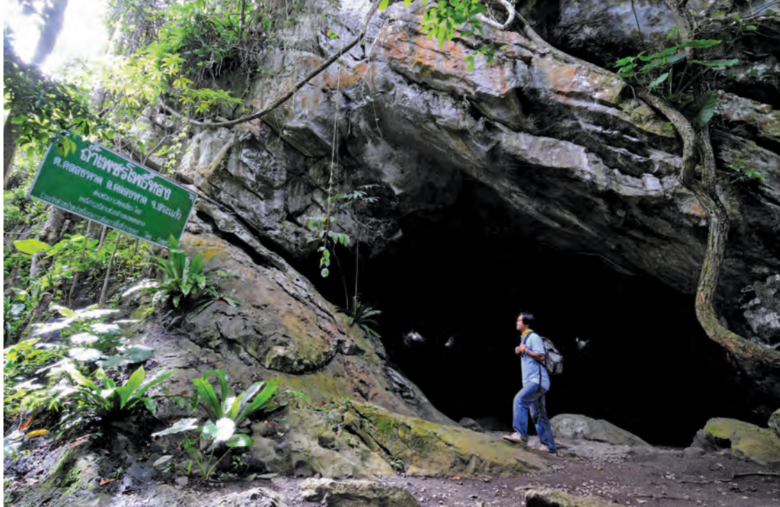
ถ้ำเพชรโพธิ์ทอง

ห้องมุขประดับเพชรจะเป็นห้องขนาดใหญ่และเป็นส่วนที่สำคัญซึ่งเป็นที่มาของชื่อถ้ำ มีหินงอกหินย้อยเป็นมุขทรงเจดีย์หรือทรงรูปไข่สีขาว มีเกล็ดทรายระยิบระยับตลอดทั้งผนังของถ้ำ และพื้นผิวของเพดานถ้ำมีรูปคล้าย ๆ ไปโพธิ์สีทอง ซึ่งเกิดจากน้ำซังในแอ่งหินด้านบนภูเขาจนเกิดสนิมน้ำทะลุผ่านลงมาจนเป็นรูปคล้ายไปโพธิ์ และส่วนที่ ๔ จะมีลักษณะเป็นประตูลักษณะปราสาทถ้ำเพชรโพธิ์ทองที่เป็นพื้นต่างระดับมีหินที่ปากประตูสีขาวนวล มีหินงอกรูปร่างคล้ายพระพุทธรูปจนกล่าวกันว่าเป็นห้องพระ มีบันไดที่ขึ้นไปชมด้านบนได้สะดวก สอบถามข้อมูลได้ที่เทศบาลตำบลคลองหาด โทร. ๐ ๓๗๔๔ ๕๑๐๙, ๐๙ ๒๗๕๓ ๔๔๘๕