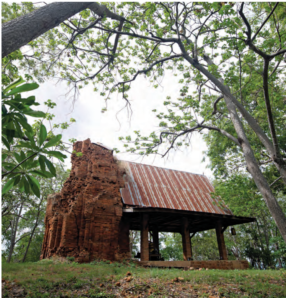
ปราสาทเขาน้อยสิขมพู

บูรณะปฏิสังขรณ์ในพุทธศตวรรษที่ ๑๕ เป็นศาสนสถานในศาสนาฮินดู ประกอบด้วย ปรางค์ ๓ หลัง ได้แก่ ปรางค์ทิศเหนือ ปรางค์องค์กลาง และปรางค์ทิศใต้ แต่คงเหลือเพียงปรางค์องค์กลางเท่านั้นที่ยังคงสภาพค่อนข้างสมบูรณ์ ต่อมาเมื่อ พ.ศ. ๒๔๗๘ ปราสาทเขาน้อยได้ขึ้นทะเบียนเป็นโบราณสถาน