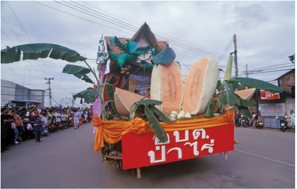
งานวันแคนตาลูป และของดีเมืองอรัญ

ข้อมูลได้ที่ศูนย์ปศุชาติ เฝ้าโยธิน โทร. ๐๘ ๑๕๗๑ ๘๓๓๑, ๐๙ ๑๘๒๘ ๒๔๕๕