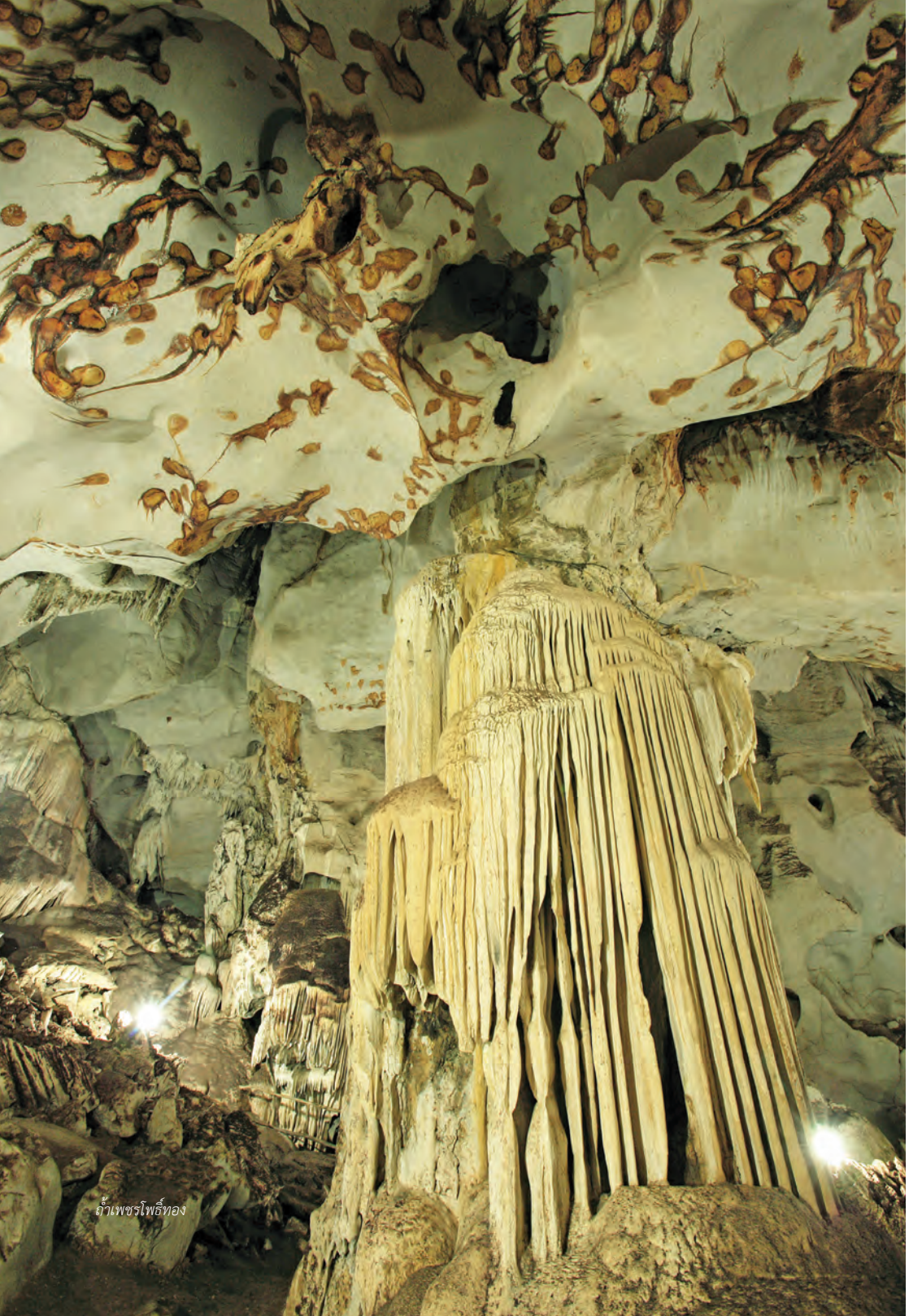
ถ้ำเพชรโพธิ์ทอง