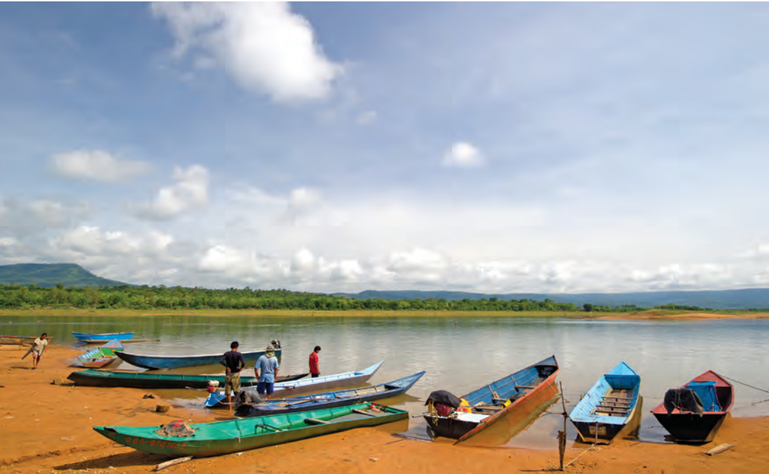
อ่างเก็บน้ำพระปรัง

อ่างเก็บน้ำพระปรัง อยู่หมู่ที่ ๓ บ้านระเบาหูกวาง และหมู่ที่ ๖ บ้านห้วยชัน ตำบลช่องกุ่ม เป็นอ่างเก็บน้ำเพื่อการชลประทานขนาดใหญ่ที่สุดในจังหวัด