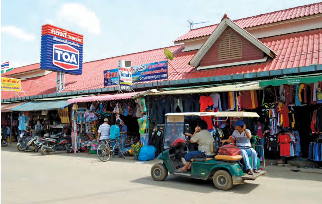
ตลาดโรงเกลือ

การเดินทาง มีรถสองแถวจากอำเภอรัฐประเทไปตลาดโรงเกลือทุกวัน และจากกรุงเทพมหานครมีรถโดยสารประจำทางออกจากสถานีขนส่งผู้โดยสารกรุงเทพฯ (จตุจักร) ถนนกำแพงเพชร ๒ สายกรุงเทพฯ-รัฐประเท ทุกวัน สอบถามข้อมูล โทร. ๐๔๙๐ และที่แอร์รัฐพัฒนา โทร. ๐ ๒๕๑๒ ๓๗๕๕, ๐๘ ๙๙๖๙ ๒๑๕๖