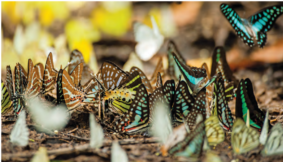
กิจกรรมดูผีเสื้อ

จำนวน ๒ จุด จุดที่หนึ่ง บริเวณหลังศูนย์บริการนักท่องเที่ยว และจุดที่สอง บริเวณหน่วยพิทักษ์อุทยานฯ ปด. ๕ (ห้วยน้ำเย็น) ค่าเช่าเต็นท์ ๓๐๐ บาท/คืน พักได้ ๓ คน (พร้อมอุปกรณ์) สอบถามข้อมูลได้ที่อุทยานแห่งชาติปางสีดา โทร. ๐๘ ๑๘๖๒ ๑๕๑๑ หรือที่สำนักอุทยานแห่งชาติ กรมอุทยานแห่งชาติสัตว์ป่า และพันธุ์พืช บางเขน กรุงเทพฯ โทร. ๐ ๒๕๖๒ ๐๗๖๐, www.dnp.go.th และทางอีเมล supatrajj@hotmail.co.th อัตราค่าเข้าอุทยานฯ นักท่องเที่ยวชาวไทย ผู้ใหญ่ ๔๐ บาท เด็ก ๒๐ บาท ชาวต่างชาติ ผู้ใหญ่ ๒๐๐ บาท เด็ก ๑๐๐ บาท การเดินทาง สามารถใช้เส้นทางได้หลายเส้นทางดังนี้ รถยนต์ จากอำเภอเมืองสระแก้วใช้ทางหลวงหมายเลข ๓๔๖๒ ไปทางทิศเหนือระยะทาง ๒๗ กิโลเมตร อุทยานฯ อยู่ทางขวามือ