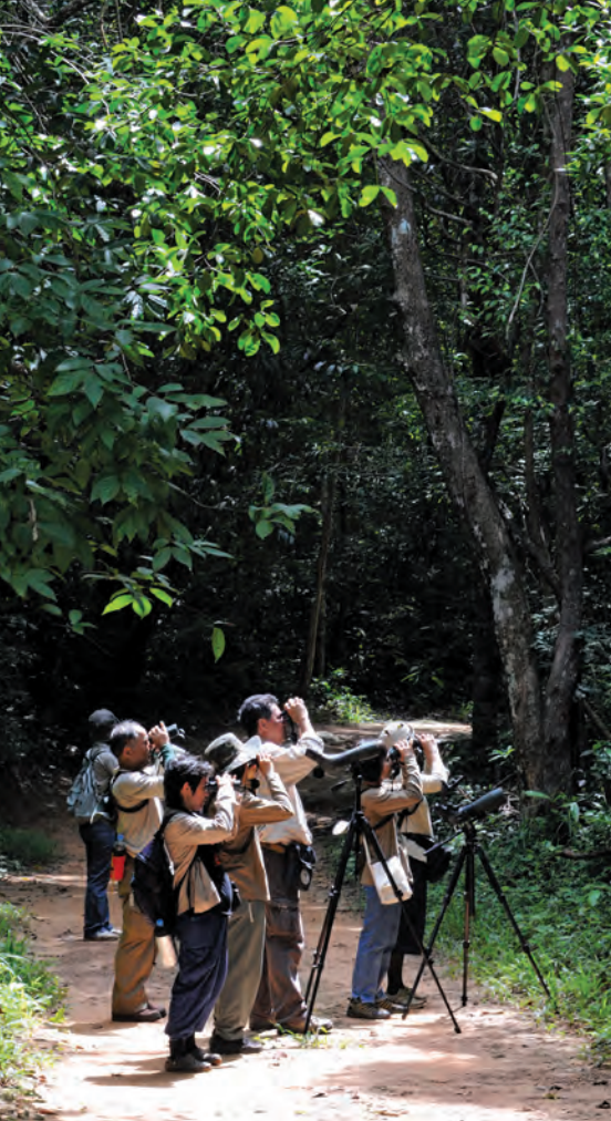
กิจกรรมดูนก

กลุ่มน้ำตกแควมะค่า จากที่ทำการอุทยานฯ ถึงหลักกิโลเมตรที่ ๒๕ ให้เดินเท้าต่ออีก ๑๕ กิโลเมตร จะถึงน้ำตก เป็นน้ำตกใหญ่ที่สุด สายน้ำตกไหลจากหน้าผาสูง ๗๐ เมตร เหมาะสำหรับเดินป่าและกางเต็นท์ ใกล้เคียงมี น้ำตกกรากไทรย้อย ห่างจากน้ำตกแควมะค่า ๕๐๐ เมตร น้ำตกลานหินใหญ่ ห่างจากน้ำตกแควมะค่า ๑.๕ กิโลเมตร น้ำตกสวนมันสวนทอง ห่างจากน้ำตกแควมะค่า ๓ กิโลเมตร และน้ำตกม่านธารา ห่างจากน้ำตกแควมะค่า ๔ กิโลเมตร กลุ่มน้ำตกแห่งนี้ใช้ระยะเวลาในการเดินทาง ๓ วัน