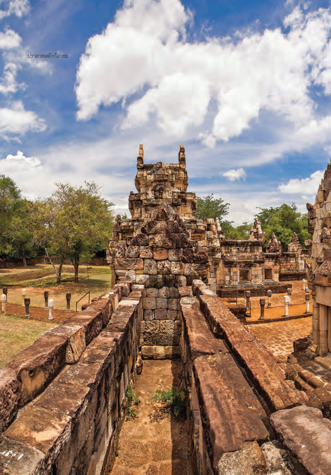
ปราสาทสด๊กก๊อกธม