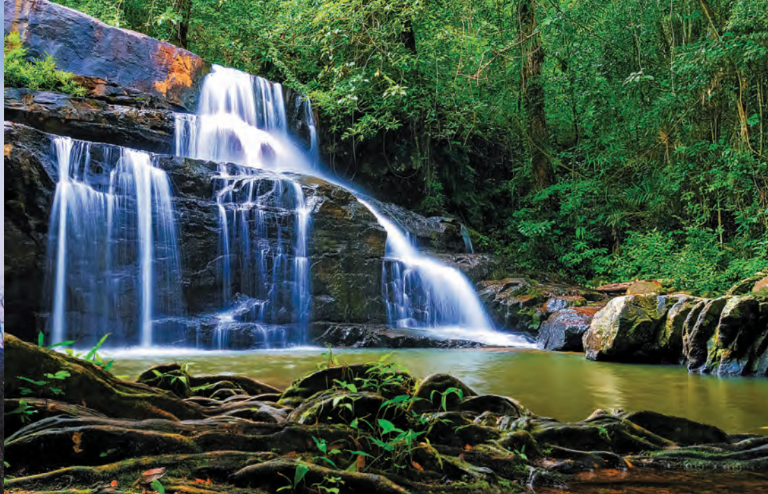
น้ำตกปางสีดา