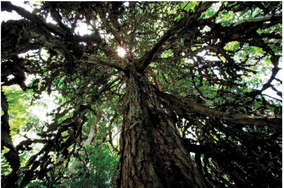
อุทยานแห่งชาติตาพระยา