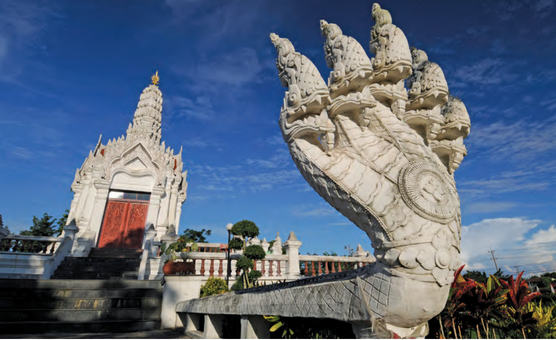
ศาลหลักเมือง

๑. เส้นทางหลวงหมายเลข ๑ (ถนนพหลโยธิน) ไปถึงบริเวณตลาดรังสิต แล้วชิดซ้าย โดยใช้สะพานวงแหวนข้ามไปต่อเข้าถนนเลียบคลองรังสิต-รังสิต ทางหลวงหมายเลข ๓๐๕ ผ่านอำเภอองครักษ์ จังหวัดนครนายก เข้าไปทางหลวงหมายเลข ๓๓ ผ่านอำเภอกบินทร์บุรี จังหวัดปราจีนบุรี ไปจนถึงจังหวัดสระแก้ว ระยะทาง ๒๑๔ กิโลเมตร