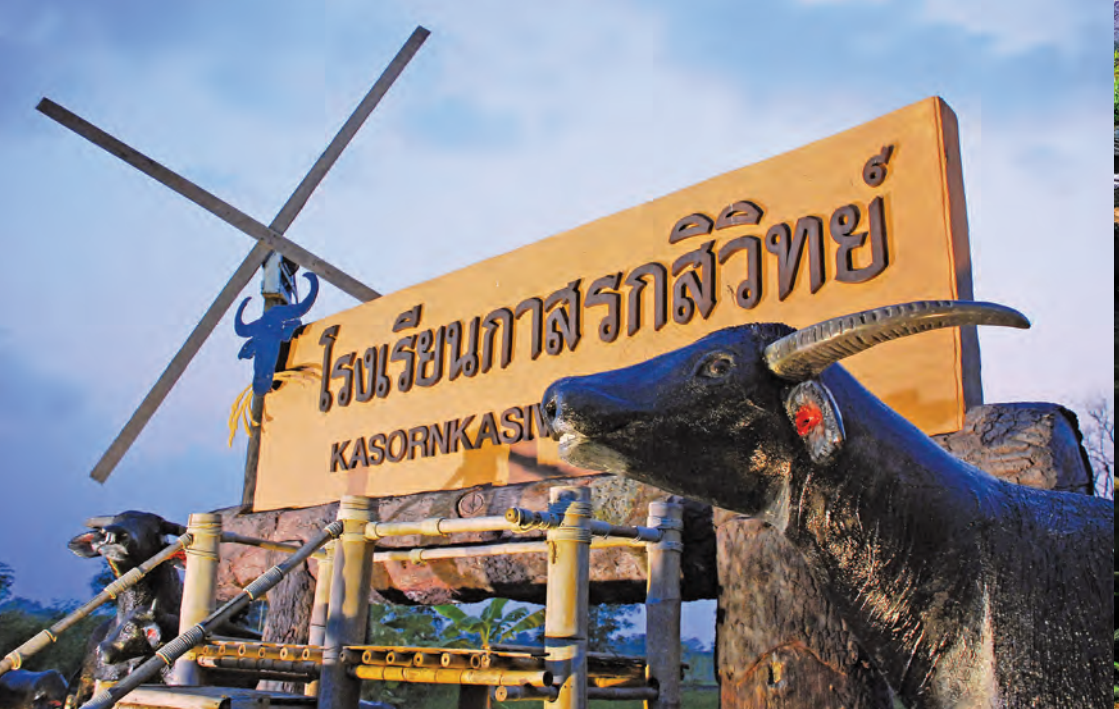
โรงเรียนกาสรกสิวิทย์

โรงเรียนกาสรกสิวิทย์ อยู่ถนนสุวรรณศร ตำบลลาลาลำดวน เป็นโรงเรียนที่สมเด็จพระเทพรัตนราชสุดาฯ สยามบรมราชกุมารี ทรงโปรดเกล้าฯ ให้มูลนิธิชัยพัฒนาจัดตั้งขึ้นเป็นโรงเรียนฝึกกระบือเพื่อช่วยในการทำเกษตรกรรมแบบดั้งเดิม แบ่งกิจกรรมออกเป็น ๗ ส่วน ประกอบด้วย การอบรมเกษตรกร และการฝึกกระบือ การจัดการนทรศการเครื่องมือการทำนาแปลงนาหญ้าอาหารสัตว์ บ้านพักนักปราชญ์ท้องถิ่น สระมะร่มล้อมรัก ต้นไม้ในโรงเรียนกาสรกสิวิทย์ และร้านกาแฟควายคะนอง สุดท้ายบ้านดินเป็นที่พักสำหรับผู้เข้ารับการอบรมและเป็นต้นแบบที่อยู่อาศัยจริง พร้อมจัดทำเป็นร้านอาหารแช่บ้านดิน (เป็นอาหารอีสาน) สำหรับบริการนักท่องเที่ยวและผู้เข้ารับการอบรม สอบถามข้อมูล โทร. ๐ ๓๗๒๔ ๔๖๑๕, ๐ ๓๗๒๔ ๔๖๕๗, ๐๘ ๘๒๘๘๙ ๑๒๙๙ (มีบริการห้องสุขาและทางลาดสำหรับผู้พิการ)