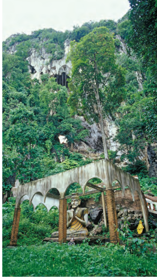
วัดถ้ำเขาฉกรรจ์

วัดถ้ำเขาฉกรรจ์ เป็นวัดในพระพุทธศาสนานิกายมหายาน ภายในวัดประกอบด้วย พระอุโบสถ สร้างขึ้นเมื่อ พ.ศ. ๒๕๓๓ เป็นอาคารคอนกรีตเสริมเหล็ก กุฏิสงฆ์เป็นอาคารครึ่งตึกครึ่งไม้มีบันไดขึ้นไปถึง