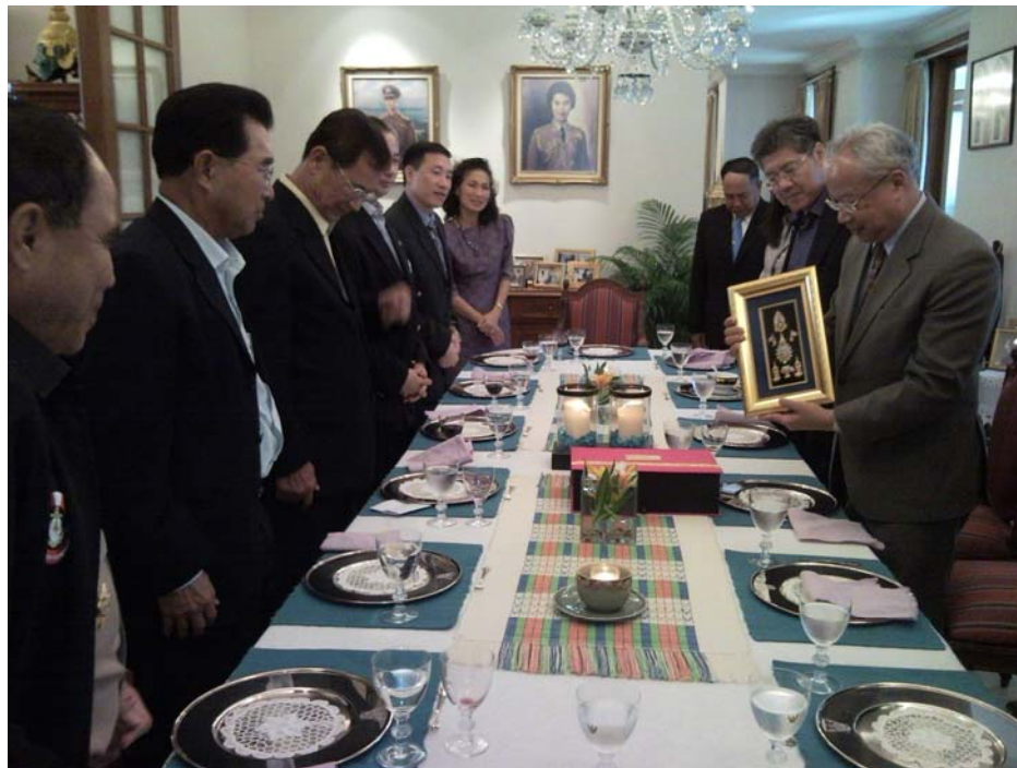
คณะผู้แทนรัฐสภาไทยมอบของที่ระลึกแก่ ร้อยโท อัครสิทธิ์ อมาตยกุล เอกอัครราชทูตฯ เพื่อขอบคุณในโอกาสที่ให้การรับรองและดูแลคณะฯ ตลอดระยะเวลาพำนัก ณ กรุงจาการ์ตา (๒๗ พฤศจิกายน ๒๕๕๑)