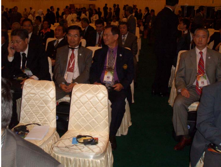
คณะผู้แทนรัฐสภาไทยเข้าร่วมพิธีเปิดการประชุมสมัชชาใหญ่ APA ครั้งที่ ๓ (๒๗ พฤศจิกายน ๒๕๕๑)