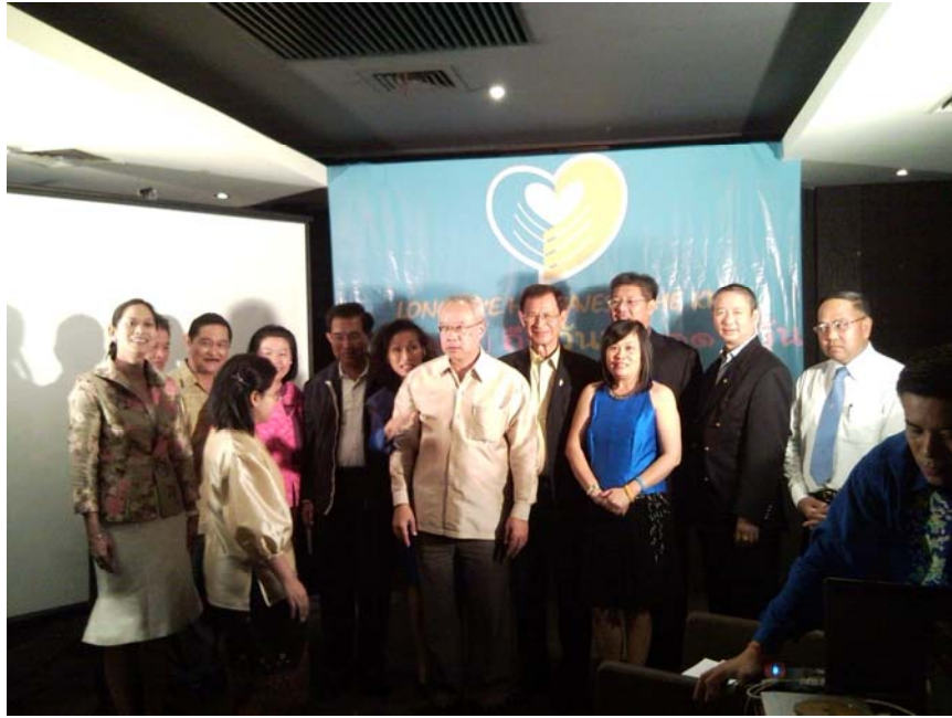
คณะผู้แทนรัฐสภาไทยถ่ายภาพร่วมกับ ร้อยโท อัครสิทธิ์ อมาตยกุล เอกอัครราชทูต ณ กรุงจาการ์ตา และนางสาวสุภาวดี แยมกมล อัครราชทูตที่ปรึกษา (ฝ่ายการพาณิชย์) ในงานจากวันแม่ถึงวันพ่อ ๑๑๖ วัน พาณิชย์รวมใจ ทั่วไทย ทั่วโลก (๒๕ พฤศจิกายน ๒๕๕๑)