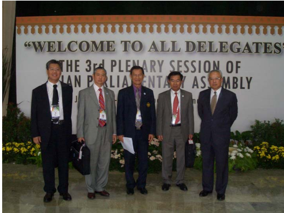
ร้อยโท อัครสิทธิ์ อมาตยกุล เอกอัครราชทูต ณ กรุงจาการ์ตา (คนแรกจากขวา) ร่วมถ่ายภาพกับคณะฯ (๒๗ พฤศจิกายน ๒๕๕๑)