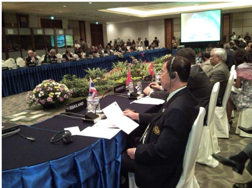
ดร.เจริญ คันธวงศ์ หัวหน้าคณะผู้แทนรัฐสภาไทย เข้าร่วมการประชุมคณะมนตรีบริหาร ครั้งที่ ๒ ของ APA (๒๖ พฤศจิกายน ๒๕๕๑)