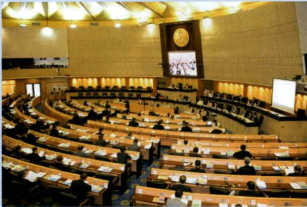
ที่มา : รัฐธรรมนูญแห่งราชอาณาจักรไทย (ฉบับชั่วคราว) พุทธศักราช ๒๕๕๗

ในกรณีที่สมาชิกสภานิติบัญญัติแห่งชาติถูกควบคุมหรือขัง ให้สิ่งปล່อยเมื่อประธานสภานิติบัญญัติแห่งชาติร้องขอ หรือในกรณีที่ถูกฟ้องในคดีอาญา ให้ศาลพิจารณาคดีต่อไปได้ เว้นแต่ประธานสภานิติบัญญัติแห่งชาติร้องขอให้งดการพิจารณาคดี