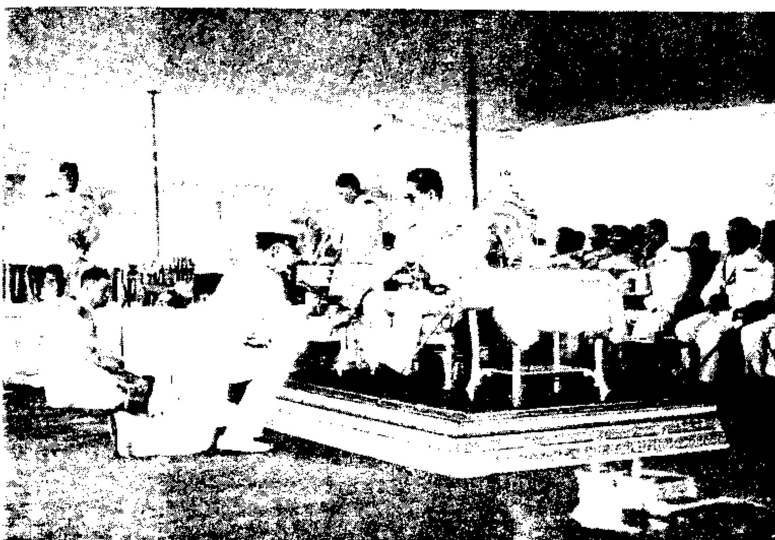
เสด็จ รัชกาลที่ ๙ ทรงเสด็จทอดพระเนตร การฝึกเรียนนายร้อย สปท. นักเรียนนายร้อย นักเรียนนายเรืออากาศ และนักเรียนนายทหารบกเหล่า ที่ศูนย์วิทยบาลศึกษา ปี ๒๕๐๘ ๗ ศาลวังการศกษาใหม่ ๒๒ กุมภาพันธ์ ๒๕๐๘