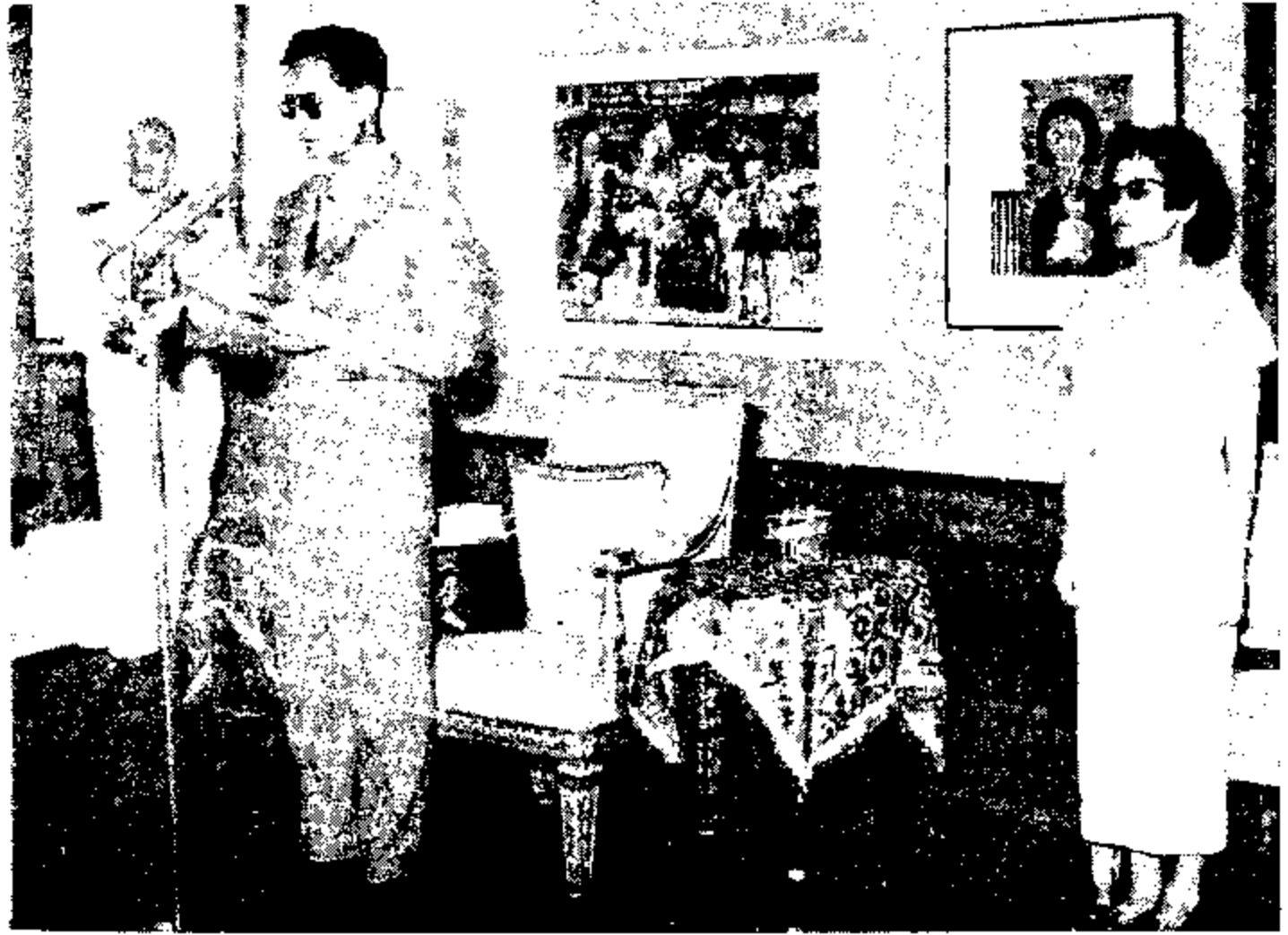
เสด็จฯ ไปทรงเป็นประธานในพิธีเปิดงานแสดงผลปกรรรมแห่งชาติ ครั้งที่ ๑๓ ณ หอศิลป์ กรมศิลปากร ๒๑ กุมภาพันธ์ ๒๕๑๕