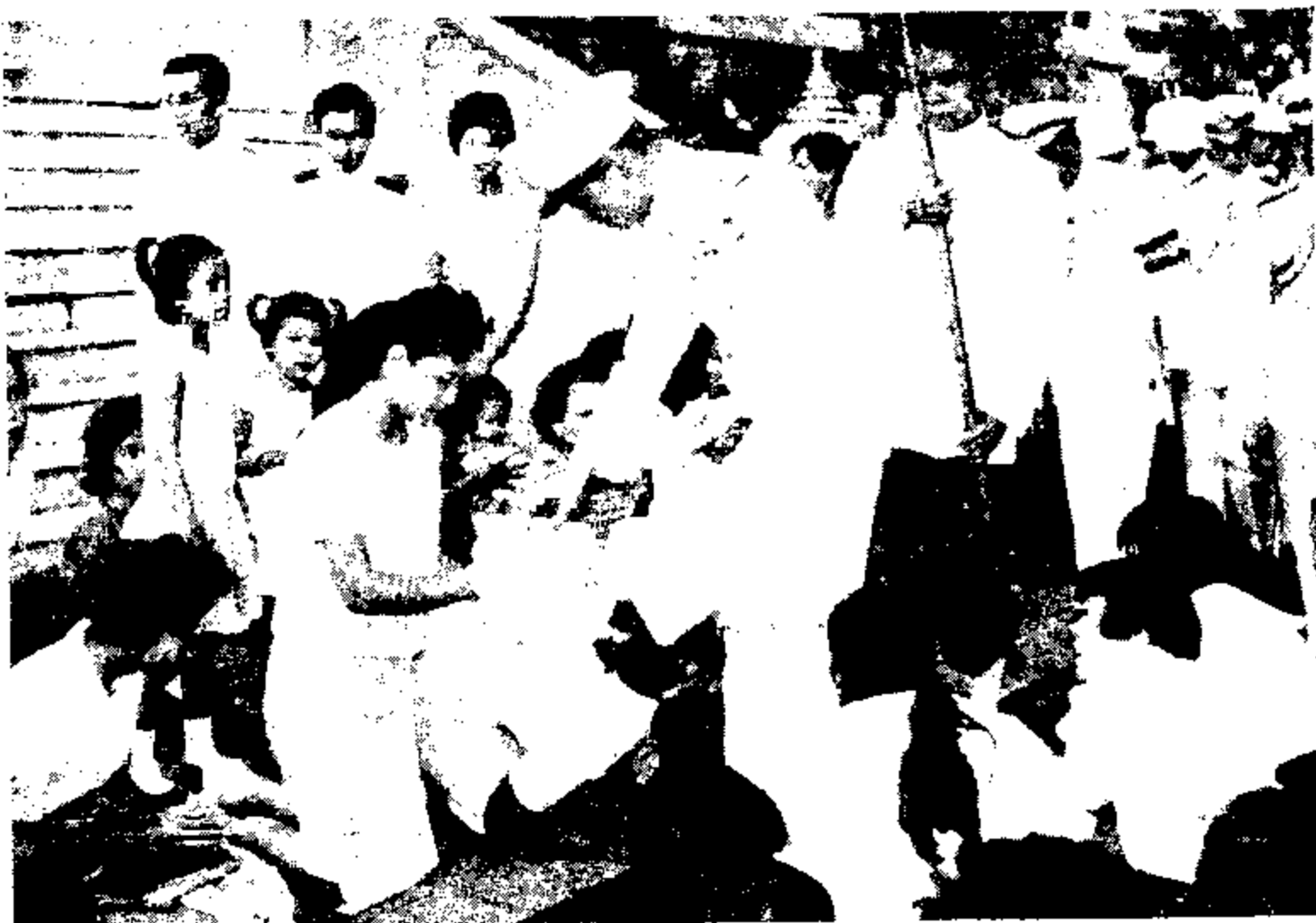
เสด็จฯ ยังพระอโศกวัดพระศรีรัตนศาสดาราม ในการพระราชกุศลมาฆบูชา ๑๕ กุมภาพันธ์ ๒๕๐๕