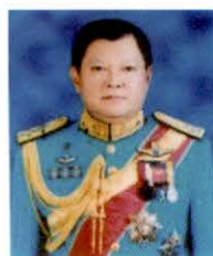
พลอากาศเอก อาคม กาญจนหิรัญ