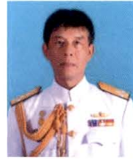
พลเรือเอก ธราธร ขจิตสุวรรณ