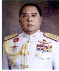
พลเอก จีรพงศ์ วรรณรัตน์