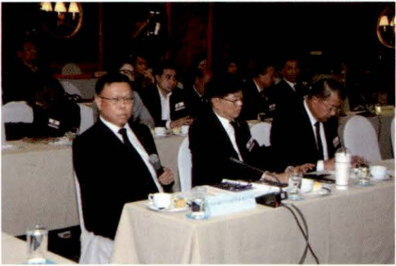
บรรยากาศการเสวนา