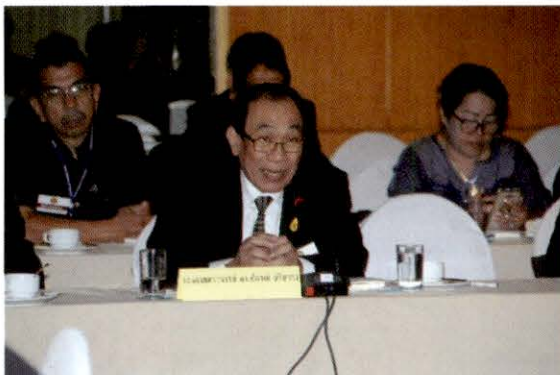
รองศาสตราจารย์ปรกรณ์ ปรียากร อดีตรัฐมนตรีว่าการกระทรวงวัฒนธรรม