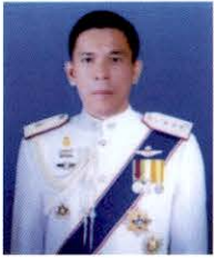
พลตำรวจโท ชาญเทพ เสสสะเวช