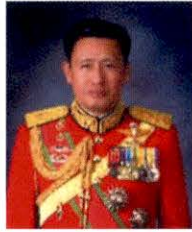
พลเอก เทพพงศ์ ทิพยจันทร์