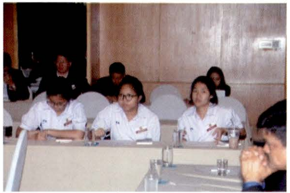
นักเรียนจากโรงเรียนศึกษานารี