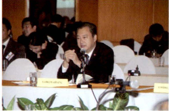
นายสมชาย แสงการ สมาชิกสภานิติบัญญัติแห่งชาติ