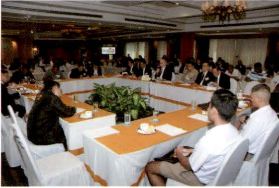
บรรยากาศการเสวนา