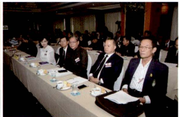
บรรยากาศการเสวนา