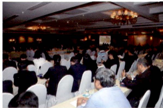
บรรยากาศการเสวนา