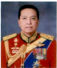
พลเอก พิสิทธิ์ สิทธิสาร