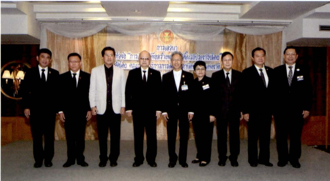
คณะกรรมการการเมือง สถาบันบัญญัติแห่งชาติ และวิทยากรนำการเสวนา