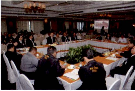
บรรยากาศการเสวนา