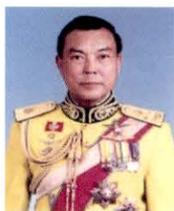
พลเอก ธีรเดช มีเพียร