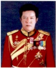
พลเอก นพดล อินทปัญญา