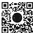
หนังสือนัดประชุม และระเบียบวาระการประชุม สภาผู้แทนราษฎร