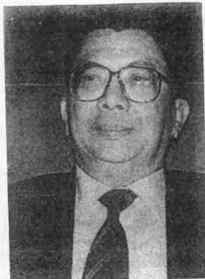
พล.อ.ชวลิต ยงใจยุทธ

พลเอกชวลิต ยงใจยุทธ ได้กล่าวถึง การประชุมของชาวนาที่เกิดขึ้นหลายครั้งว่า เป็นธรรมดาที่ประชาชนเดือดร้อนก็ต้องรวมตัว กัน แต่ได้ขอร้องไม่ให้กลุ่มประท้วงก่อความ เดือดร้อนหรือก่อความเสียหายใดๆ