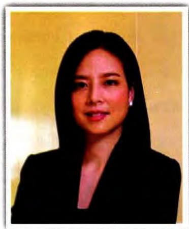
นางนวลพรรณ ล่ำซำ

รัฐมนตรีว่าการกระทรวงการพัฒนาสังคมและความมั่นคงของมนุษย์