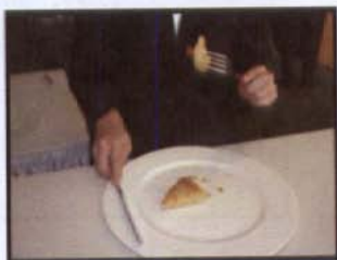
คว่ำส้อม ถุก