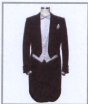
(Evening Dress / White Tie)

เป็นชุดใหญ่ที่มีความเป็นทางการที่สุด สำหรับงานราตรีสโมสร ในวงการทูต งานราชพิธีหรือรัฐพิธี หรืองานสังคมพิเศษ เช่น งานแต่งงานอย่างหรูหรา เป็นต้น ผู้ที่ไม่มีเครื่องแบบหรือไม่ประสงค์ จะแต่งเครื่องแบบจะแต่งกายชุดนี้ในงานที่กำหนดให้แต่งเครื่องแบบ เต็มยศก็ทำได้ และสามารถประดับเครื่องอิสริยาภรณ์ได้ด้วย โดยปกติชุดนี้จะแต่งในงานหลัง 18.00 น. แต่ถ้าเป็นงานราชพิธีหรือ รัฐพิธีที่มีกำหนดการให้แต่งชุดนี้หรือแต่งเครื่องแบบเต็มยศก็แต่งได้ แม้เป็นงานกลางวัน เช่น งานถวายพระพรราชสาส์นตราตั้ง