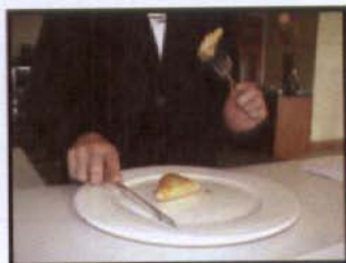
หงายส้อม ผิด