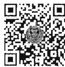
กระตุ้นถามสด ด้วยวาจา