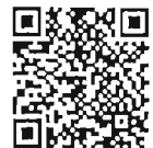
เอกสารประกอบ การพิจารณา สำนักวิชาการ