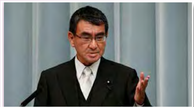
นายทาโร โคโนะ

วันที่ ๒๒ มกราคม ๒๕๖๑ นายทาโร โคโนะ รัฐมนตรีต่างประเทศของญี่ปุ่น เปิดเผยว่า ญี่ปุ่นจะยังคงจุดยืนในการเพิ่มแรงกดดันเพื่อให้เกาหลีเหนือล้มเลิกโครงการอาวุธนิวเคลียร์และขีปนาวุธ แทนที่จะสนับสนุนวิธีการเจรจาตามที่ยินยอมพลัดถิ่น โดยนายโคโนะได้แสดงจุดยืนดังกล่าวในระหว่างการประชุมรัฐสภาสมัยสามัญระยะเวลา ๑๕๐ วัน ซึ่งเริ่มต้นขึ้นในวันนี้ โดยก่อนหน้านี้ รัฐมนตรีว่าการกระทรวงการต่างประเทศญี่ปุ่นได้ประชุมร่วมกับรัฐมนตรีต่างประเทศและเจ้าหน้าที่จากสหรัฐอเมริกา เกาหลีใต้ และประเทศอื่น ๆ อีก ๑๗ ประเทศในเมืองแวนคูเวอร์ ซึ่งนายโคโนะได้กล่าวกับที่ประชุมว่า การประชุมร่วมระหว่างเกาหลีเหนือและใต้เป็นสิ่งที่ไม่ควรใช้เป็นเวลาเท่านั้น นอกจากนี้นายโคโนะยังกล่าวต่อสภาไดเอทว่า ญี่ปุ่นจะไม่จัดการเจรจาร่วมกับเกาหลีเหนือเพื่อแลกมาซึ่งความผ่อนคลายเพียงชั่วคราว โดยญี่ปุ่นจะไม่ยอมให้เกาหลีเหนือพัฒนาอาวุธนิวเคลียร์และขีปนาวุธแน่นอน พร้อมทั้งกล่าวด้วยว่า การยกระดับการกดดันเกาหลีเหนืออย่างต่อเนื่องนั้นเป็นสิ่งจำเป็น