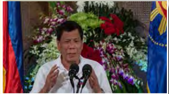
ประธานาธิบดีโรดริโก ดูเตอร์เต

วันที่ ๖ กุมภาพันธ์ ๒๕๖๑ ศาลสูงสุดของฟิลิปปินส์ ให้ความเห็นชอบการขยายเวลาของกฎอัยการศึกออกไปอีก ๑ ปี ตามคำขอของประธานาธิบดีโรดริโก ดูเตอร์เต ของฟิลิปปินส์ ซึ่งครอบคลุมพื้นที่ภาคใต้ของประเทศ ก่อนหน้านี้ นายดูเตอร์เตประกาศกฎอัยการศึกครอบคลุมทั้งเกาะมินดาเนาของฟิลิปปินส์ในเดือนพฤษภาคมปีที่แล้ว เพื่อการสู้รบกับกลุ่มติดอาวุธที่สนับสนุนกลุ่มก่อการร้ายไอเอสที่ก่อความไม่สงบในเมืองมาราวิ ทางรัฐสภาฟิลิปปินส์เห็นชอบแผนของ นายดูเตอร์เตที่จะขยายเวลาไปจนหมดปี ๒๕๖๑ แต่นักเคลื่อนไหวด้านสิทธิมนุษยชนคัดค้านเพราะเกรงว่าจะเกิดปัญหาการใช้อำนาจเผด็จการ จึงร้องขอให้ศาลฎีกาพิจารณา โดยศาลฎีกาได้ออกแถลงการณ์วันนี้ ให้ความเห็นชอบการขอต่อเวลาของกฎอัยการศึกตามที่รัฐบาลและรัฐสภายื่นขอ ด้วยคะแนนเสียง ๑๐ ต่อ ๕