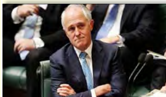
นายมาร์ติน พาร์กินสัน

วันที่ ๓๑ มกราคม ๒๕๖๑ นายมาร์ติน พาร์กินสัน หัวหน้าสำนักนายกรัฐมนตรีและคณะรัฐมนตรีออสเตรเลีย สั่งการให้หน่วยงานที่เกี่ยวข้องให้เริ่มทำการสอบสวนด่วน กรณีแฟ้มเอกสารความลับราชการหลายร้อยชิ้นถูกนำไปวางขายในร้านขายของมือสอง และตั้งข้อสังเกตว่าเป็นการละเมิดมาตรการรักษาความลับเกี่ยวกับการประชุมคณะรัฐมนตรีครั้งใหญ่ที่สุดในประวัติศาสตร์ออสเตรเลีย ตามปกติเอกสารการประชุมคณะรัฐมนตรีทั้งหมดของออสเตรเลียจะถูกปิดผนึก และรักษาไว้เป็นความลับไปจนกว่าจะมีการเผยแพร่ให้สาธารณชนทราบในอีก ๒๐ ปีต่อมา ที่ผ่านมาสักข่าวเอบีซีได้เสนอข่าวเจาะลึกเรื่องนี้มาหลายตอน แต่ไม่เปิดเผยชื่อร้านหรือคนที่ซื้อตู้เอกสารดังกล่าว ระบุว่าแฟ้มเอกสารการประชุมคณะรัฐมนตรีทั้งของรัฐบาลปัจจุบันและอีก ๕ ชุดก่อนในรอบ ๑๐ ปีที่ผ่านมา นอกจากนี้ ร้านนั้นยังขายเครื่องเฟอร์นิเจอร์เก่าในยุครัฐบาลชุดก่อน ๆ หลายรายการในราคาถูกมาก ในรายงานที่สำนักข่าวเอบีซีออกอากาศ แสดงให้เห็นว่าแฟ้มเอกสารจำนวนมากถูกตั้งไว้ในตู้เก็บเอกสารในลักษณะปิดล็อก มีคนซื้อตู้เอกสารนั้นจากร้านขายของเก่าแห่งหนึ่งในกรุงแคนเบอร์รา ตามปกติเอกสารการประชุมคณะรัฐมนตรีทั้งหมดของออสเตรเลียจะถูกปิดผนึกและรักษาไว้เป็นความลับไปจนกว่าจะมีการเผยแพร่ให้สาธารณชนทราบในอีก ๒๐ ปีต่อมา การเสนอข่าวเรื่องนี้มีขึ้นในช่วงที่รัฐสภาออสเตรเลียอยู่ระหว่างการพิจารณาร่างกฎหมายฉบับหนึ่งที่มุ่งจะป้องกันไม่ให้รัฐบาลต่างชาติเข้ามาแทรกแซงในเรื่องการเมืองของออสเตรเลีย