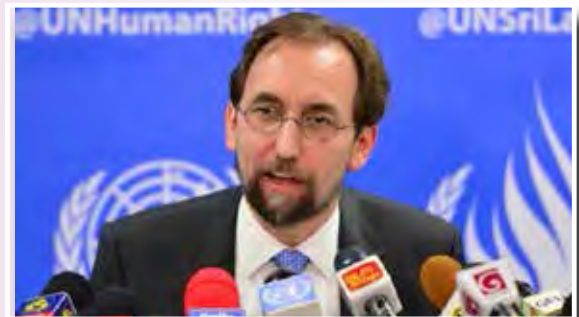
นายซาอิด ราอัด อัล ฮุสเซน

รัฐบาลอินโดนีเซียกำลังเร่งพิจารณาผ่านร่างกฎหมายให้ “การรักร่วมเพศและการมีเพศสัมพันธ์นอกสมรส” เป็นอาชญากรรม กฎหมายนี้จะมีผลบังคับใช้ภายในวันวาเลนไทน์ ๑๔ กุมภาพันธ์ ๒๕๖๑ โดยนายซาอิด ราอัด อัล ฮุสเซน ข้าหลวงใหญ่คณะมนตรีสิทธิมนุษยชนแห่งสหประชาชาติ แถลงเมื่อวันที่ ๘ กุมภาพันธ์ ๒๕๖๑ ว่า แนวความคิดแบบสุดโต่งของรัฐบาลอินโดนีเซีย ที่กำหนดให้การรักร่วมเพศเป็นอาชญากรรมนั้น มีความน่าเป็นห่วงอย่างมาก เพราะถือเป็นการข่มขู่ให้สังคมเกิดความแตกแยก เกิดการเลือกปฏิบัติ เกิดความเกลียดชัง และอาจนำไปสู่ความรุนแรงในอินโดนีเซียเอง โดยเฉพาะในพื้นที่จังหวัดอาเจะห์ ที่ปกครองโดยกฎหมายชัยาอาฮายาห์ ที่เคยมีการจับกุมและลงโทษกลุ่มรักร่วมเพศหลาย ๆ ครั้ง และยังเปรียบเทียบอีกว่า หากอินโดนีเซีย ซึ่งเป็นประเทศมุสลิม ต้องการต่อต้านแนวความคิดการเกลียดกลัวชาวมุสลิม เพื่อไม่ให้ผู้คนทั่วโลกเหมารวมและเลือกปฏิบัติ อินโดนีเซียเองก็ควรยุติแนวคิดการเลือกปฏิบัติในบ้านของตนเองก่อน เพราะการเลือกปฏิบัติ ในทางศาสนา เป็นเรื่องที่ผิด และการเลือกปฏิบัติทางเพศก็เป็นเรื่องที่ผิดเช่นกัน โดยคำแถลงการณ์นี้มีขึ้นหลังจากที่นายซาอิด เดินทางไปยังอินโดนีเซีย เพื่อหารือในประเด็นนี้ร่วมกับรัฐสภาอินโดนีเซีย โดยในระหว่างการประชุม ประธานาธิบดีโจโก วิโดโด ของอินโดนีเซีย พยายามอธิบายว่า เหตุใดอินโดนีเซียถึงไม่สามารถยอมรับกลุ่มคนรักเพศเดียวกันได้ โดยนายวิโดโด อ้างถึงวัฒนธรรมท้องถิ่นและความเชื่อของคนในประเทศ