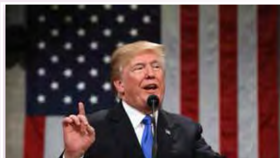
ประธานาธิบดีโดนัลด์ ทรัมป์

วันที่ ๓๑ มกราคม ๒๕๖๑ ประธานาธิบดีโดนัลด์ ทรัมป์ ของสหรัฐฯ ได้ขึ้นกล่าวสุนทรพจน์และแถลงนโยบายประจำปีต่อสภาองเกรสเป็นครั้งแรก หลังเข้ารับตำแหน่งผู้นำสหรัฐฯ ครบ ๑ ปี ทรัมป์ยกย่องว่าสหรัฐฯ ปลอดภัยเข้มแข็ง และนำภาคภูมิใจ ภายใต้การบริหารงานของตนเอง โดยบอกว่าเป็นช่วงเวลาที่ดีที่สุดที่ชาวอเมริกันจะได้เริ่มต้นใช้ชีวิตตามแนวคิดแบบ American Dream ซึ่งตั้งอยู่บนพื้นฐานของความเท่าเทียม รวมถึงสิทธิและเสรีภาพในการดำเนินชีวิต ผลงานเด่นที่ทรัมป์กล่าว คือ นโยบายด้านเศรษฐกิจ เห็นได้จากสภาพเศรษฐกิจที่ฟื้นตัวขึ้น ตัวเลขจ้างงานในประเทศที่เพิ่มขึ้นถึง ๒ ล้าน ๔ แสนตำแหน่ง รวมถึงตลาดหลักทรัพย์ที่พุ่งทะยาน แม้ว่าจะสวนทางกับคะแนนนิยมของเขาลดต่ำลงอย่างต่อเนื่องก็ตาม นอกจากนี้ ทรัมป์ยังเรียกร้องให้พรรคเดโมแครตประนีประนอม เพื่อให้สามารถบรรลุข้อตกลงต่าง ๆ และทำงานร่วมกันได้ ซึ่งคาดว่าหมายถึงข้อเสนอของเขาที่จะให้สัญชาติเยวชนที่เข้าเมืองผิดกฎหมายหรือดริมเมอร์ส แลกกับการให้เดโมแครตช่วยอนุมัติงบสร้างกำแพงกั้นพรมแดนสหรัฐฯ-เม็กซิโก ส่วนนโยบายด้านต่างประเทศ ทรัมป์ประกาศว่า แทบทุกพื้นที่ในซีเรียและอิรักที่เคยตกอยู่ภายใต้การปกครองของกลุ่มรัฐอิสลามหรือไอเอส ถูกยึดคืนได้หมดแล้ว แต่ปฏิบัติการกวาดล้างกลุ่มก่อการร้ายกลุ่มนี้จะยังดำเนินต่อไป จนกว่าไอเอสทั้งหมดจะพ่ายแพ้ รวมทั้ง ทรัมป์ยังได้ประณามเกาหลีเหนือที่ยังคงเดินหน้าพัฒนาขีปนาวุธและอาวุธนิวเคลียร์ที่เป็นภัยกับสหรัฐฯ ซึ่งรัฐบาลจะใช้มาตรการทั้งหมดกดดันไม่ให้เกิดขึ้น รวมถึงมีการกล่าวถึงคู่แข่งอย่างรัสเซียและเงินที่ทำลายผลประโยชน์ของสหรัฐฯ ด้วย