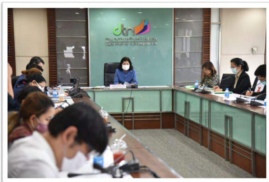
กระทรวงพาณิชย์กับการพิจารณาประเด็นการเข้าร่วมเป็นสมาชิก CPTPP ของไทย