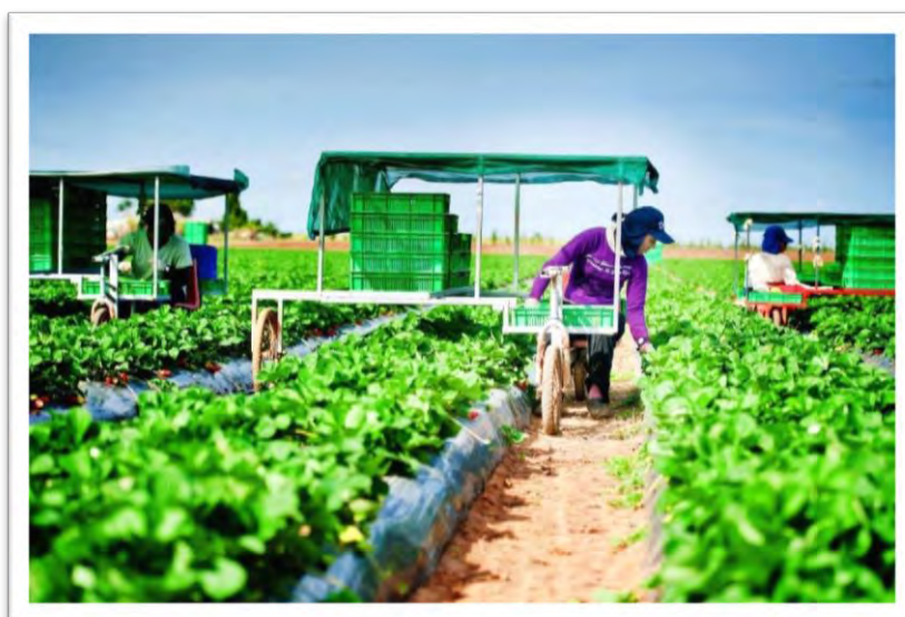
CPTPP อาจส่งผลกระทบต่อภาคเกษตรกรรมของไทย

CPTPP ใช้เงื่อนไขการเจรจาแบบ negative list หรือการระบุนายการที่ไม่เปิดเสรี กล่าวคือ ประเทศสมาชิกสามารถระบุนายการธุรกิจบริการที่ไม่ต้องการเปิดเสรีได้ ส่วนหมวดธุรกิจบริการอื่น ที่ไม่ได้เลือกไว้ในข้อตกลงจะต้องเปิดเสรีต่อนักลงทุนต่างชาติทั้งหมด ดังนั้น สำหรับประเทศไทยที่เป็นประเทศที่ค่อนข้างปิดในหมวดบริการ การเปิดเสรีนี้อาจทำให้ธุรกิจบริการภายในประเทศเสียประโยชน์ให้กับนักลงทุนต่างชาติไป