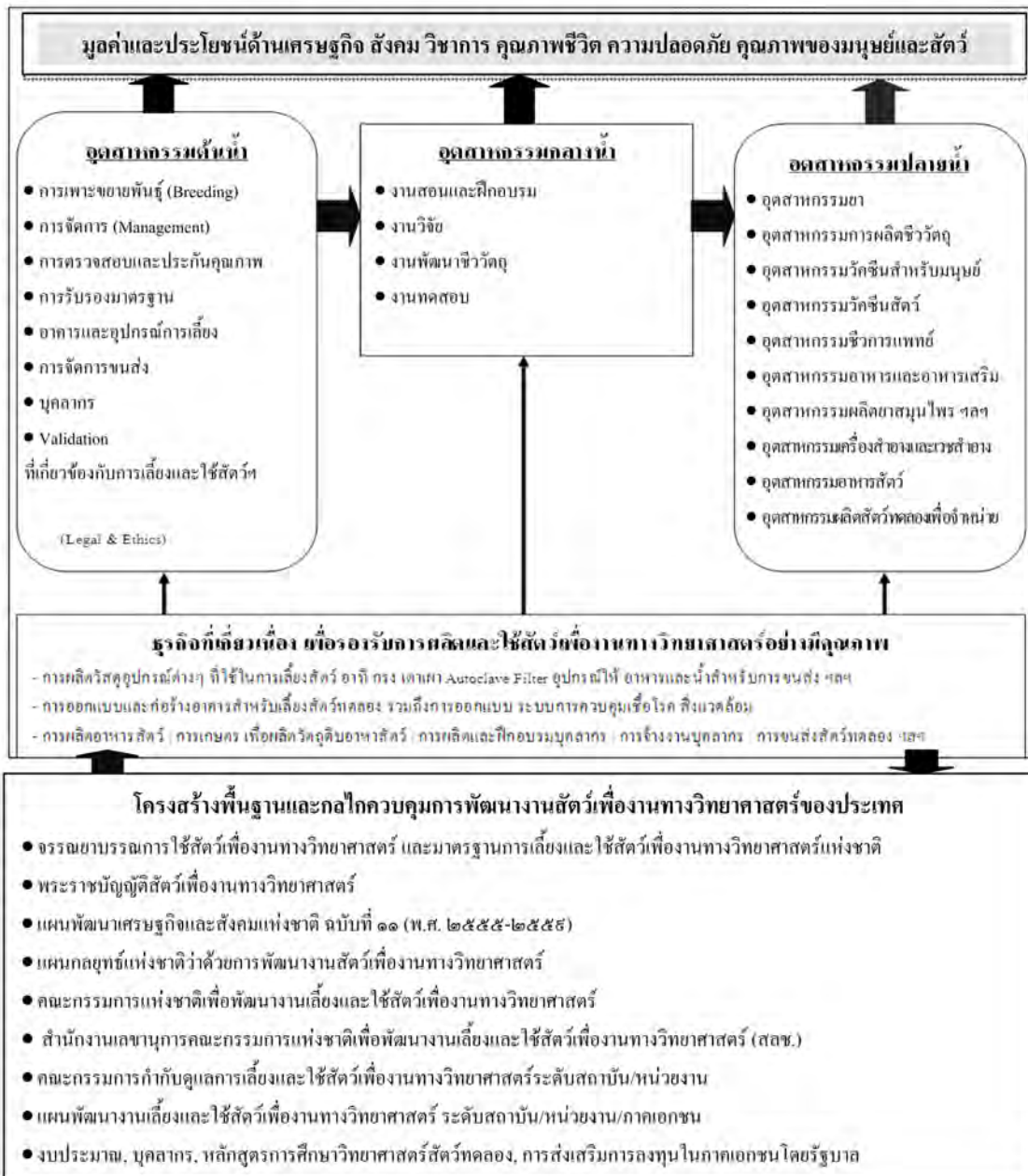
ภาพที่ ๕ มูลค่าและประโยชน์ของงานและผลงานจากการเลี้ยงและใช้สัตว์เพื่องานทางวิทยาศาสตร์ กับ การพัฒนางานสัตว์เพื่องานทางวิทยาศาสตร์

โดยใช้ผลงานวิจัยของคนไทยจากงานวิจัยทางชีวการแพทย์ วิทยาศาสตร์ชีวภาพ และเทคโนโลยีชีวภาพในการผลิตผลิตภัณฑ์ต่าง ๆ จากผลงานวิจัยเหล่านั้นขึ้นเองในประเทศ โดยไม่ต้องอาศัยการนำเข้าจากต่างประเทศและสามารถส่งเป็นสินค้าออกไปยังต่างประเทศได้ด้วย