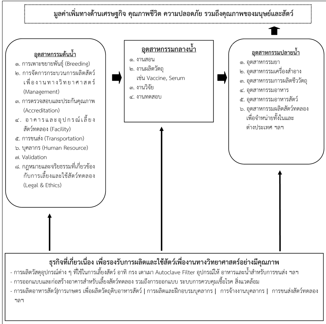
ภาพที่ ๒ แสดงความเชื่อมโยงระหว่างอุตสาหกรรม ธุรกิจที่เกี่ยวข้องและประโยชน์ของการพัฒนา งานเลี้ยงและใช้สัตว์เพื่องานทางวิทยาศาสตร์ให้ได้มาตรฐานเป็นที่ยอมรับในระดับสากล