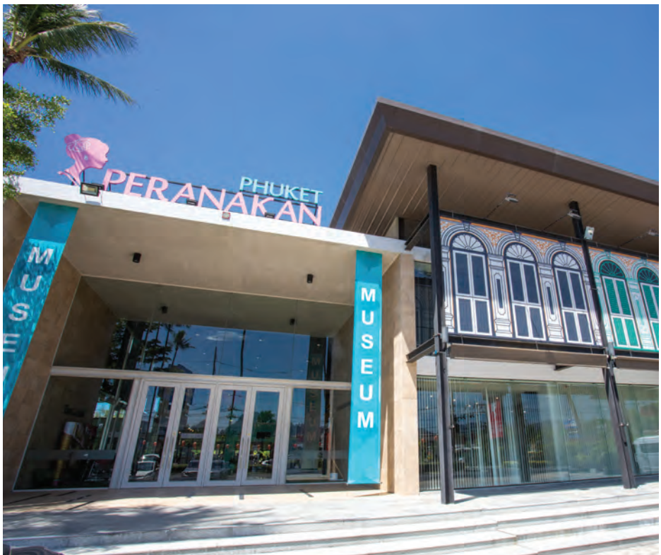
พิพิธภัณฑ์เพอรานากัน

พิพิธภัณฑ์เพอรานากัน ภูเก็ต ถนนเทพกษัตรี ตำบลศรีสุนทร เป็นอุทยานการเรียนรู้ศิลปวัฒนธรรมวิถีชีวิต และประเพณีท้องถิ่นของชาวภูเก็ต “เพอรานากัน” มาจากภาษามลายูหมายถึง “เกิดที่นี่” ใช้เรียกชาวจีนที่มีเชื้อสายผสม ภายในมีการจำลองบ้านทรงจีน-โปรตุเกส ที่เป็นเอกลักษณ์ของเมืองภูเก็ต อีกทั้งจัดแสดงชุดเครื่องแต่งกายบาบ๋า-ย่าหยา เครื่องประดับเพอรานากัน ค่าเข้าชมชาวไทย ผู้ใหญ่ ๒๐๐ บาท เด็ก ๑๐๐ บาท ชาวต่างชาติ ผู้ใหญ่ ๓๐๐ บาท เด็ก ๑๕๐ บาท พิพิธภัณฑ์เปิดทุกวัน เวลา ๐๙.๐๐-๑๘.๐๐ น. สอบถามข้อมูล โทร. ๐ ๗๖๓๓ ๓๕๕๖, ๐ ๗๖๓๑ ๓๐๓๓ www.peranakanphuketmuseum.com