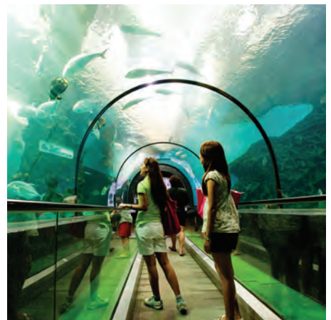
สถานแสดงพันธุ์สัตว์น้ำภูเก็ต

สถานแสดงพันธุ์สัตว์น้ำภูเก็ต หมู่ที่ ๘ ถนนศักดิ์เดช บริเวณปลายแหลมพันวา เป็นที่รวบรวมพันธุ์สัตว์น้ำจืดและน้ำเค็มกว่า ๑๐๐ ชนิด แบ่งโซนการจัดแสดงได้แก่ โซนน้ำจืดและโซนน้ำเค็ม ภายนอกอาคารมีเส้นทางเดินศึกษาธรรมชาติ ป่าโกงกางให้นักท่องเที่ยวได้สัมผัสกับธรรมชาติ เปิดให้เข้าชมทุกวัน ตั้งแต่เวลา ๐๘.๓๐-๑๖.๓๐ น. ปิดขายบัตรเวลา ๑๖.๐๐ น. ค่าเข้าชม ชาวไทย ผู้ใหญ่ ๕๐ บาท เด็ก ๒๐ บาท ชาวต่างชาติ ผู้ใหญ่ ๑๘๐ บาท เด็ก ๑๐๐ บาท สอบถามข้อมูล โทร. ๐ ๗๖๓๙ ๑๑๒๖ www.phuketaquarium.org