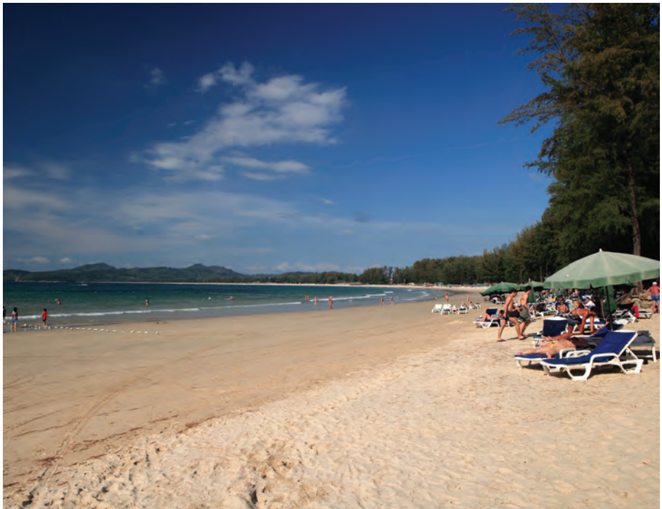
หาดบางเทา

ชุมชนท่องเที่ยวบ้านบางเทา-เชิงทะเล ตำบลเชิงทะเล พื้นที่ส่วนใหญ่อยู่ริมทะเล ประกอบอาชีพทำประมงและการเกษตร ได้แก่ ฟาร์มเลี้ยงแพะแบบครบวงจร การทำสวนยาง การทำเกษตรอินทรีย์แบบผสมผสาน ชมไร่สับปะรดภูเก็ต ฯลฯ มีกลุ่มอนุรักษ์อาหารพื้นบ้าน สาธิตการทำอาหารท้องถิ่น เช่น การทำข้าวยาใบपाโหม ขนมอาโป้ง การทำน้ำพริก นอกจากนี้ยังมีแหล่งท่องเที่ยวทางธรรมชาติ สามารถเดินชมบรรยากาศบนจุดชมวิวบางเทาภูิวิว ซึ่งมองเห็นได้ถึง ๓ หาด ได้แก่ หาดสุรินทร์ หาดลายัน และหาดในทอน อีกทั้งยังเป็นจุดชมพระอาทิตย์ตกที่สวยงาม