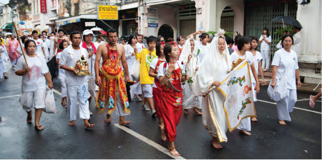
ประเพณีถือศีลกินผัก

ร้านอาหารฮาลาล รวมถึงการจำหน่ายเสื้อผ้าและสินค้ามุสลิม