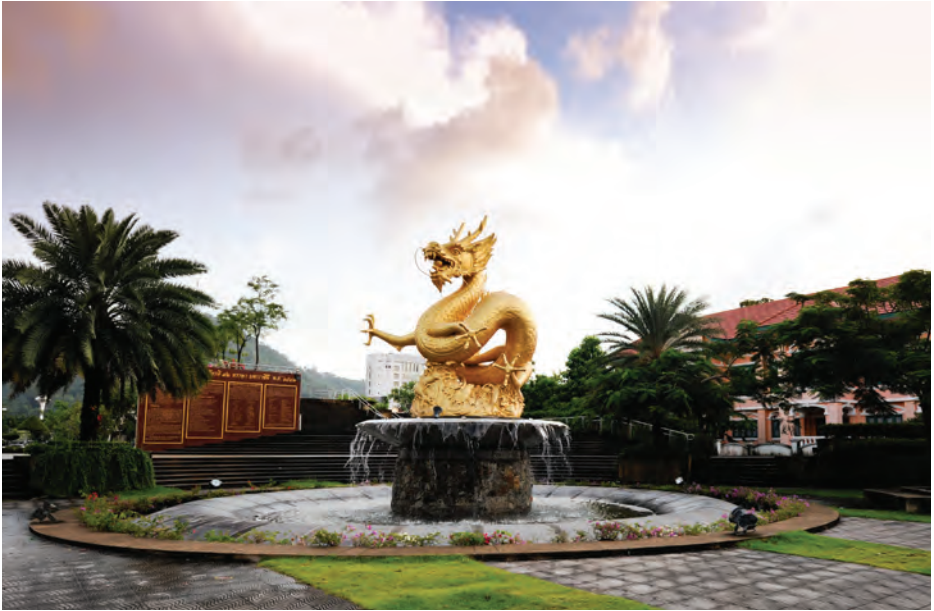
สวนเฉลิมพระเกียรติ ๗๒ พรรษา มหาราชินี หรือ ลานมังกร

สวนเฉลิมพระเกียรติ ๗๒ พรรษา มหาราชินี หรือ ลานมังกร ถนนถลาง ติดกับ ทพท.สำนักงานภูเก็ต เป็นสถานที่จัดกิจกรรมและประเพณีหลักของภูเก็ต เทศบาลนครภูเก็ตได้ก่อสร้าง เนื่องในโอกาสสมเด็จพระนางเจ้าสิริกิติ์ พระบรมราชินีนาถ ทรงเจริญพระชนมายุครบ ๗๒ พรรษา ในปี พ.ศ. ๒๕๔๗ ได้รับพระกรุณาธิคุณพระราชทานนามสวนสาธารณะแห่งนี้ว่า “สวนเฉลิมพระเกียรติ ๗๒ พรรษา มหาราชินี” และในโอกาสเฉลิมฉลองพระบาทสมเด็จพระปรมินทรมหาภูมิพลอดุลยเดช (รัชกาลที่ ๙) ทรงครองสิริราชสมบัติครบ ๖๐ ปี เมื่อวันที่ ๙ มิถุนายน ๒๕๔๙ ได้จัดสร้าง “มังกรทะเล” หรือ “ย้ายแหล่งอ่อง” ขึ้นเพื่อความเป็นสิริมงคลของคนภูเก็ต