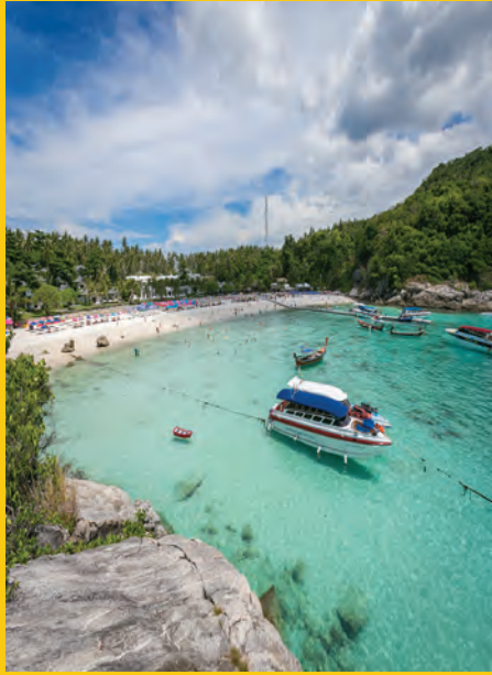
เกาะราชา