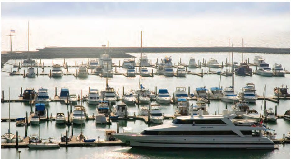
มทกรรมเรือสำราญและมารีน่า

งานไทยแลนด์ ยอร์ช โชว์ แอนด์ ราน เคอวูซ์ จัดขึ้นในช่วงเดือนมกราคม บริเวณรอยัล ภูเก็ต มารีน่า เป็นงานแสดงเรือสำราญนานาชาติ ที่รวมผู้ประกอบการเรือยอร์ชจากทั่วโลก แสดงศักยภาพประเทศไทย ในฐานะศูนย์กลางกิจกรรมไลฟ์สไตล์ทางทะเลระดับสูงของเอเชีย โดยเน้นกลุ่มเป้าหมายที่กลุ่มนักเล่นเรือยอร์ชระดับไฮเอนด์ ซึ่งมีอำนาจการใช้จ่ายสูง อีกทั้งเป็นการส่งเสริมธุรกิจการเช่าเรือซูเปอร์ยอร์ช การท่องเที่ยวและกิจกรรมทางน้ำในเส้นทางเดินเรือใหม่