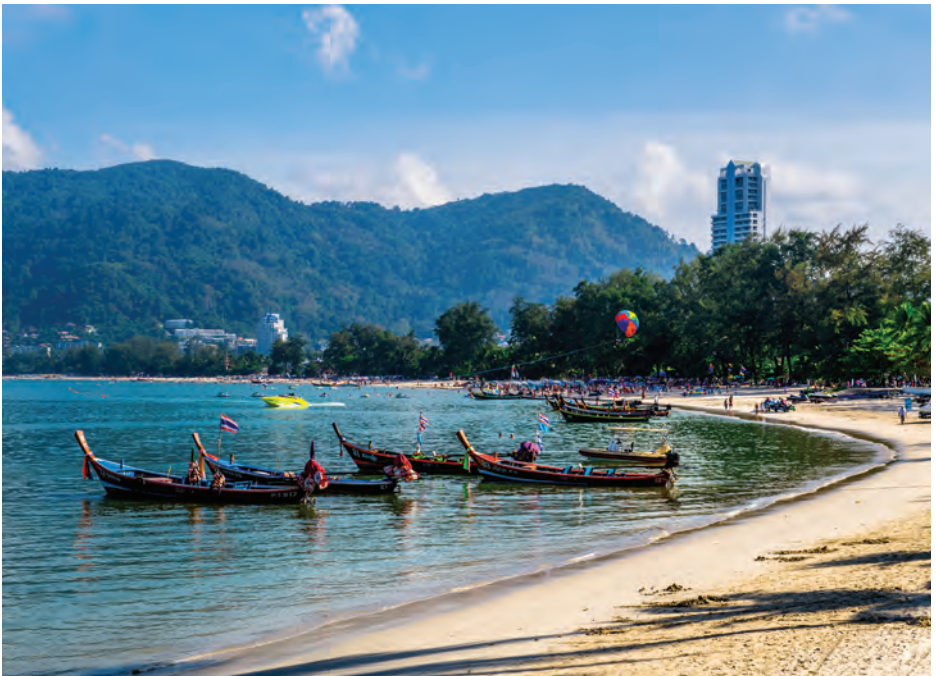
หาดป่าตอง