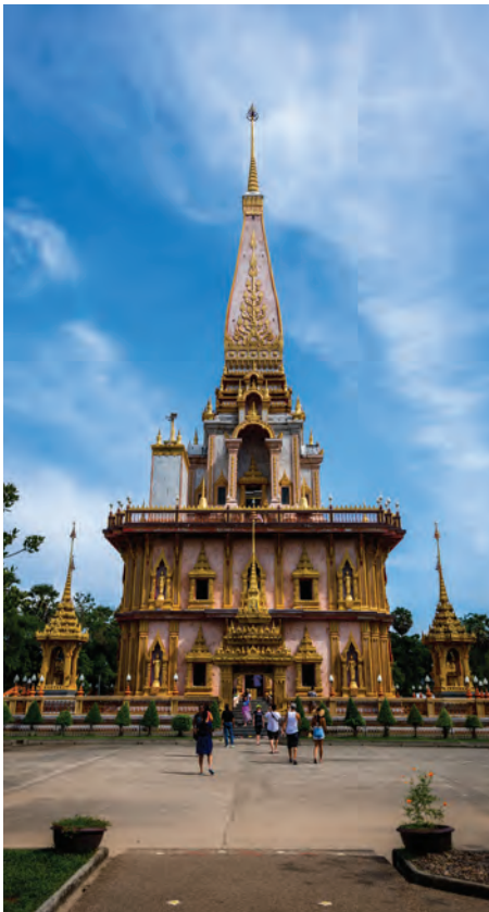
วัดฉลอง หรือ วัดไชยธาราราม

สวนสัตว์ภูเก็ต ซอยป่าหลาย ถนนเจ้าฟ้า ภายใน บรรยากาศร่มรื่น มีการแสดงช้างและจระเข้ ค่าเข้าชม ชาวไทย ๑๐๐ บาท ชาวต่างชาติ ๕๐๐ บาท เปิดทุกวัน เวลา ๐๘.๓๐-๑๘.๐๐ น. สอบถาม ข้อมูล โทร. ๐ ๗๖๒๘ ๒๐๔๓, ๐ ๗๖๓๗ ๔๔๒๔