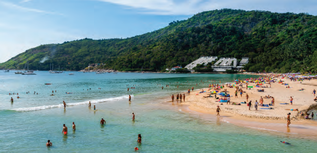
หาดในหาน

หาดในหาน ชายหาดเงียบสงบ ยาวประมาณ ๗๐๐ เมตร เป็นที่นิยมของนักท่องเที่ยวต่างชาติ ด้านหลังหาดเป็นบึง ชาวบ้านเรียกว่า “หนองหาน” มีที่พัก ร้านอาหารและสิ่งอำนวยความสะดวกบริการ