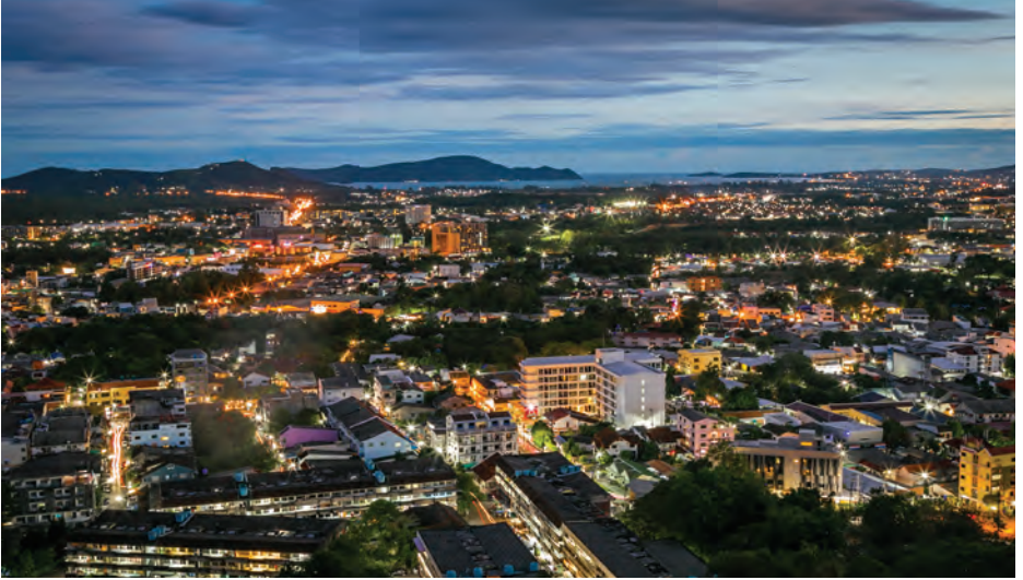
จุดชมวิวยางา

เกาะสิเหร่ ตั้งอยู่ทางทิศตะวันออกเฉียงใต้ของภูเก็ต แยกออกมามีคลองทำจันทัน มีสะพานเชื่อมติดต่อกันเดินทางได้สะดวก บนยอดเขาเป็นที่ประดิษฐานพุทธรูปสำริด และสามารถมองเห็นทัศนียภาพที่สวยงาม บริเวณแหลมตึกแกเป็นที่ตั้งของหมู่บ้านชาวเล ประกอบอาชีพประมง ชายหาดไม่เหมาะสำหรับเล่นน้ำ เนื่องจากชายหาดเป็นโคลน