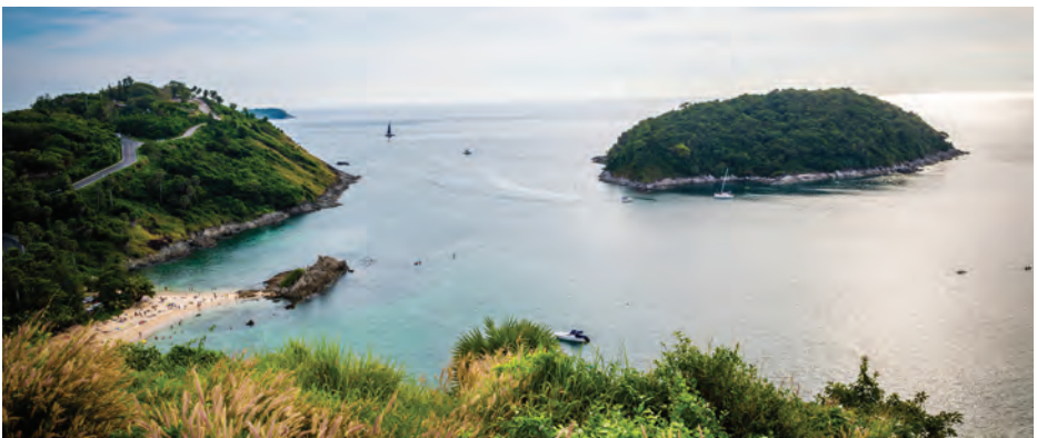
จุดชมวิวกังหันลม

จุดชมวิวกังหันลม อยู่บนยอดเขาระหว่างหาดในหานและหาดยะนุ้ยซึ่งติดกับแหลมพรหมเทพ บริเวณจุดชมวิวกังหันมีศาลาและพื้นที่นั่งเล่นสำหรับนักท่องเที่ยวในการชมบรรยากาศของแหลมพรหมเทพและหาดในหาน ถือเป็นสถานที่แนะนำสำหรับการชมพระอาทิตย์ตกดินที่สวยงามอีกแห่งหนึ่งของจังหวัดภูเก็ต