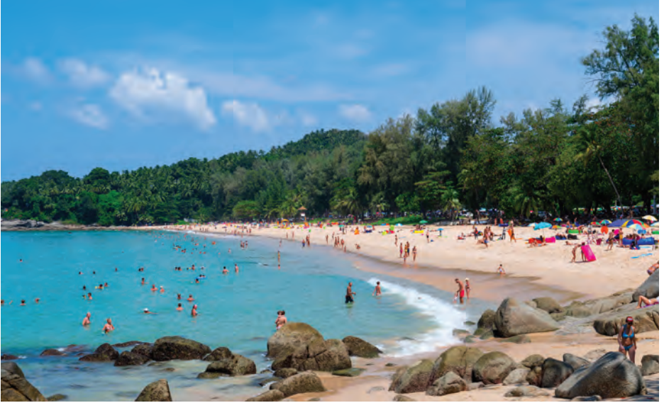
หาดสุรินทร์

หาดสุรินทร์ อยู่ทางด้านตะวันตกของเกาะภูเก็ต เป็นหาดอยู่ริมเชิงเขา มีหาดทรายขาวละเอียด บริเวณชายหาด เป็นที่นิยมการเล่นกระดานโต้คลื่น เนื่องจากมีคลื่นลมค่อนข้างแรง บริเวณชายหาดมีที่พัก สิ่งอำนวยความสะดวกบริการนักท่องเที่ยว