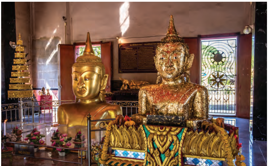
วัดพระทอง

สถานีพัฒนาและส่งเสริมการอนุรักษ์สัตว์ป่าเขาพระแทว ตำบลเทพกระษัตรี ได้รับการจัดตั้งเป็นอุทยานสัตว์ป่าเขาพระแทว เมื่อเดือนกันยายน พ.ศ. ๒๕๒๐ เป็นป่าที่อุดมสมบูรณ์ ยังคงความเป็นธรรมชาติและความอุดมสมบูรณ์ไว้ได้ สามารถพบสัตว์ป่าได้หลากหลายชนิด เช่น หมูป่า ลิง หมีป่า กระเจง รวมถึงปาล์มหลังขาว พันธุ์ไม้หายาก ค้นพบที่อุทยานแห่งนี้เป็นแห่งแรก