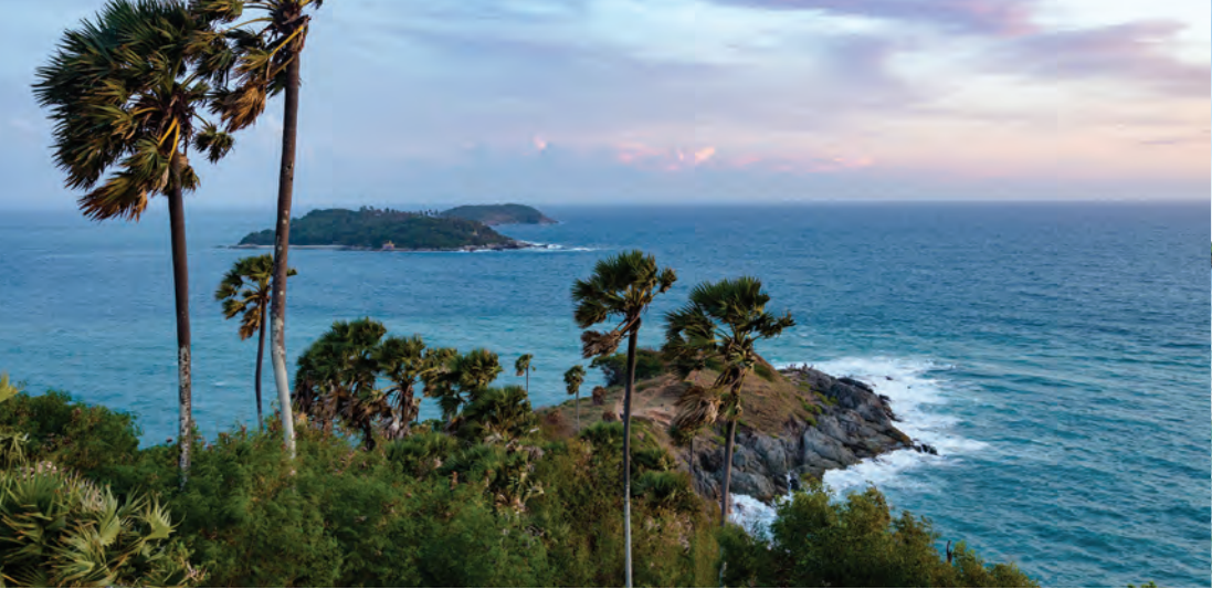
แหลมพรหมเทพ

แหลมพรหมเทพ เป็นแหลมที่อยู่ตอนใต้สุดของเกาะภูเก็ต ชาวบ้านเรียกว่า “แหลมเจ้า” จากริมหน้าผามีแนวต้นตาลลาดลงสู่ปลายแหลมที่เป็นโขดหิน ซึ่งจะเห็นเกาะแก้วพิสดารอยู่ทางด้านหน้า เป็นจุดชมทิวทัศน์และพระอาทิตย์ตกที่สวยงาม นอกจากนี้ยังมี “ประกาศการกาญจนาภิเษก แหลมพรหมเทพ” สร้างขึ้นในวโรกาส ที่พระบาทสมเด็จพระปรมินทรมหาภูมิพลอดุลยเดช (รัชกาลที่ ๙) ฉลองสิริราชสมบัติครบ ๕๐ ปี แสงไฟจากประกาศการสามารถมองเห็นไกลถึง ๓๙ กิโลเมตร ภายในมีการแสดงนิทรรศการเกี่ยวกับการสร้างประกาศการ การรักษาเวลามาตรฐาน การคำนวณและแสดงเวลาดวงอาทิตย์ขึ้นและตก