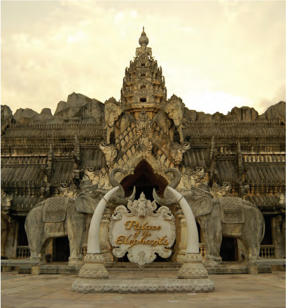
ภูเก็ต แฟนตาซี

ภูเก็ตแฟนตาซี บริเวณหาดกมลา เป็นการแสดงชุด “มหัศจรรย์กมลา” ซึ่งเป็นการแสดงที่ผสมผสานระหว่างศิลปวัฒนธรรมไทยและเทคนิคพิเศษ แสงสีเสียงทันสมัย ตื่นตาตื่นใจด้วยการท่องเที่ยวไปกับตำนานโบราณของเมืองกมลา พร้อมกับตัวละครในเทพนิยาย นำเสนอม่านตัวเอกคือ เจ้าชายกมลา และช่างคู่บารมีไอยรา ภายในวังไอยราหรือโรงละครขนาดใหญ่ ความจุ ๓,๐๐๐ ที่นั่ง นอกจากนี้ยังสามารถร่วมสนุกกับเกมต่าง ๆ ภายในธีมลึกลับ