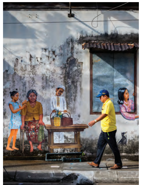
ภาพวาดสตรีท อาร์ต เมืองเก่าภูเก็ต