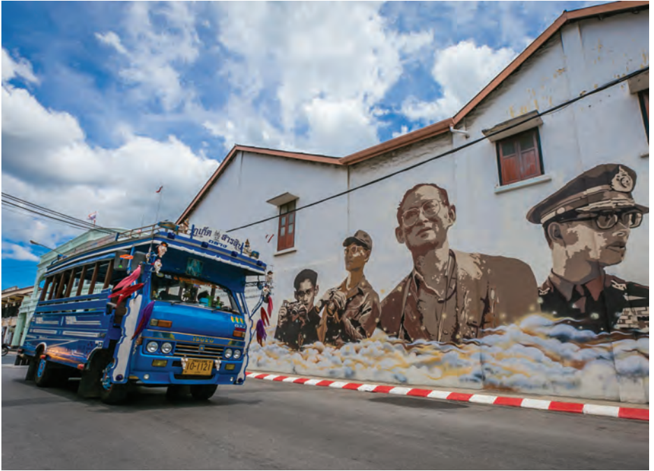
ย่านเมืองเก่าตึกแถวโบราณ อาคารชิน-โปรตุเกส