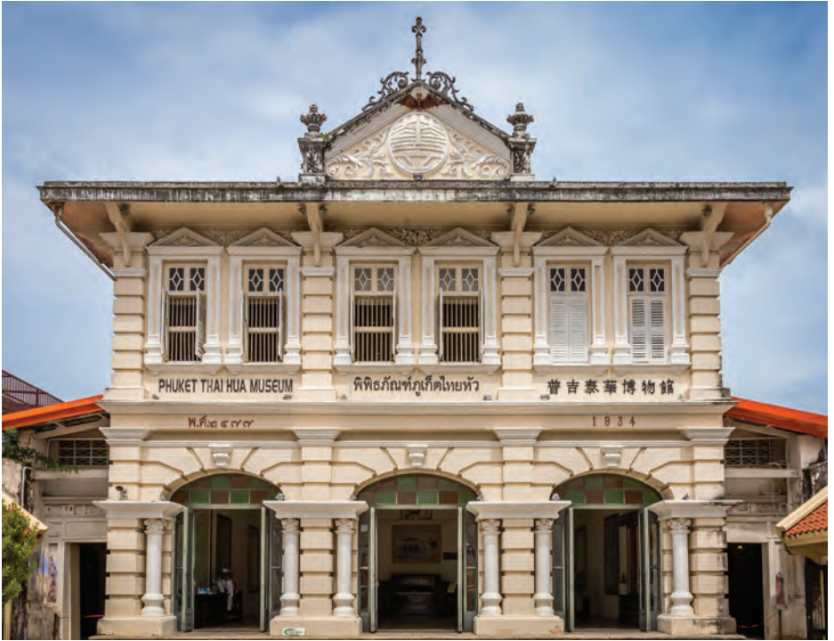
พิพิธภัณฑ์ภูเก็ตไทยหัว

พื้นที่ชั้น ๑ เป็นห้องโถงมีการจัดแสดงนิทรรศการหมุนเวียน ชั้นที่ ๒ เป็นพื้นที่จัดแสดงนิทรรศการเพอรานากันนิยม บอกเล่าเรื่องราวความเป็นมาและตัวตนของชาวเพอรานากัน พิพิธภัณฑ์เปิดวันอังคาร-วันอาทิตย์ (หยุดวันจันทร์) เวลา ๐๙.๐๐-๑๖.๓๐ น. ไม่เสียค่าเข้าชม สอบถามข้อมูล โทร. ๐๙ ๔๘๐๗ ๗๘๗๓