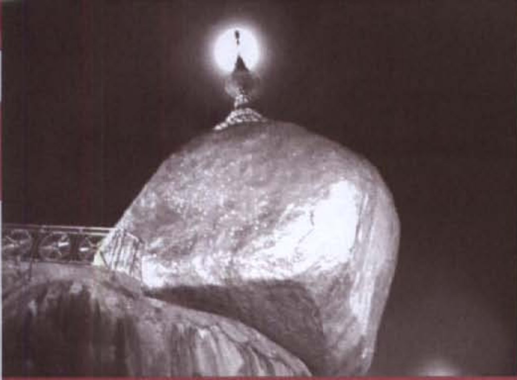
พระธาตุอินทร์แขวน