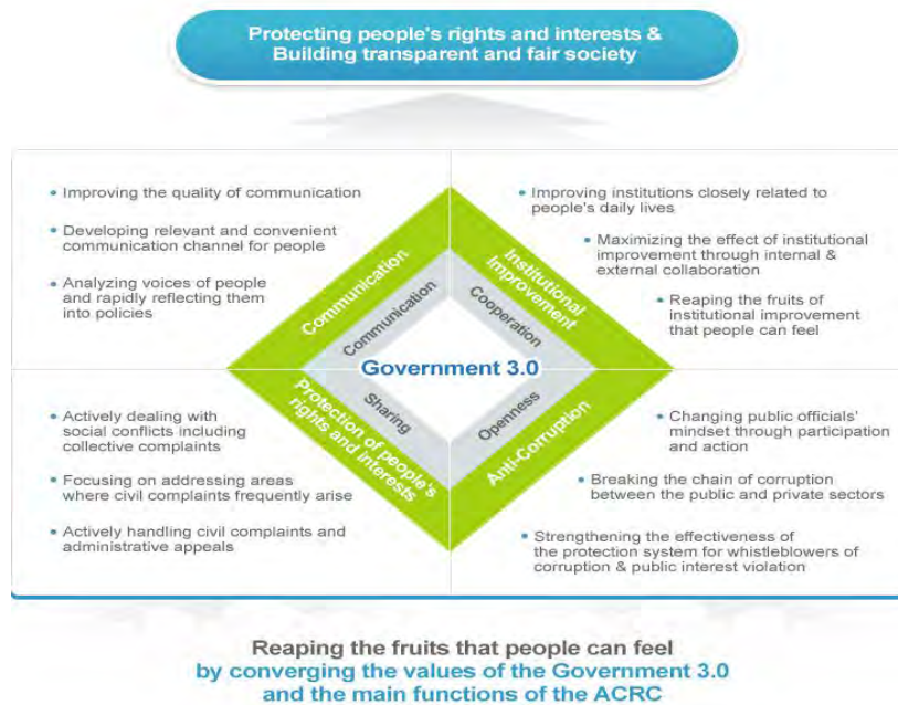
ภาพที่ 2 แผนภาพพันธกิจและวิสัยทัศน์ของสำนักงานคณะกรรมการต่อต้านการทุจริตและสิทธิพลเมืองแห่งเกาหลีใต้

ทั้งนี้ ACRC มีการกำหนดพันธกิจและวิสัยทัศน์ ปรากฏตามรูปภาพ ดังนี้