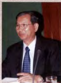
รศ.ดร.เกียรติขจร วัฒนสวัสดิ์