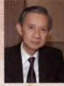
พต.อ.ชัยพร เจริญพาณิชย์