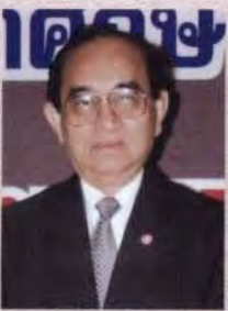
ศ ดร.อมร จันทรสมบุรณ์