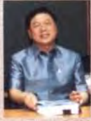
พต.ต.อ.ธานี สมบูรณ์ทรัพย์