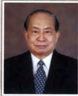
ศาสตราจารย์คณิ่ง ภาไชย นักกฎหมายดีเด่น (ภาคเอกชน)