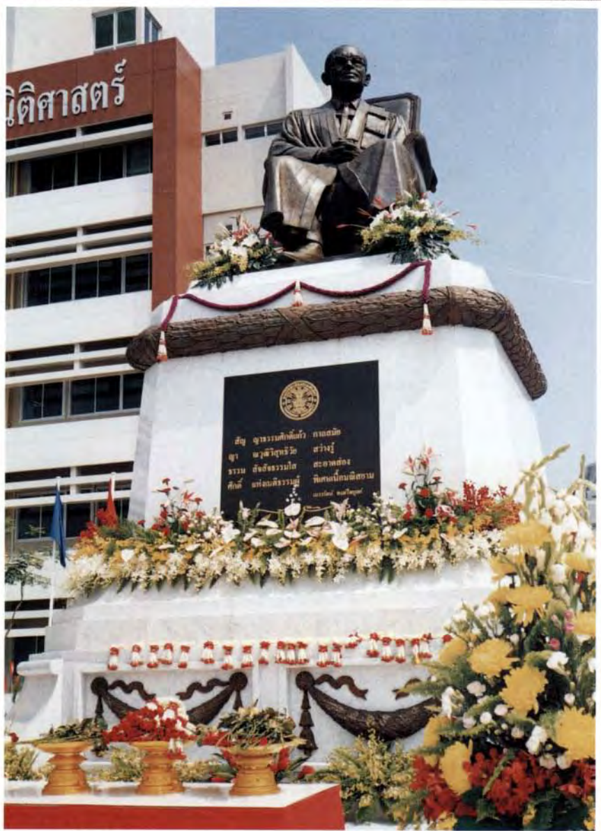
อนุสาวรีย์ศาสตราจารย์สัญญา ธรรมศักดิ์ ตั้งอยู่ด้านหน้าคณะนิติศาสตร์ มหาวิทยาลัยธรรมศาสตร์ ศูนย์รังสิต โดย ฯพณฯ พลเอกเปรม ติณสูลานนท์ ประธานองคมนตรีและรัฐบุรุษ ประธานในพิธีเปิดเมื่อวันที่ ๕ เมษายน ๒๕๔๖