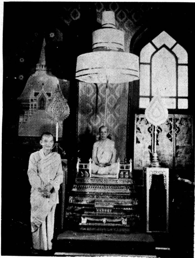
พระสงฆ์ พ.ร. อธิการบดีชั้นธรรมวิเศษ วัดสุทัศน์สุทนต์ ผู้ปกครองคณะสงฆ์กรุงเทพฯ ชั้นวิเศษชั้นพิเศษ เป็นเจ้าพิธีแห่งสุทนต์ และ คณะสงฆ์ในเขตปกครองชั้นพิเศษชั้นวิเศษ เป็นเจ้าพิธีในเขตสุทนต์ สมเด็จพระสังฆราชเจ้า กรมหลวงชินวราลงกรณ ๒๖ ๑ กันยายน ๒๕๐๓