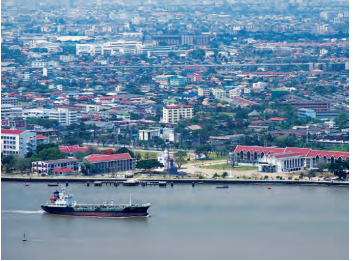
ปากน้ำสมุทรปราการ

หลายรูปแบบ เช่น การใช้กระจกสีแบบศิลปะตะวันตก, เครื่องเบญจรงค์ สลับลวดลายสอดสี, การดุนโลหะบนแผ่นดีบุกของช่างเมืองนครศรีธรรมราช และรูปปั้นโบราณชนิดต่างๆ อาทิ คนธรรพ์บรรเลงดนตรี รูปพญานาค ของช่างเมืองเพชร ส่วนชั้นใต้ดินที่เรียกว่า “ชั้นบาดาล” เป็นที่จัดแสดง นิทรรศการและโบราณวัตถุจำนวนมาก อาทิ พระพุทธรูป เทวรูปสมัยต่างๆ และเครื่องลายครามของจีน ระเบียงรอบนอกตัวอาคารประกอบด้วยซุ้มแปดซุ้ม รอบพิพิธภัณฑ์เป็นอุทยานพรรณไม้ในวรรณคดี และพันธุ์ไม้หายากจากทุกภูมิภาคของประเทศ มีงานประติมากรรมลอยตัวเรื่อง รามเกียรติ์ วางเรียงรายล้อมรอบอาคาร พิพิธภัณฑ์ข้างเอราวัณเปิดให้เข้าชมทุกวัน เวลา ๐๘.๐๐-๑๘.๐๐ น. (รอบชมสุดท้าย ๑๗.๐๐ น.) ค่าเข้าชม ผู้ใหญ่ ๑๕๐ บาท เด็ก ๕๐ บาท สอบถามรายละเอียดโทร. ๐ ๒๓๗๑ ๓๑๓๕-๖ โทรสาร. ๐ ๒๓๘๐ ๐๓๐๔ หรือ www.erawan-museum.com