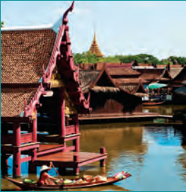
เมืองโบราณ

ข้อมูล : ททท. สำนักงานกรุงเทพมหานคร กองข่าวสารท่องเที่ยว (โทร. ๐ ๒๒๕๐ ๕๕๐๐ ต่อ ๒๑๔๑ - ๕) ออกแบบและจัดพิมพ์ : กองผลิตอุปกรณ์เผยแพร่ ฝ่ายบริการการตลาด ข้อมูลรายละเอียดที่ระบุในเอกสารนี้อาจมีการเปลี่ยนแปลงได้ ลิขสิทธิ์ของการท่องเที่ยวแห่งประเทศไทย เมษายน ๒๕๕๔ ห้ามจำหน่าย