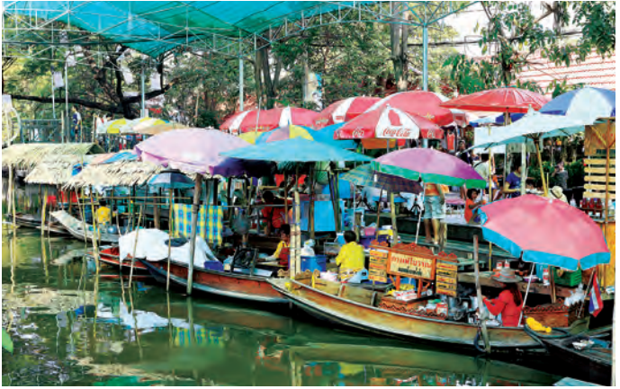
ตลาดน้ำบางน้ำผึ้ง