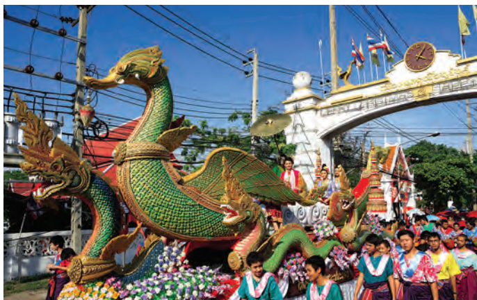
ประเพณีสงกรานต์พระประแดง

ทางธรรมดา สาย ๒๕, ๑๐๒ และ ๑๔๕ ลงตลาดปากน้ำ แล้วต่อรถประจำทางปากน้ำ-คลองด่าน ถึงตลาดคลองด่านสามารถต่อรถรับจ้างเดินทางถึงวัด