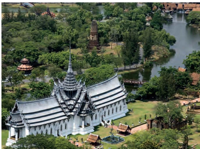
เมืองโบราณ

ฟาร์มจระเข้และสวนสัตว์สมุทรปราการ ตั้งอยู่บนท้ายบ้าน ตำบลท้ายบ้าน ห่างจากตัวเมืองประมาณ ๔ กิโลเมตร หรือสามารถเข้าทางถนนสุขุมวิท (สายเก่า) เทศบาลบางปูซอย ๔๖ ตั้งขึ้นเมื่อ พ.ศ. ๒๕๙๓ ปัจจุบันเป็น ฟาร์มจระเข้ที่ใหญ่ที่สุดในโลก ภายในเป็นสถานเพาะเลี้ยงจระเข้ขนาด ต่างๆ กว่า ๖๐,๐๐๐ ตัว มีการแสดงโชว์จระเข้ทุกวัน ตั้งแต่เวลา ๐๙.๐๐- ๑๖.๐๐ น. ทุกๆ ๑ ชั่วโมง (พักเที่ยง) วันหยุดเพิ่มรอบ ๑๒.๐๐ น. และ ๑๗.๐๐ น. เวลาการให้อาหารจระเข้ ๑๖.๓๐-๑๗.๓๐ น. นอกจากนี้ยังมีการ แสดงของช้างแสนรู้ ซึ่งเป็นอีกกิจกรรมหนึ่งที่มีความสนใจจากนัก ท่องเที่ยวเป็นอันมาก โดยมีการแสดงทุก ๑ ชั่วโมง เริ่มตั้งแต่เวลา ๐๙.๓๐- ๑๖.๓๐ น. ทุกวัน นอกจากการเลี้ยงจระเข้แล้ว ภายในฟาร์มยังมีสัตว์อื่นๆ อีก เช่น เสือ ลิงชิมแปนซี ชะนี เต่า งู นก อูฐ ฮิปโปโปเตมัส กวาง และ