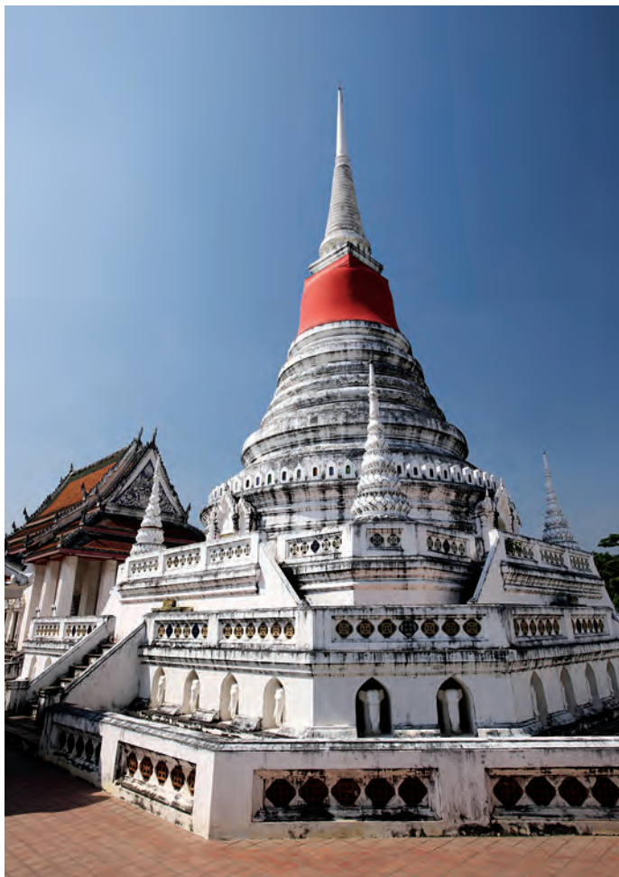
พระสมุทรเจดีย์