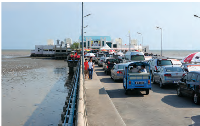
สถานตากอากาศบางปู

การเดินทาง จากสามแยกสมุทรปราการไปตามถนนประโคนชัย (เข้าตลาดปากน้ำ) ประมาณ ๑๐๐ เมตร วัตถุประสงค์ริมถนนทางด้านซ้ายมือ สามารถใช้บริการรถโดยสารประจำทางปรับอากาศ สาย ๒๕, ๑๐๒, ๑๔๒, ๑๔๕, ๕๐๗, ๕๐๘ และ ๕๓๖ และรถโดยสารประจำทางธรรมดาสาย ๒๕, ๑๐๒ และ ๑๔๕