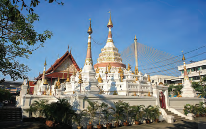
วัดทองธรรมวชิหาร

เพชรพิไชย (เกตุ) สร้างขึ้นในสมัยรัชกาลที่ ๒ มีลักษณะสถาปัตยกรรมดีเด่นคือ พระอุโบสถไม่มีช่อฟ้าใบระกา หน้าบันมีศิลปะปูนปั้นลายเครือเถาประดับเครื่องลายคราม ภายในมีพระประธานปางมารวิชัยหล่อด้วยโลหะ พระวิหารมีลักษณะสถาปัตยกรรมเช่นเดียวกับพระอุโบสถ ภายในมีพระพุทธรูปไสยาสน์พระพักตร์งามมาก เหนือหน้าต่ามีภาพปริศนาธรรมเป็นศิลปะตะวันตกแปลกตาหาดูยาก นอกจากนี้ยังมีพระมณฑปหลังคามุงด้วยกระเบื้องรางรายรอบด้วยเก๋งจีน ประดิษฐานพระพุทธรูปปางต่าง ๆ มีพระปรารักษ์ที่มุมทั้ง ๔ ด้าน ภายในพระมณฑปมีพระพุทธรูปและรอยพระพุทธรบาทจำลองประดับมุข