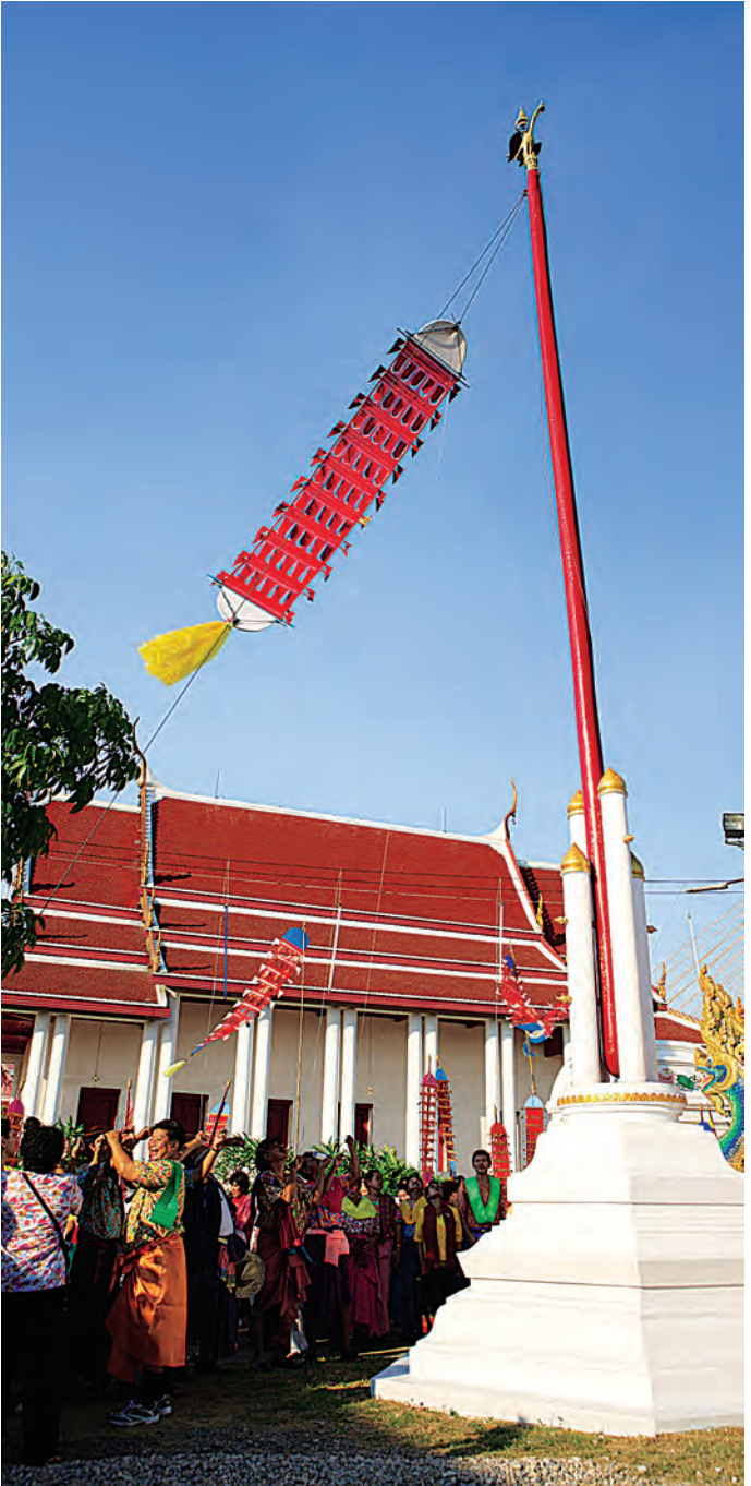
ประเพณีแห่งสี่องตะขาบ สงกรานต์พระประแดง