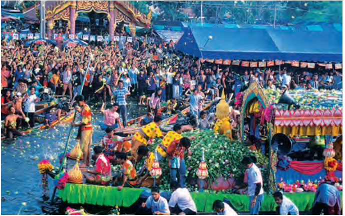
ประเพณีรับบัว-โยนบัว

งานนมัสการองค์พระสมุทฺรเจดีย์ เป็นงานประเพณีที่ยิ่งใหญ่ที่มีประชาชนทั่วประเทศมานมัสการ มีงานฉลองใหญ่ประจำปี ๗ วัน ๗ คืน (เริ่มตั้งแต่วันแรม ๕ ค่ำ เดือน ๑๑ ของทุกปี) ในงานมีการประกวดขบวนแห่ผ้าห่มองค์พระสมุทฺรเจดีย์ โดยทางรถยนต์รอบตลาดปากน้ำ แล้ววกกลับมาที่องค์พระสมุทฺรเจดีย์ มีพิธีเวียนเทียนรอบองค์พระสมุทฺรเจดีย์ มีการแข่งเรือในลำน้ำเจ้าพระยา รวมทั้งมีมหรสพสมโภช และการแสดงสินค้าต่างๆ