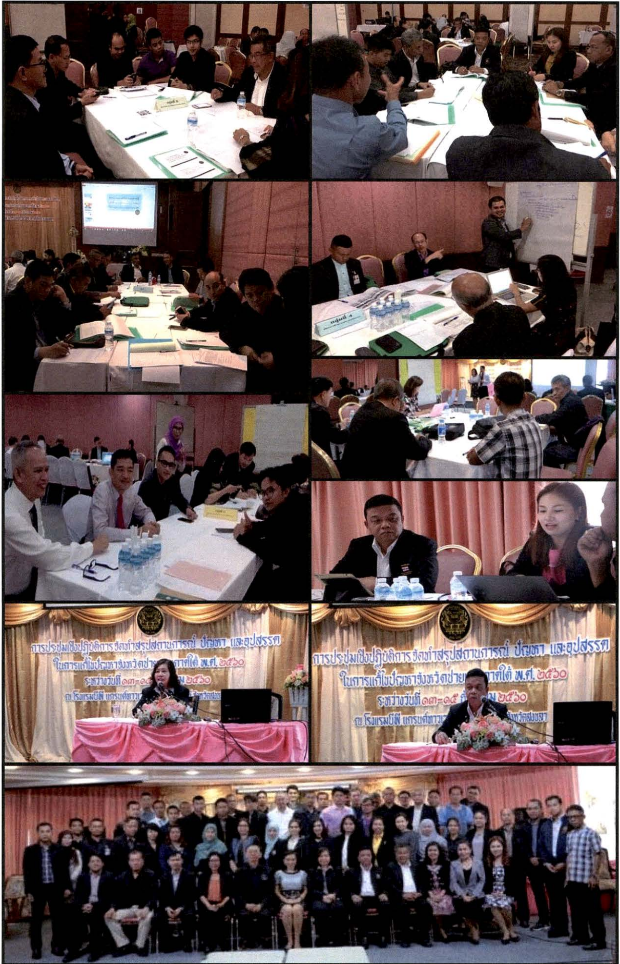
สรุปสถานการณ์ ปัญหา และอุปสรรคในการแก้ไขปัญหาจังหวัดชายแดนภาคใต้ ประจำปี พ.ศ. ๒๕๖๐ | ๔๔