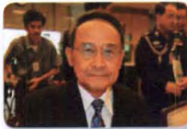
พล.อ.อ. ไพศาล สิตบุตร ลำดับที่ ๑๐๐