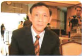
พล.อ. อนันตพร กาญจนรัตน์ ลำดับที่ ๑๘๔