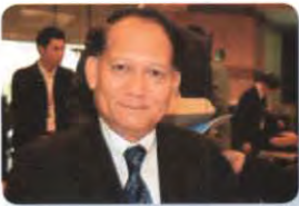
พล.อ.อ. สฤกษ์พงษ์ โกมุทานนท์ ลำดับที่ ๑๖๑