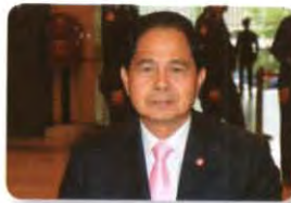
พล.อ. รังสาathy แซ่มเชื้อ ลำดับที่ ๒๐๙