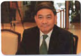
พล.อ. ทวีป เนตรนิยม ลำดับที่ ๐๕๒