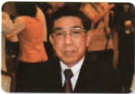
พล.ท. ชาทอดม ติตถะสิริ ลำดับที่ ๐๓๗