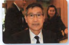
พล.อ.อ. ตรีทศ สนแจ้ง ลำดับที่ ๐๔๕