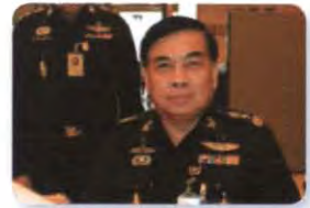
พล.ท. ภาณุวัชร นาควงษ์มณี ลำดับที่ ๑๐๕