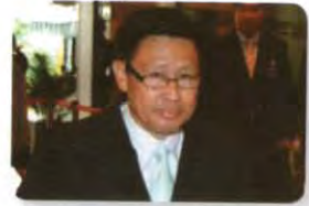
พล.ท. เทพพงศ์ ทิพยจันทร์ ลำดับที่ ๒๐๑