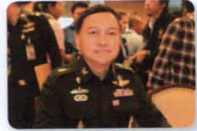
พล.อ. นิพัทธ์ ทองเล็ก ลำดับที่ ๐๖๙