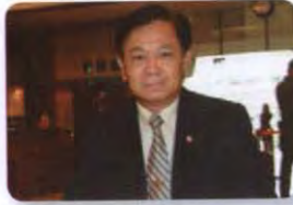
พล.อ. ศุภวุฒิ อุตมะ ลำดับที่ ๒๑๒