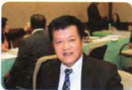
พล.อ. นพดล อินทปัญญา ลำดับที่ ๐๖๔