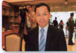
พล.ต.อ. วีชรพล ประสารราชกิจ ลำดับที่ ๑๑๙