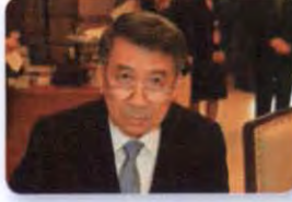
พล.อ.อ. เพิ่มเกียรติ ลวงะมาลย์ ลำดับที่ ๐๙๘