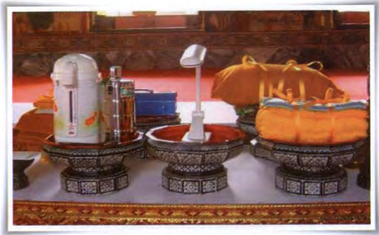
เครื่องบริวารพระกฐินพระราชทาน