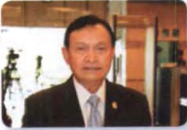
พล.อ. พิรุณ แผ้วพลสง ลำดับที่ ๐๙๔