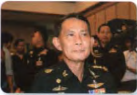
พล.อ. ปรีชา จันทร์โอชา ลำดับที่ ๐๘๒