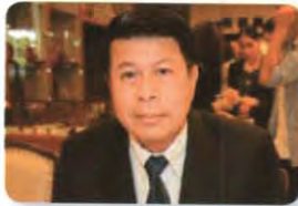
พล.ท. ชาญชัย ภูทอง ลำดับที่ ๐๓๕