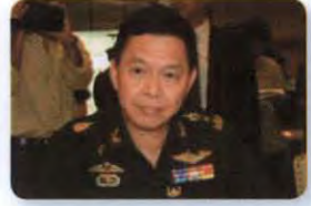
พล.อ. สุชาติ หนองบัว ลำดับที่ ๑๖๕