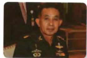
พล.อ. วินัย สร้างสุขดี ลำดับที่ ๒๑๐