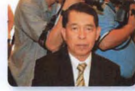
พล.ท. อำพน ชูประทุม ลำดับที่ ๑๙๕