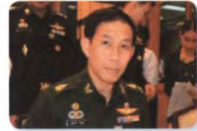
พล.ต. สมโภชน์ วังแก้ว ลำดับที่ ๑๕๙