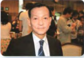
พล.ต.ท. วิบูลย์ บางท่าไม้ ลำดับที่ ๑๒๗