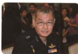
พล.อ.อ. จอม รุ่งสว่าง ลำดับที่ ๐๑๗