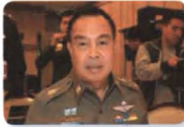
พล.ต.อ. สมยศ พุ่มพันธุ์ม่วง ลำดับที่ ๑๕๕