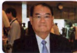
พล.ร.อ. วัลลภ เกิดผล ลำดับที่ ๑๒๒