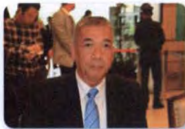
พล.ร.ท. สนธยา น้อยฉายา ลำดับที่ ๑๔๖