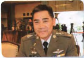
พล.ต.ท. จักรทิพย์ ชัยจินดา ลำดับที่ ๐๑๙