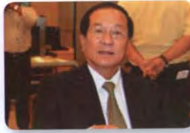
พล.อ. อรุณ สมตน์ ลำดับที่ ๒๑๘