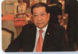
พล.อ. ไตรรัตน์ รังคะรัตน์ ลำดับที่ ๐๔๗