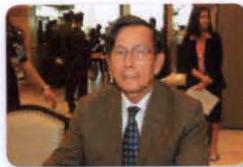
พล.อ. บุญสร้าง เนียมประดิษฐ์ ลำดับที่ ๐๗๗