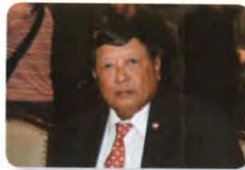
พล.อ.อ. ชาลี จันทร์เรือง ลำดับที่ ๐๓๘