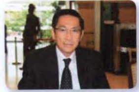
พล.อ. ชยติ สุวรรณมาศ ลำดับที่ ๐๓๐