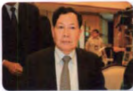
พล.อ.อ. บุญยฤทธิ์ เกิดสุข ลำดับที่ ๐๗๖