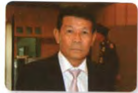
พล.อ. โปฏก บุนนาค ลำดับที่ ๒๐๔