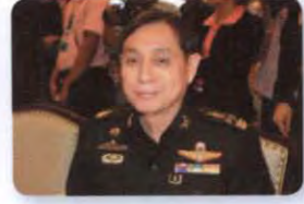
พล.อ. อักษรา เกิดผล ลำดับที่ ๑๘๙