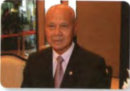
พล.อ. อู๊ด เบื้องบน ลำดับที่ ๑๙๙