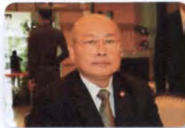
พล.อ. สกนธ์ สัจจานิตย์ ลำดับที่ ๑๔๓