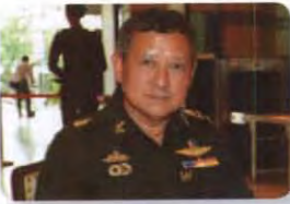
พล.อ. อุทิศ สุนทร ลำดับที่ ๒๒๐