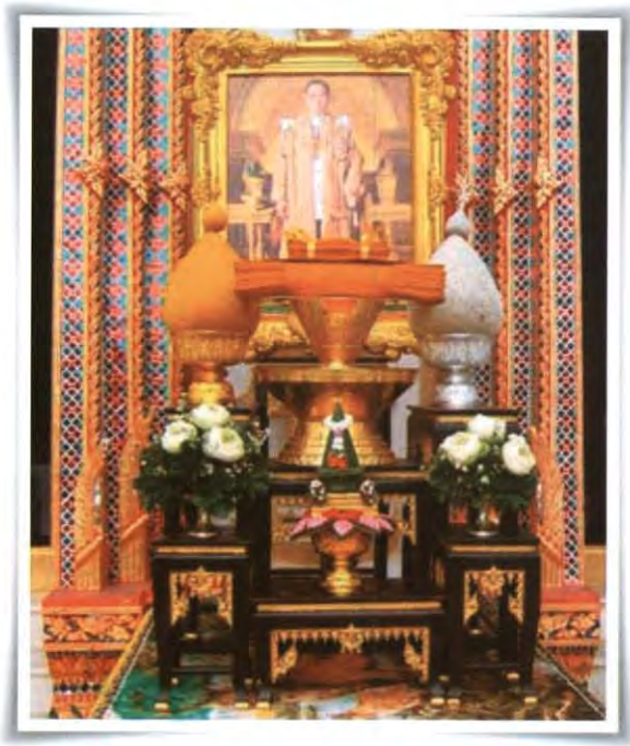
โต๊ะหมู่บูชาพระบรมฉายาลักษณ์ พิธีถวายผ้าพระกฐินพระราชทาน

จากกองศาสนูปถัมภ์ กรมการศาสนา เพื่อนำไปทอด ณ พระอารามที่ขอรับพระราชทานไว้ เมื่อทอดถวายเรียบร้อยแล้วผู้ขอรับพระราชทานจะต้องจัดทำบัญชีรายงานถวายพระราชกุศล ในการถวายผ้าพระกฐินพระราชทาน ส่งไปยังกรมการศาสนา เพื่อจะได้จัดทำบัญชีรายชื่อผู้ขอรับพระราชทานผ้าพระกฐิน ส่งไปยังสำนักเลขาธิการนายกรัฐมนตรี เพื่อแจ้งให้ สำนักเลขาธิการนำความกราบบังคมทูลพระกรุณาทราบฝ่าละอองธุลีพระบาท เพื่อถวายพระราชกุศลในการที่หน่วยงาน องค์กรหรือบุคคลทั่วไป อัญเชิญผ้าพระกฐินไปถวาย ณ อารามนั้น