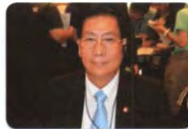
พล.อ. มารุต ปิซโซตะสิงห์ ลำดับที่ ๑๑๐