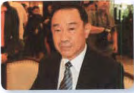
พล.อ. ทรงกิตติ จักกาบาตร์ ลำดับที่ ๐๔๙