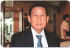
พล.อ. สมเจตน์ บุญถนอม ลำดับที่ ๑๕๘