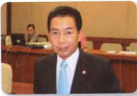
พล.ต. อภิรัชต์ คงสมพงษ์ ลำดับที่ ๒๑๗