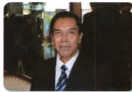
พล.อ. วีรณ ฉันทศาสตร์โกศล ลำดับที่ ๑๓๑