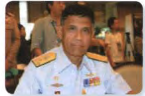
พล.ร.ท. วีระพันธ์ สุขก้อน ลำดับที่ ๑๒๙