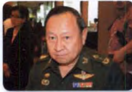
พล.ท. ศุภกร สงวนชาติศรไกร ลำดับที่ ๑๔๒