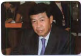
พล.อ.อ. ชนะ อยู่สุภาพร ลำดับที่ ๐๒๘