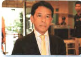
พล.ร.อ. ธราธร ขจิตสุวรรณ ลำดับที่ ๐๕๖