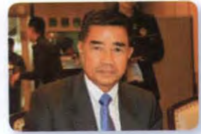
พล.ท. เฉลิมชัย สิทธิสาท ลำดับที่ ๐๒๗