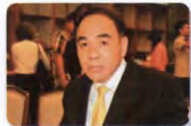
พล.ท. กัมปนาท รุดติษฐ์ ลำดับที่ ๐๐๖