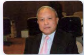
พล.ต.ท. บุญเรือง ผลพานิชย์ ลำดับที่ ๐๗๘