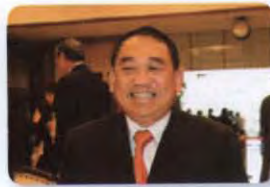
พล.อ.อ. ชนัท รัตนอุบล ลำดับที่ ๐๒๙