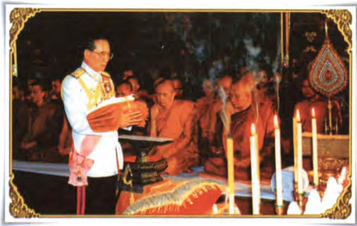
พระบาทสมเด็จพระเจ้าอยู่หัว ทรงบำเพ็ญพระราชกุศลถวายผ้าพระกฐิน

๑. พระกฐินหลวง เป็นพระราชกรณียกิจของพระมหากษัตริย์ผู้ทรงเป็นพุทธมามกะ และเอกอัครพุทธศาสนูปถัมภก เสด็จพระราชดำเนินถวายผ้าพระกฐินด้วยพระองค์เองหรือทรงพระกรุณาโปรดเกล้าฯ ให้สมเด็จพระราชินี พระราชโอรส พระราชธิดา เสด็จพระราชดำเนิน ทรงปฏิบัติพระราชกรณียกิจแทนพระองค์ รวมทั้งพระกฐินที่ทรงพระกรุณาโปรดเกล้าฯ ให้พระบรมวงศานุวงศ์ ราชสกุล องคมนตรี หรือผู้ทรงพระราชดำริเห็นสมควรให้เสด็จฯ แทนพระองค์นำไปถวายยังพระอารามหลวงสำคัญ ๑๖ พระอาราม ที่สงวนไว้ไม่ให้มีการขอพระราชทาน คือ