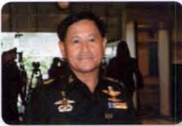
พล.อ. วลิต โรจนภักดี ลำดับที่ ๑๑๘