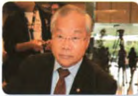
พล.อ. โสภณ ศีลพิพัฒน์ ลำดับที่ ๑๗๙