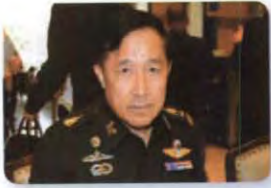
พล.อ. ฉัตรเฉลิม เฉลิมสุข ลำดับที่ ๐๒๕