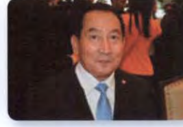
พล.อ.อ. อิทธิพร ศุภวงศ์ ลำดับที่ ๑๙๗