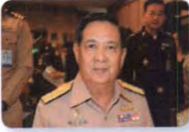
พล.ร.อ. พลวัฒน์ สีโรตม ลำดับที่ ๐๙๑