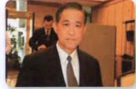
พล.อ. วรพงษ์ สง่าเนตร ลำดับที่ ๑๑๗