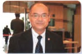
พล.อ. สิงห์ศึก สิงห์ไพร ลำดับที่ ๑๖๒