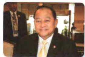
พล.อ. กิตติพงษ์ เกษโกวิท ลำดับที่ ๐๑๒