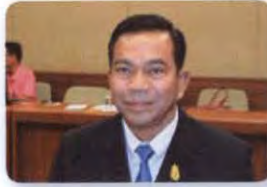
พล.ต. ณัฐ อินทรเจริญ ลำดับที่ ๑๙๑