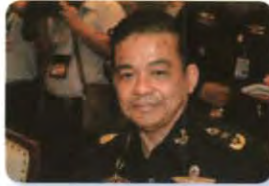
พล.ท. สุวโรจน์ ทิพย์มงคล ลำดับที่ ๑๗๖