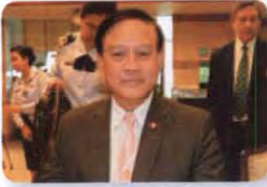
พล.ร.อ. อมรเทพ ณ บางช้าง ลำดับที่ ๑๘๗