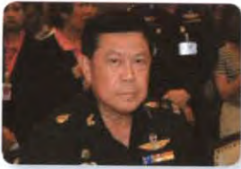
พล.ท. กิตติ อินทสร ลำดับที่ ๐๑๐