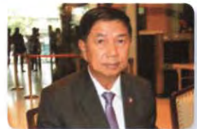
พล.อ. ยอดยุทธ บุญญาธิการ ลำดับที่ ๑๑๑