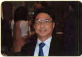
นายกรรณภว์ ธนภรรคภวิน ลำดับที่ ๐๐๑

ในกรณี นี้ ได้มีพระบรมราชโองการโปรดเกล้าฯ แต่งตั้งสมาชิกสภานิติบัญญัติแห่งชาติ เพิ่มเติมตามมาตรา ๖ ของรัฐธรรมนูญแห่งราชอาณาจักรไทย (ฉบับชั่วคราว) พุทธศักราช ๒๕๕๗ เมื่อวันที่ ๒๕ กันยายน ๒๕๕๗ จำนวน ๒๘ คน ทำให้มีสมาชิกสภานิติบัญญัติแห่งชาติ รวมทั้งสิ้น จำนวน ๒๒๐ คน ตามลำดับรายชื่อดังต่อไปนี้