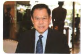
พล.ร.อ. ชุมนุ้ม อัจวงษ์ ลำดับที่ ๐๓๙