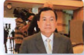
พล.อ. วิชญ์ เทพหัสดิน ณ อยุธยา ลำดับที่ ๑๒๓