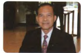
พล.ท. จเรศักดิ์ อานุภาพ ลำดับที่ ๐๔๒