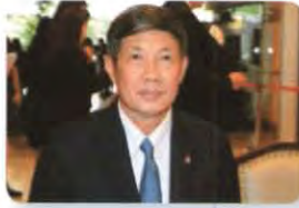
พล.อ. วิลาศ อรุณศรี ลำดับที่ ๑๒๘