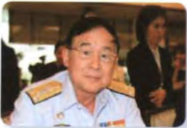
พล.ร.อ. ชุมพล วงศ์เวคิน ลำดับที่ ๐๔๐