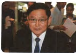
พล.ต. กู้เกียรติ ศรีนาคา ลำดับที่ ๐๑๔