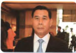
พล.อ. คณิต สาพิทักษ์ ลำดับที่ ๐๑๖