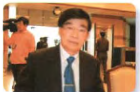
พล.อ. อุดุลยเดช อินทะพงษ์ ลำดับที่ ๑๘๓