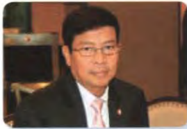
พล.อ. สมหมาย เกาฏีระ ลำดับที่ ๑๕๗