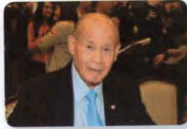
พล.ต. จารึก อารีราชการันย์ ลำดับที่ ๐๒๐