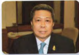
พล.อ. จิระเดช โมกขะสมิต ลำดับที่ ๐๒๓