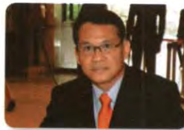
พล.ท. พิศณุ พุทธวงศ์ ลำดับที่ ๒๐๖