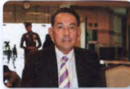
พล.อ.อ. ศิวเกียรติ์ ชยเมฆะ ลำดับที่ ๑๔๐