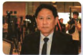
พล.อ. อกนิษฐ์ หมั่นสวัสดิ์ ลำดับที่ ๑๘๐