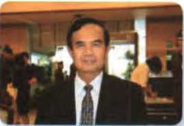
พล.ร.อ. นพดล โชคระดา ลำดับที่ ๐๖๕