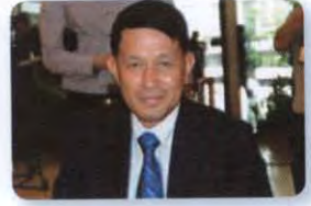
พล.อ.อ. ถาวร มณีพฤกษ์ ลำดับที่ ๐๔๘