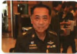
พล.ต.อ. เอก อังสนานนท์ ลำดับที่ ๒๐๐