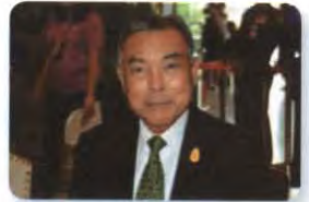
พล.อ. วีระเดช มีเพียร ลำดับที่ ๐๖๓