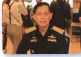
พล.อ.อ. ทรงธรรม โชคคณาพิทักษ์ ลำดับที่ ๐๕๐