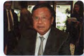
พล.อ. สกต ขึ้นตระกุล ลำดับที่ ๑๔๔