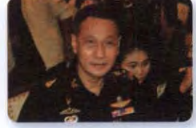
พล.อ. ไชยยนต์ คำทันเจริญ ลำดับที่ ๐๙๙