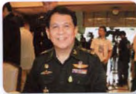
พล.อ. นิวัติ ศรีเพ็ญ ลำดับที่ ๐๗๑