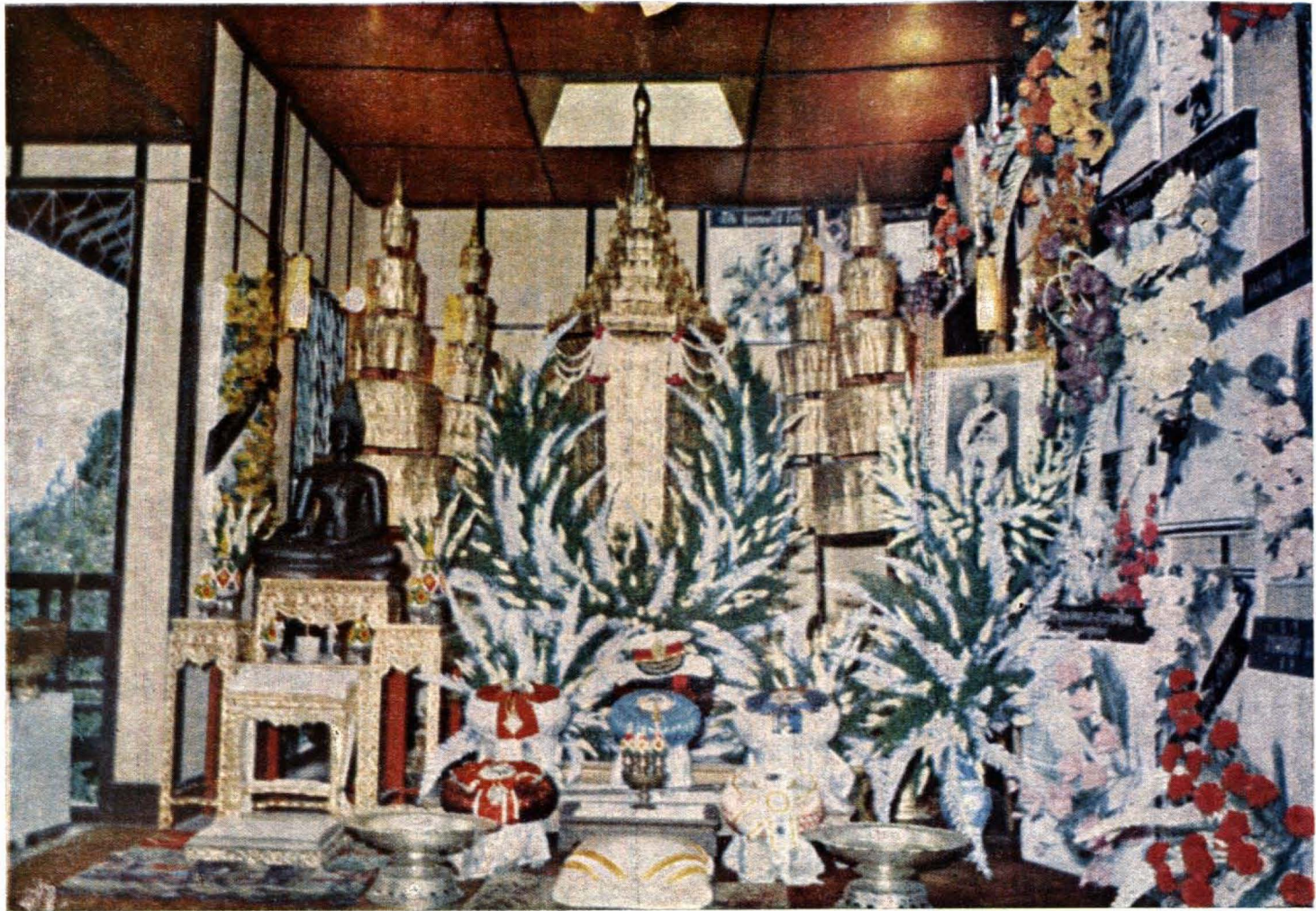
โกศศพ พลเอกเกา บริรักษ์ที่ยุทธกิจ ณ บ้านเลขที่ ๔๗ ซอยสุขุมวิท ๓๕