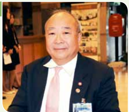
นายปิยพันธุ์ นิมนานเหมินท์ สมาชิกวุฒิสภาสรรหา ภาครัฐ

ผมดีใจและมีความภาคภูมิใจที่ได้รับคัดเลือกเข้ามาทำหน้าที่ในฐานะสมาชิกวุฒิสภา โดยกรมบัญชีกลางเป็นผู้เสนอรายชื่อ หลังจากที่เคยยึดราชการมา ๒ ปี คิดว่าความรู้ ความสามารถ และประสบการณ์ต่าง ๆ ของตนเองที่สั่งสมมานั้นยังสามารถสร้างคุณประโยชน์ให้กับประเทศชาติได้อีกมาก ตามบทบาทหน้าที่ของวุฒิสภาที่รัฐธรรมนูญฯ ได้กำหนดไว้โดยผมยึดหลักคำปฏิญาณตนที่ได้แสดงไว้ในการประชุมสภาครั้งแรก รวมถึงนำพระบรมราโชวาทของพระบาทสมเด็จพระเจ้าอยู่หัว มาเป็นหลักในการปฏิบัติงานอย่างเต็มความสามารถ ในส่วนคณะกรรมการสามัญนั้น ผมทำหน้าที่เป็นกรรมการที่ปรึกษา ในคณะกรรมการการศาสนา คุณธรรม จริยธรรม ศิลปะและวัฒนธรรม วุฒิสภา และเป็นรองประธานคณะกรรมการฯ คนที่สาม ในคณะกรรมการการเงิน การคลัง การธนาคารและสถาบันการเงิน วุฒิสภา