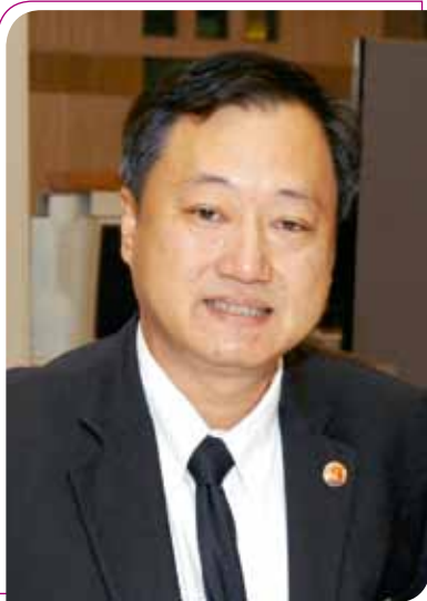
นายสมชาย แสวงการ ประธานคณะกรรมการสิทธิมนุษยชน สิทธิเสรีภาพ และการคุ้มครองผู้บริโภค วุฒิสภา

สุดท้ายคณะกรรมการฯ ขอฝากถึงประชาชนที่มีความประสงค์จะไปทำงานต่างประเทศ ต้องเตรียมความพร้อมก่อนเดินทางไป คือ การเรียนภาษา เรียนรู้ขนบธรรมเนียมประเพณี และกฎหมายเบื้องต้นของประเทศที่จะเดินทางไปทำงาน เมื่อได้ทำงานแล้วต้องหลีกเลี่ยงอบายมุขทั้งปวงโดยเฉพาะสุรา และการพนัน พยายามประหยัดเพื่อนำเงินกลับประเทศเมื่อครบกำหนดสัญญาจ้าง