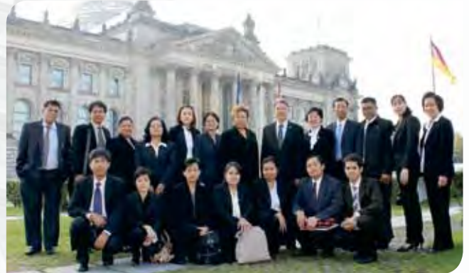
• คณะฯ ถ่ายภาพร่วมกันบริเวณหน้าอาคารรัฐสภา

ชาวเยอรมันให้ความสนใจในเรื่องการเมืองสูงมาก เนื่องจากมีการปลูกฝังและสร้างจิตสำนึกเรื่องการเมืองการปกครอง และการมีส่วนร่วมในทางการเมืองแก่ประชาชนให้สนใจตั้งแต่วัยเด็ก อีกทั้งสมาชิกรัฐสภาจะเป็นผู้ที่ประชาสัมพันธ์ให้กับประชาชนผู้สนใจ