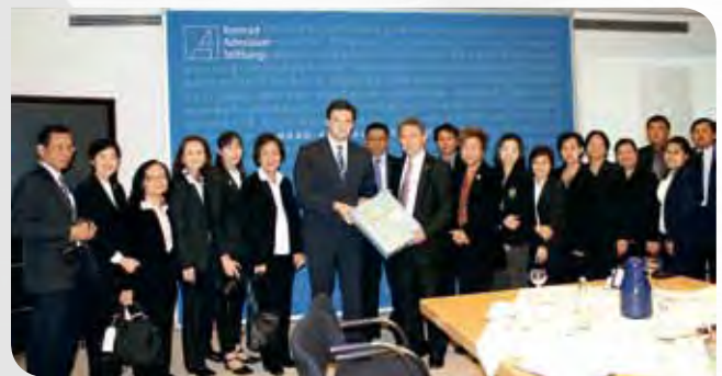
• ศึกษาดูงาน ณ มูลนิธิคอนราต อเดนาวร์

ผู้ใหญ่ และมีการจัดเนื้อหาและสื่อให้เหมาะสมกับทุกกลุ่ม อย่างไรก็ตาม การฝึกอบรมให้ความรู้เกี่ยวกับการเมือง รัฐสภาไม่ได้ทำหน้าที่นี้โดยตรง แต่ให้เป็นหน้าที่ของมูลนิธิต่าง ๆ ที่รับเงินสนับสนุนจากรัฐและพรรคการเมือง ไปดำเนินการอบรมให้ความรู้แก่กลุ่มเป้าหมายต่าง ๆ เช่น มูลนิธิคอนราต อเดนาวร์ ขณะเดียวกันทุกพรรคการเมืองก็ต้องทำหน้าที่ในการเสริมสร้างความรู้ให้แก่ประชาชน ในฐานะที่เป็นองค์กรทางการเมือง