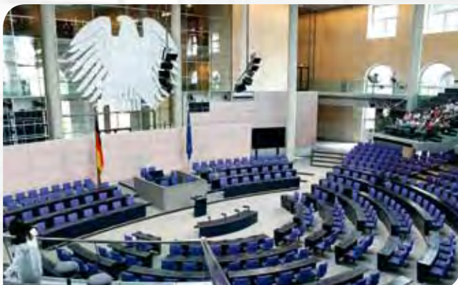
• ห้องประชุมรัฐสภา

นอกจากนั้น อาคารรัฐสภาของเยอรมนียังได้รับความนิยมนจากประชาชนทั่วไปทั้งในประเทศและต่างประเทศในการเข้าเยี่ยมชมเป็นจำนวนมาก เนื่องจากมีการออกแบบด้วยรูปลักษณะที่ทันสมัยผสมผสานกับสถาปัตยกรรมดั้งเดิม จนกลายเป็นแหล่งท่องเที่ยว