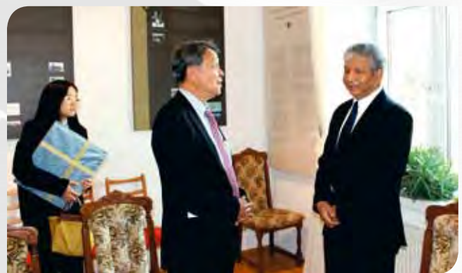
• เยี่ยมคารวะเอกอัครราชทูตประจำกระทรวง

การศึกษาดูงานของสมาชิกวุฒิสภา ผู้บริหารและข้าราชการสำนักงานเลขาธิการวุฒิสภาในครั้งนี้ ประสบความสำเร็จสมตามเจตนารมณ์ทุกประการ โดยได้รับการต้อนรับจากหน่วยงานที่เกี่ยวข้องอย่างอบอุ่นและสมเกียรติ ยังผลให้เกิดการยกระดับและกระชับความสัมพันธ์ระดับทวิภาคีของทั้งสองประเทศ ซึ่งเป็นมิตรประเทศที่ดีต่อกันมาช้านาน อีกทั้งองค์ความรู้ต่าง ๆ ที่ได้รับจากการไปศึกษาดูงาน ทางคณะฯ จะได้นำมาพัฒนาต่อยอดโครงการต่าง ๆ ในงานด้านการประชาสัมพันธ์ การบริหารจัดการงบประมาณ และการจัดสภาพแวดล้อมและอาคารสถานที่ ซึ่งจะยังประโยชน์ต่อการสนับสนุนงานด้านนิติบัญญัติให้กับวุฒิสภาและสำนักงานเลขาธิการวุฒิสภาสืบต่อไป