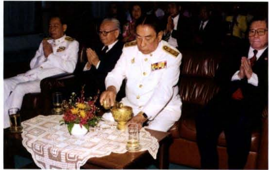
ร่วมกิจกรรมในวันคล้ายวันสถาปนาราชบัณฑิตยสถาน ปีที่ ๖๕ เมื่อวันที่ ๓๑ มีนาคม พ.ศ. ๒๕๔๒ และได้มอบเครื่องราชอิสริยาภรณ์และโล่แก่ข้าราชการดีเด่น ณ ห้องประชุมราชบัณฑิตยสถาน