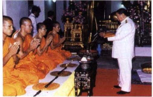
นำผ้าพระกฐินพระราชทานไปถวาย ณ วัดนางชี เขตภาษีเจริญ กรุงเทพมหานคร เมื่อวันที่ ๒๘ ตุลาคม พ.ศ. ๒๕๔๐