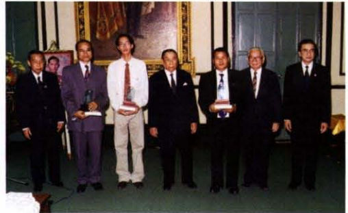
เป็นประธานในพิธีมอบรางวัลและประกาศ เกียรติคุณแก่ผู้ชนะการประกวดรูปแบบตัวอักษรไทย ณ ห้องประชุม ๑ ราชบัณฑิตยสถาน เมื่อวันที่ ๒๙ สิงหาคม พ.ศ. ๒๕๔๐