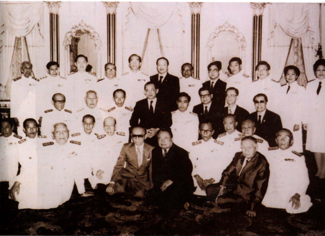
เข้าเฝ้าทูลละอองธุลีพระบาทพร้อมคณะราชบัณฑิตและข้าราชการ ในโอกาสที่ราชบัณฑิตยสถานได้รับการสถาปนาครบ ๘๐ ปี ณ พระตำหนักจิตรลดารโหฐาน เมื่อวันที่ ๒๗ สิงหาคม พ.ศ. ๒๕๒๗