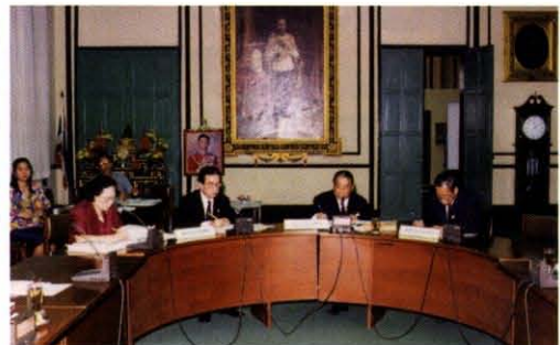
เป็นประธานในการประชุมราชบัณฑิตทั้ง ๓สำนักร่วมกัน เมื่อวันที่ ๒๙ สิงหาคม พ.ศ. ๒๕๔๐ เพื่อพิจารณาร่างพระราชบัญญัติ ราชบัณฑิตยสถาน ซึ่งแก้ไขปรับปรุงใหม่แทนพระราชบัญญัติฉบับ พุทธศักราช ๒๔๘๕ และฉบับที่ ๒ พุทธศักราช ๒๔๘๗