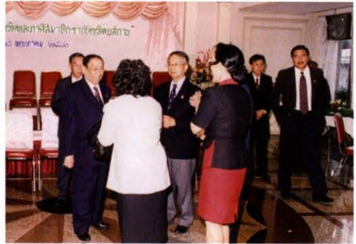
ร่วมงานสังสรรค์ราชบัณฑิต และภาคี สมาชิกราชบัณฑิตยสถาน ณ โรงแรมรัตนโกสินทร์ เมื่อวันที่ ๒๕ พฤษภาคม พ.ศ. ๒๕๔๐