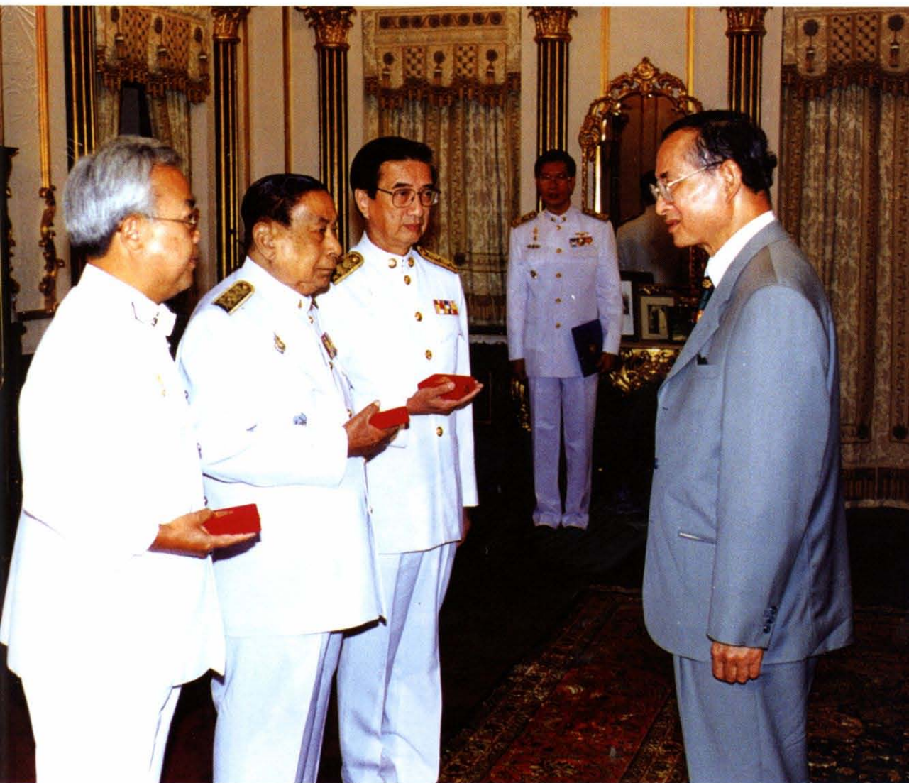
เข้าเฝ้าทูลละอองธุลีพระบาท เนื่องในโอกาสที่ได้รับพระราชทานเหรียญดุษฎีมาลาเข็มศิลปวิทยา ประจำปี ๒๕๔๐ เมื่อวันที่ ๑๙ สิงหาคม พ.ศ. ๒๕๔๑