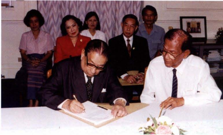
รับมอบงานบริหารเมื่อได้รับเลือกให้ดำรงตำแหน่งนายกรัฐมนตรีสถาน ตั้งแต่วันที่ ๑๒ เมษายน พ.ศ. ๒๕๔๐ ถึงวันที่ ๑๑ เมษายน พ.ศ. ๒๕๔๒