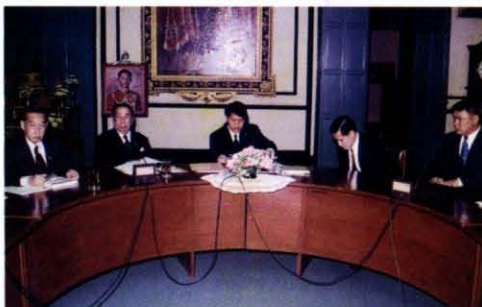
ต้อนรับรัฐมนตรีช่วยว่าการกระทรวงศึกษาธิการ นายสมศักดิ์ ปริศนานันทกุล ผู้ได้รับมอบหมาย จากรัฐมนตรีว่าการกระทรวงศึกษาธิการให้กำกับ ดูแลราชบัณฑิตยสถานที่ได้มาตรวจเยี่ยมราชบัณฑิตยสถาน เมื่อวันที่ ๓๐ มกราคม พ.ศ. ๒๕๔๑