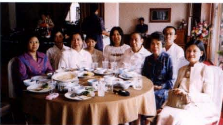
ราชบัณฑิต และข้าราชการราชบัณฑิตยสถานร่วมงาน ในโอกาสวันคล้ายวันเกิด ณ วัดยานนาวา กรุงเทพฯ เมื่อวันที่ ๑๕ มกราคม พ.ศ. ๒๕๔๖