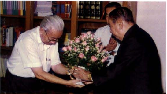
ราชบัณฑิต กรรมการ และข้าราชการร่วมกันมอบกระเช้าดอกไม้ เพื่อแสดงความยินดี เนื่องในโอกาสวันคล้ายวันเกิด ในวันที่ ๑๕ มกราคมเป็นประจำทุกปี