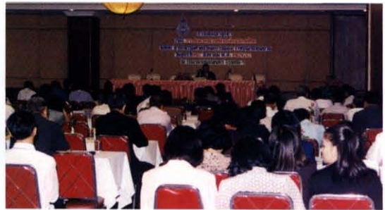
แสดงปาฐกถา เรื่อง “การปกครองส่วนท้องถิ่นในประเทศไทย” จัดโดย สำนักกรรมศาสตร์และการเมือง ราชบัณฑิตยสถาน ณ ห้องราชา โรงแรมรัตนโกสินทร์ กรุงเทพฯ เมื่อวันที่ ๒๘ สิงหาคม พ.ศ. ๒๕๔๔