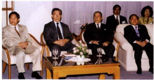
ต้อนรับพลเอก เปรม ติณสูลานนท์ ประธานองคมนตรีและรัฐบุรุษในงานสัมมนาโครงการปราชญ์เพื่อแผ่นดิน เรื่อง “ปรัชญาการพัฒนา : ทฤษฎีใหม่ตามแนวพระราชดำริ” ณ สถาบันข้าราชการพลเรือน ถ.ติวานนท์ อ.เมืองฯ จ.นนทบุรี เมื่อวันที่ ๖ พฤศจิกายน พ.ศ. ๒๕๔๒