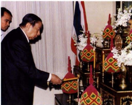
เป็นประธานในพิธีเปิดการสัมมนาเรื่อง “การแก้ ภาวะวิกฤตสังคมไทย” ณ ห้องประชุมราชบัณฑิตยสถาน เมื่อวันที่ ๗ พฤศจิกายน พ.ศ. ๒๕๔๐