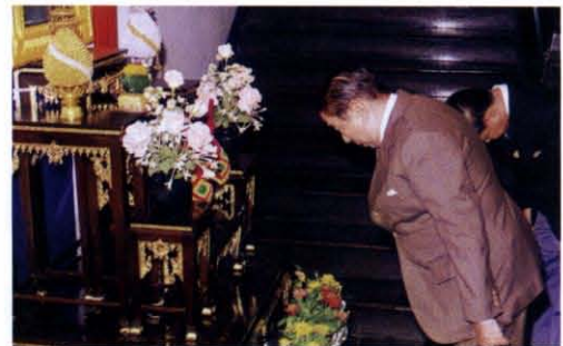
ร่วมกิจกรรมในสัปดาห์ส่งเสริมพระพุทธศาสนา เมื่อวันที่ ๔ ธันวาคม พ.ศ. ๒๕๔๐