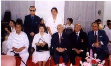
ราชบัณฑิต และข้าราชการ ราชบัณฑิตยสถานร่วมงาน ในโอกาสวันคล้ายวันเกิด ณ วัดมหาธาตุยุวราชรังสฤษฎิ์ กรุงเทพฯ เมื่อวันที่ ๑๕ มกราคม พ.ศ. ๒๕๔๘