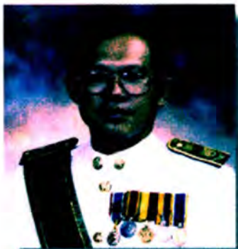
นายมนตรี รูปสุวรรณ เลขาธิการวุฒิสภา