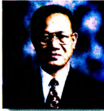
พลตรี มนูญกฤต รูปขจร ประธานวุฒิสภา เลขที่ ส.ว. ๑๐๓