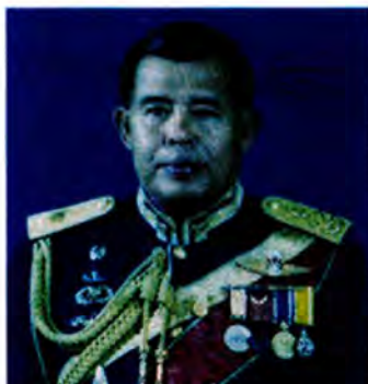
พลเอก ศิริ ทิวะพันธุ์ สมาชิกรัฐสภาจังหวัดพิษณุโลก เลขที่ ส.ว. ๑๓๗