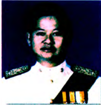
นายชุมพล ศิลปอาชา สมาชิกวุฒิสภากรุงเทพมหานคร เลขที่ ส.ว. ๐๓๐